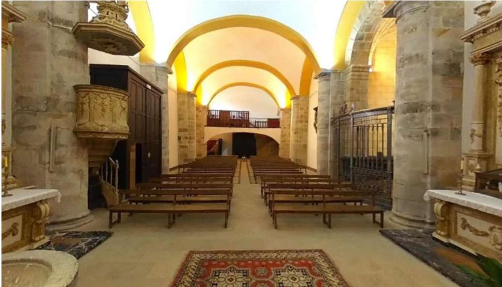
Iglesia de san martin obispo iglesia catolica