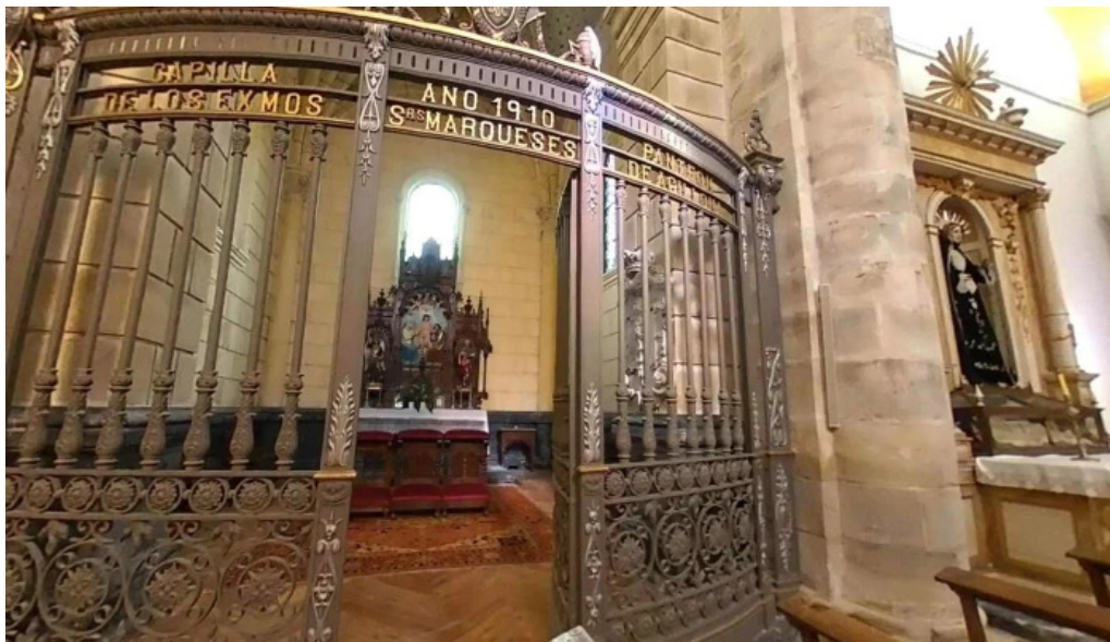
Iglesia de san martin obispo iglesia