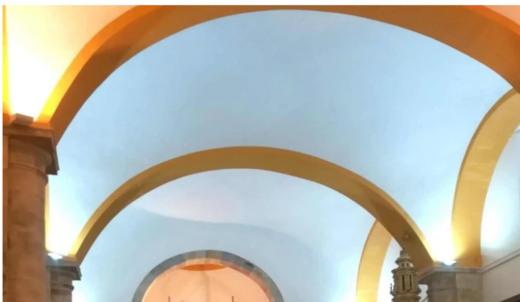
Iglesia de san martin obispo opiniones