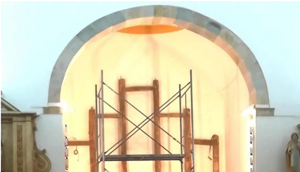
Iglesia de san martin obispo arrieta