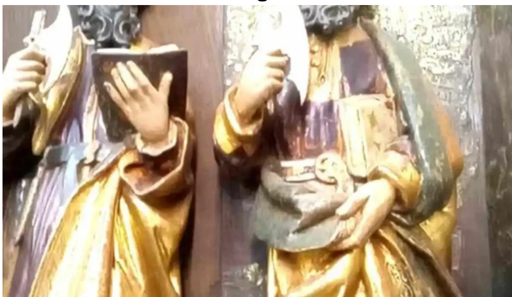
Iglesia de san martin obispo videos