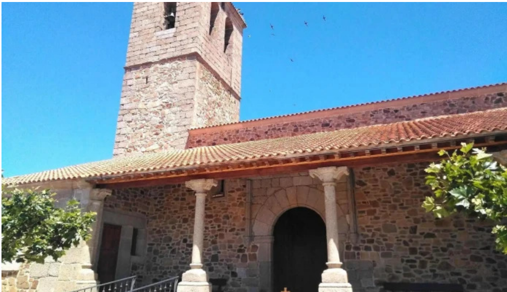
Iglesia de nuestra senora del rosario iglesia catolica