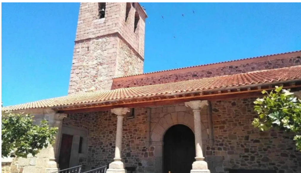
Iglesia de nuestra senora del rosario armenteros