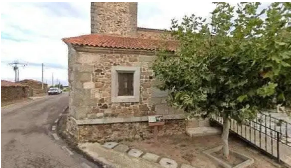
Iglesia de nuestra senora del rosario precios