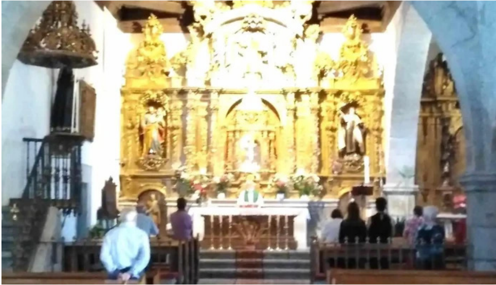
Iglesia de nuestra senora del rosario iglesia