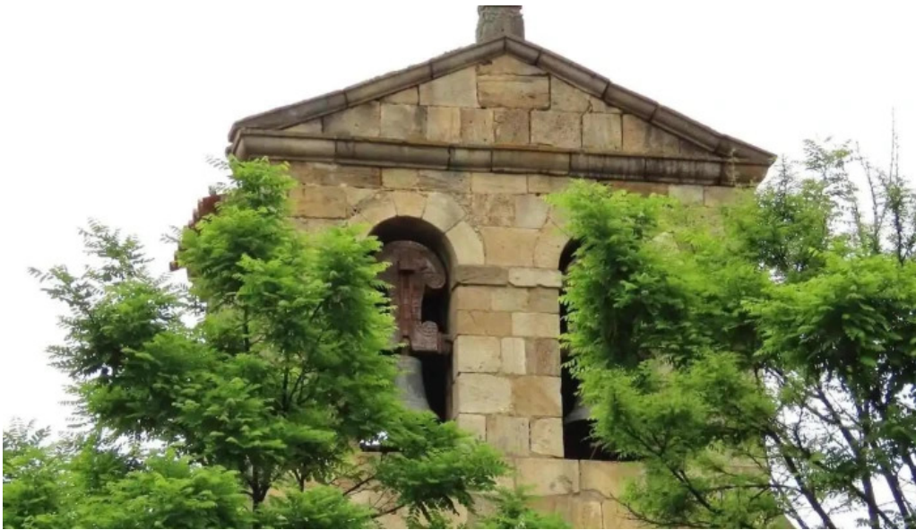
Iglesia de san juan bautista iglesia