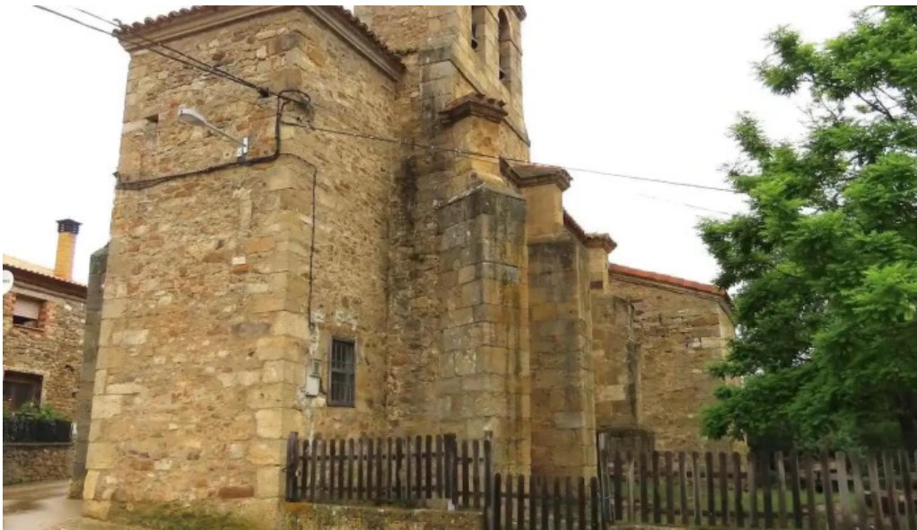
Iglesia de san juan bautista iglesia catolica