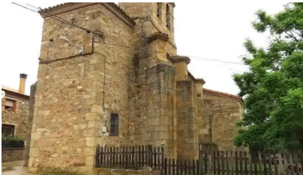
Iglesia de san juan bautista arguijo