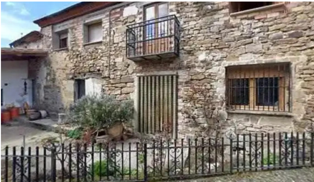
Iglesia de san juan bautista telefono