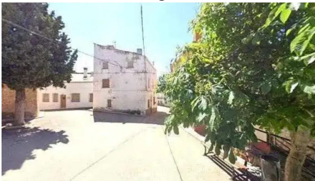
Iglesia de nuestra senora de la asuncion nuestra