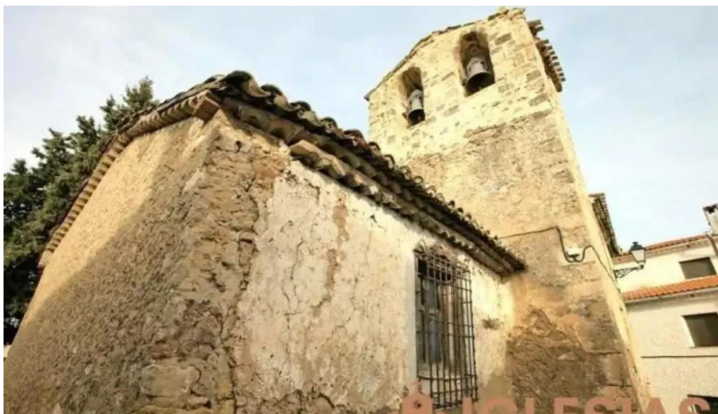
Iglesia de nuestra senora de la asuncion iglesia

Iglesia de nuestra senora de la asuncion mapa