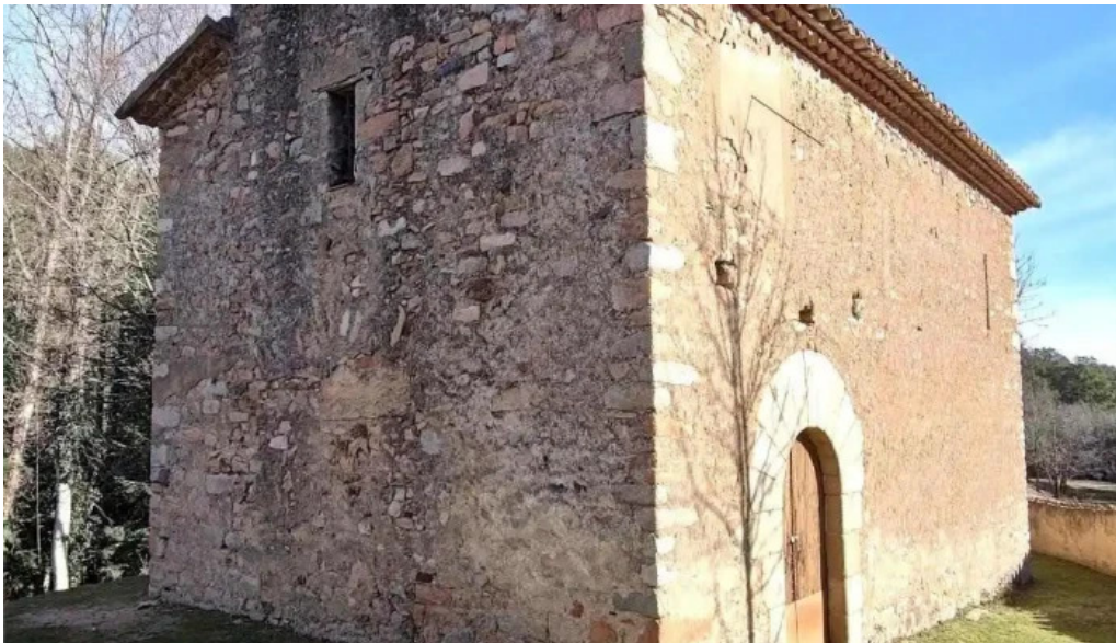
Santa maria de lliors iglesia catolica