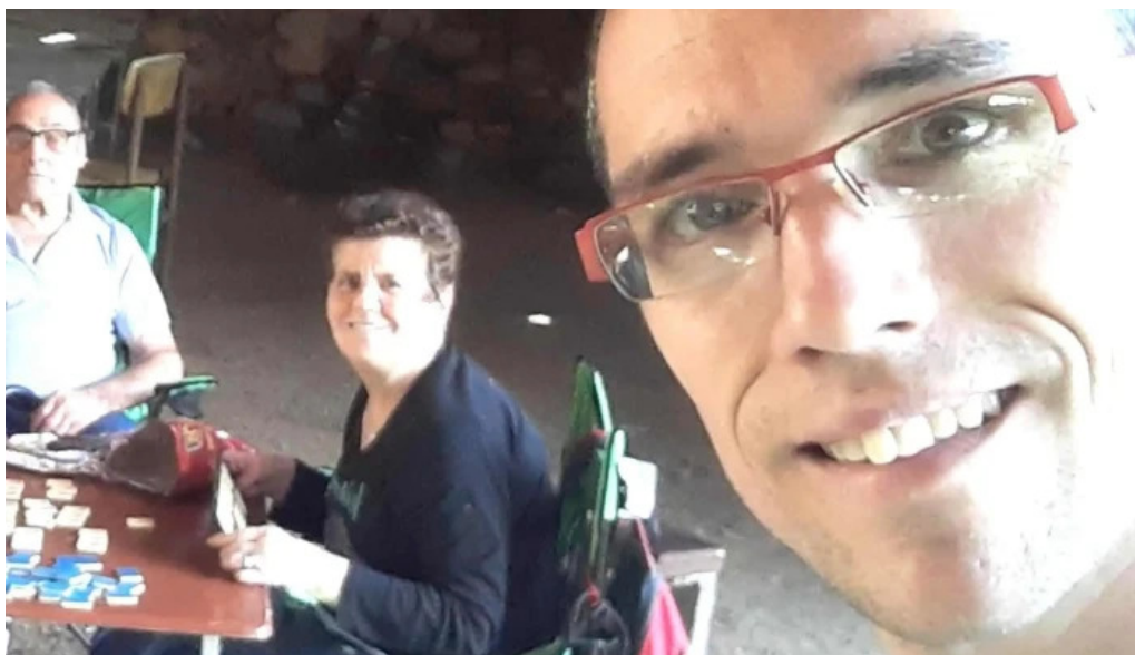
Santa maria de lliors arbucies