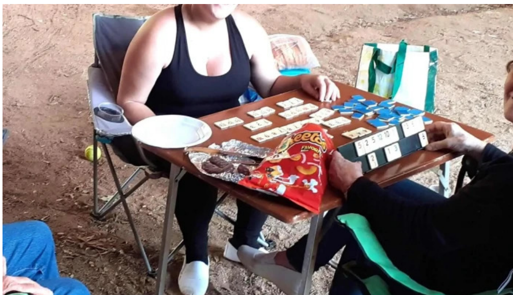
Santa maria de lliors comentarios