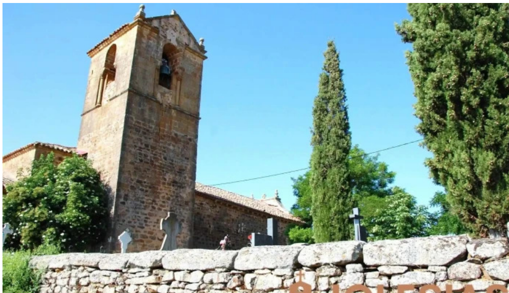
Iglesia de nuestra senora de la asuncion iglesia catolica