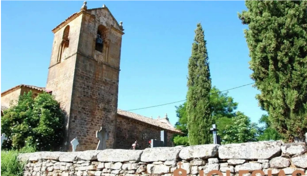
Iglesia de nuestra senora de la asuncion arancon