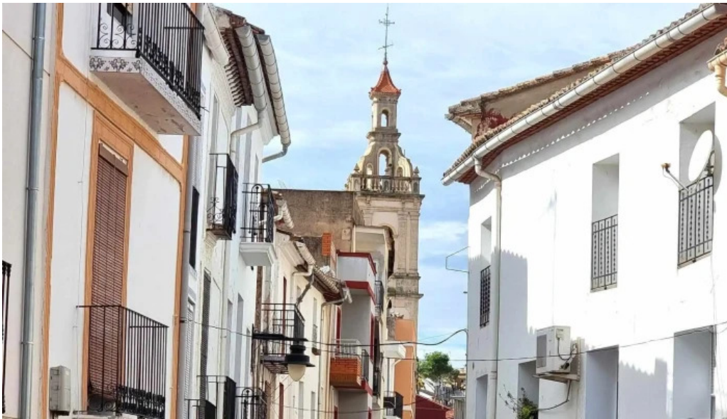
Iglesia ana sitio web