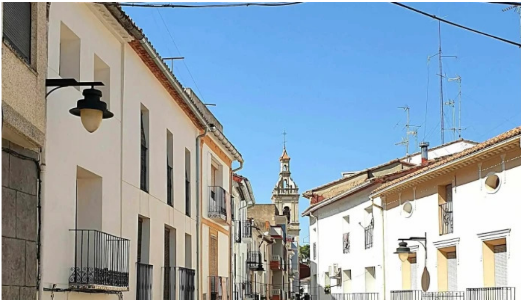
Iglesia anna anna