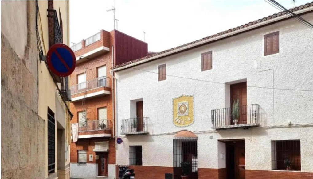
Iglesia anna catalogo