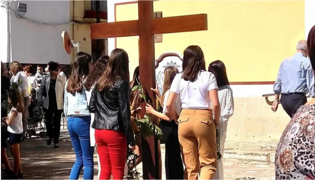
Iglesia ana descuentos