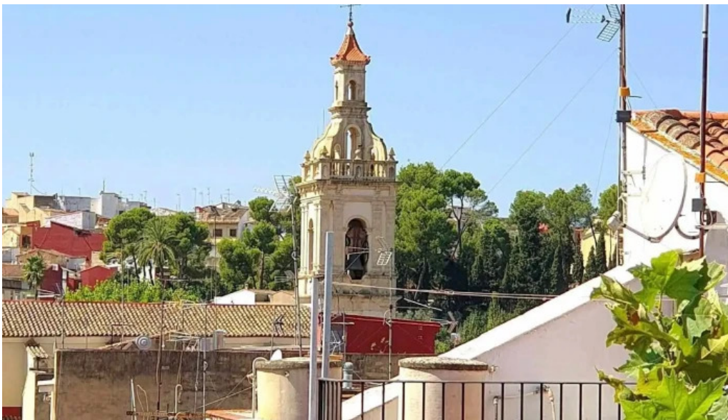
Iglesia ana iglesia catolica