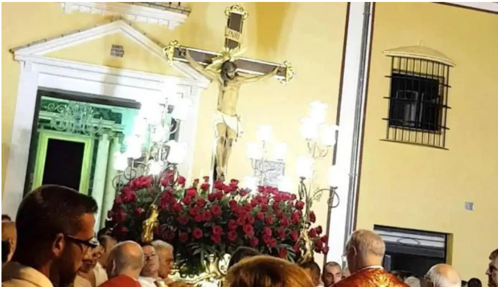
Iglesia ana iglesia