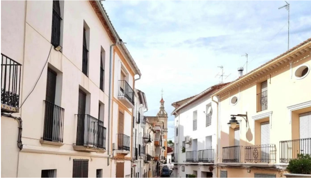
Iglesia ana telefono