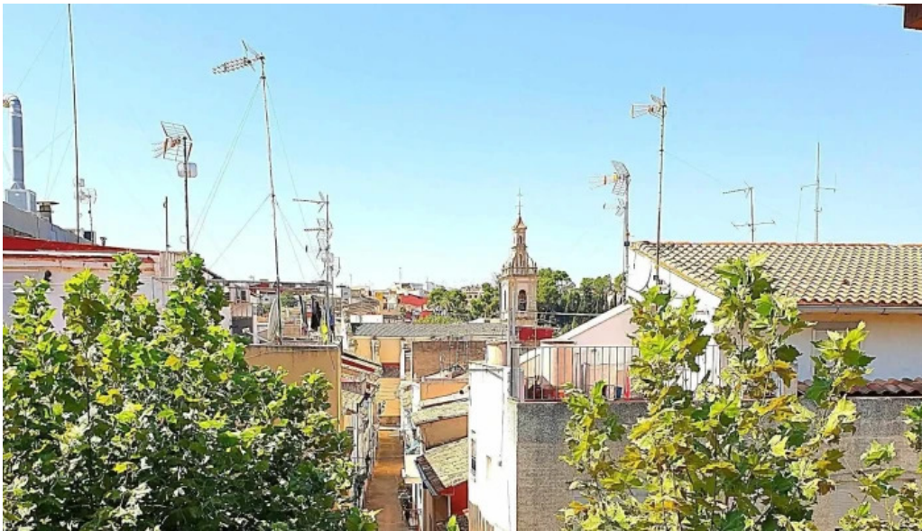
Iglesia ana comentarios