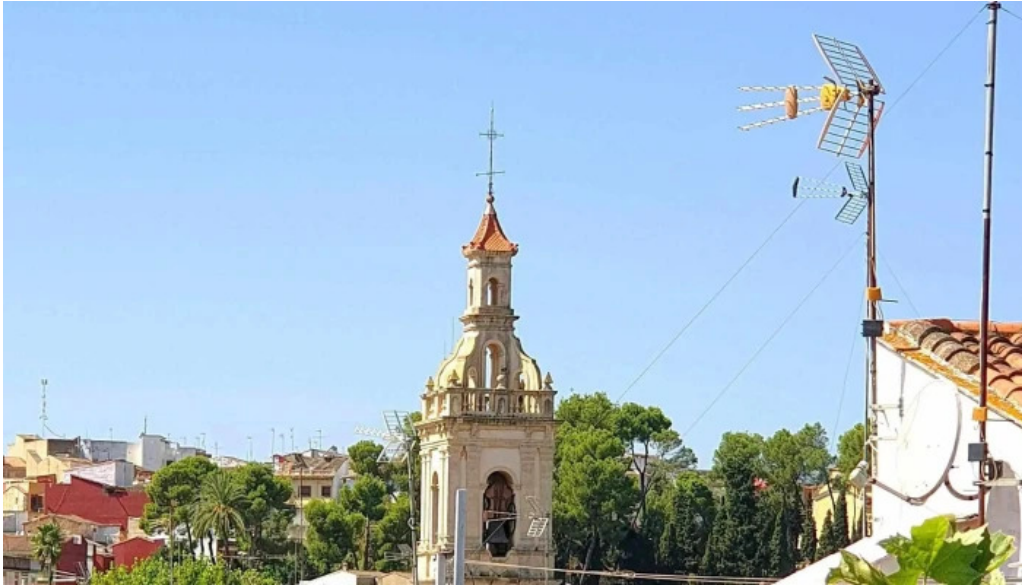
Iglesia ana opiniones