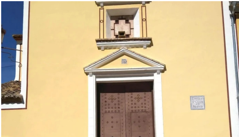
Iglesia anna videos