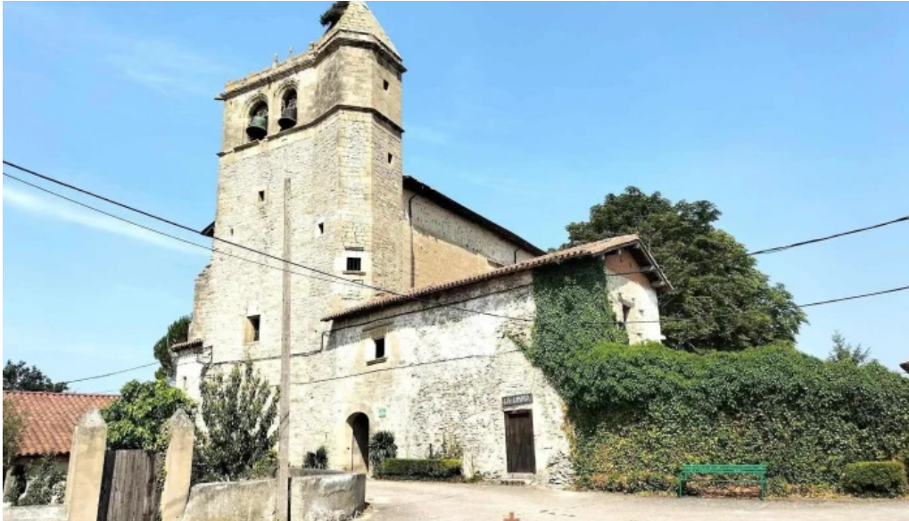
Iglesia de anastro iglesia catolica