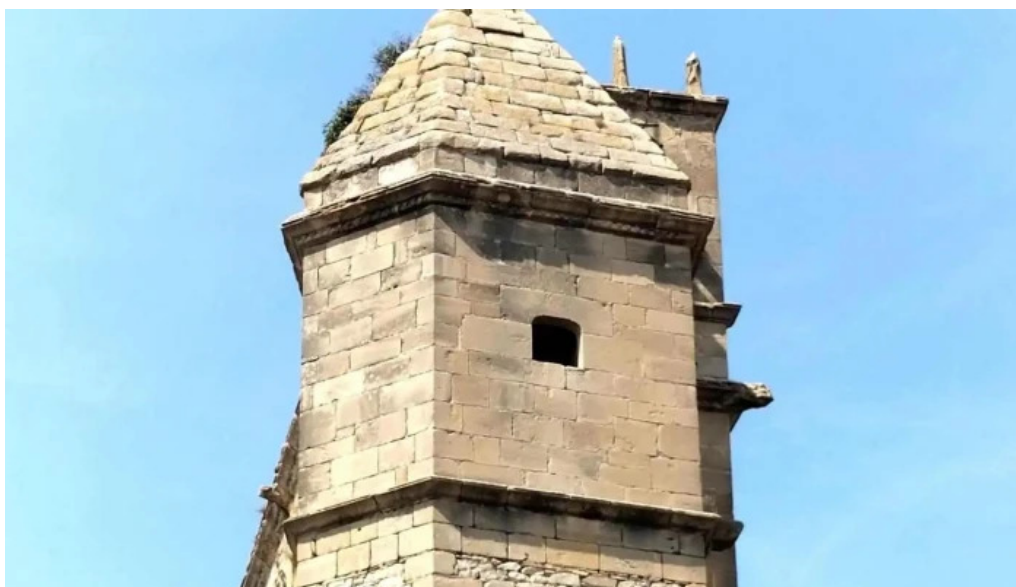
Iglesia de anastro iglesia