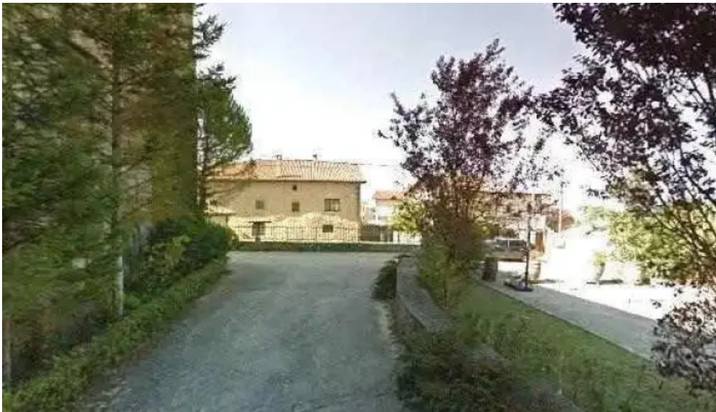
Iglesia de anastro fotos