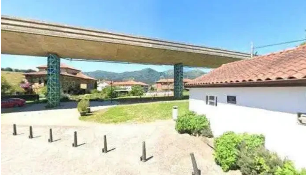
Ermita de santiago descuentos