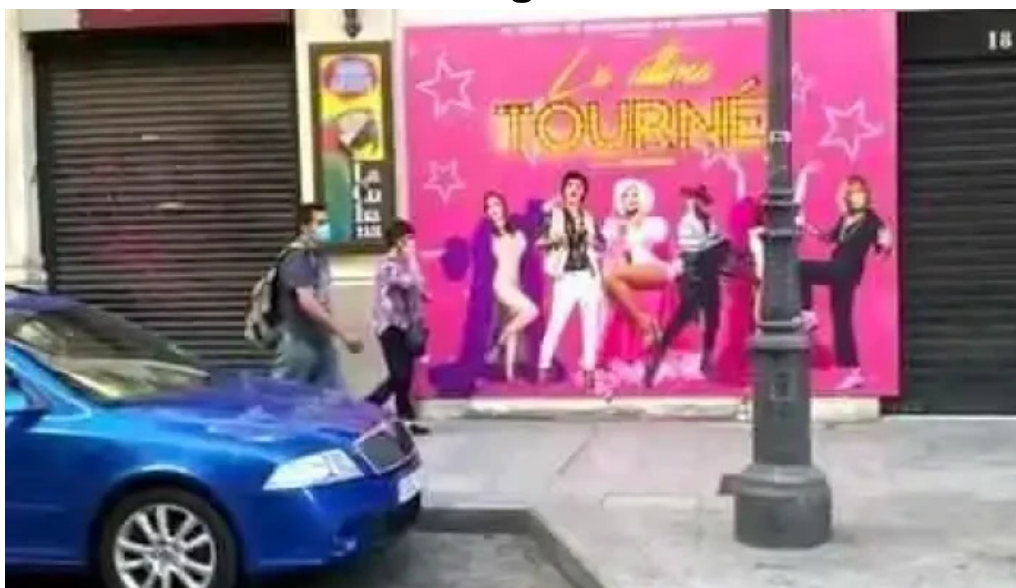
Ermita de santiago videos