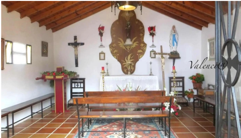
Ermita de santiago iglesia