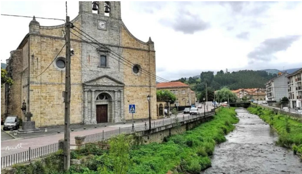
Ermita de santiago ampuero