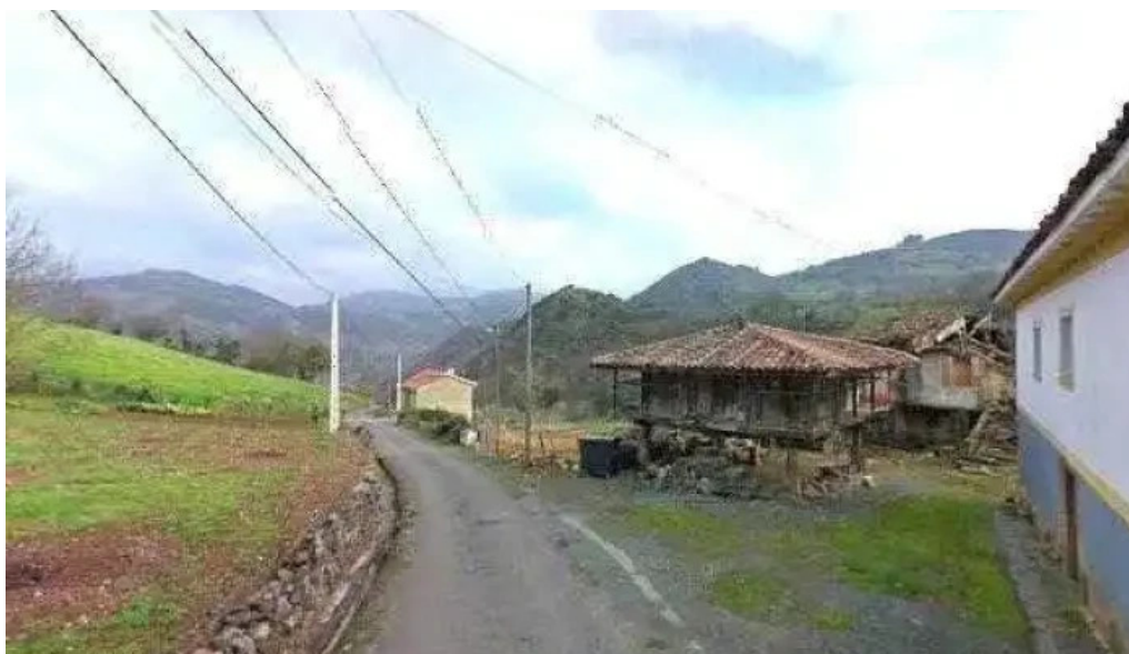
Iglesia de san salvador iglesia