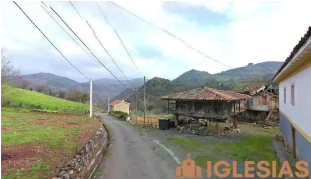
Iglesia de san salvador ambas