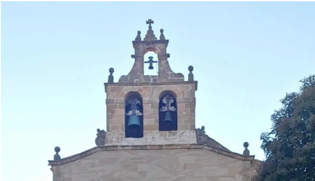
Ermita de la virgen de la llana horario