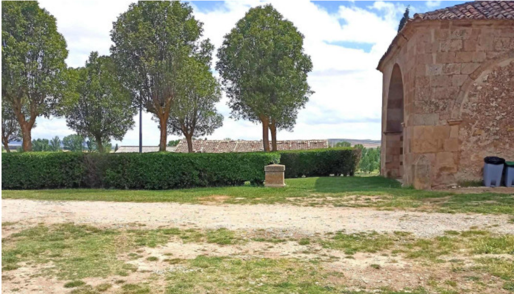
Ermita de la virgen de la llana cerca de mi