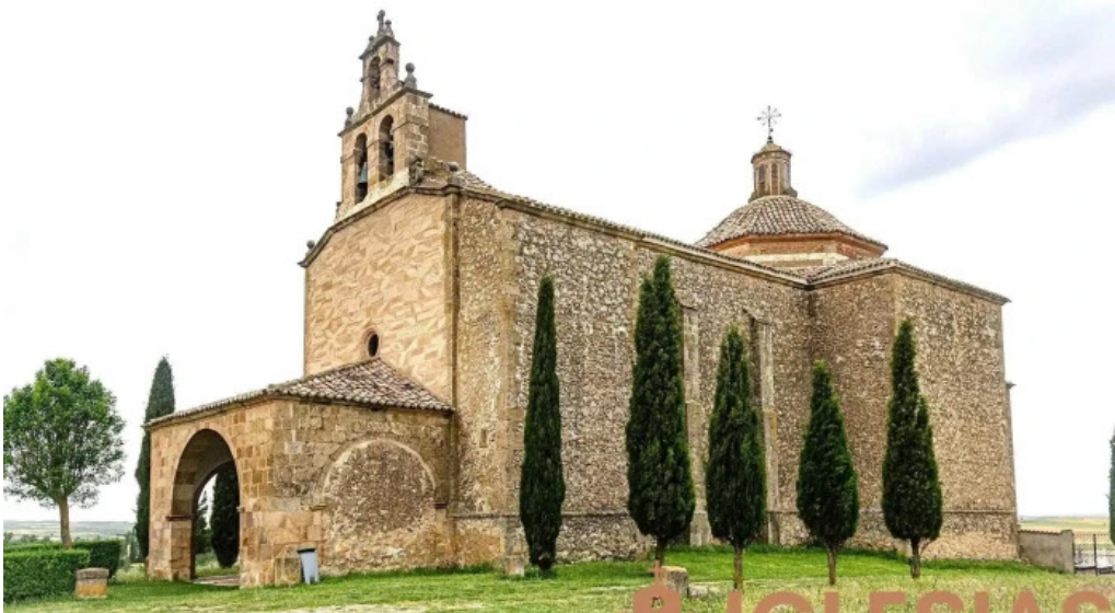
Ermita de la virgen de la llana iglesia catolica