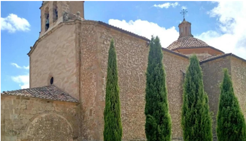
Ermita de la virgen de la llana almenar de soría