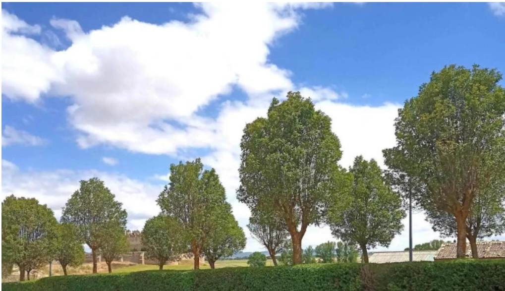
Ermita de la virgen de la llana promocion