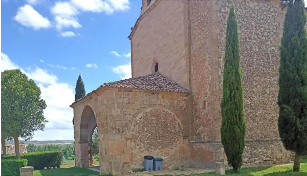
Ermita de la virgen de la llana ubicacion