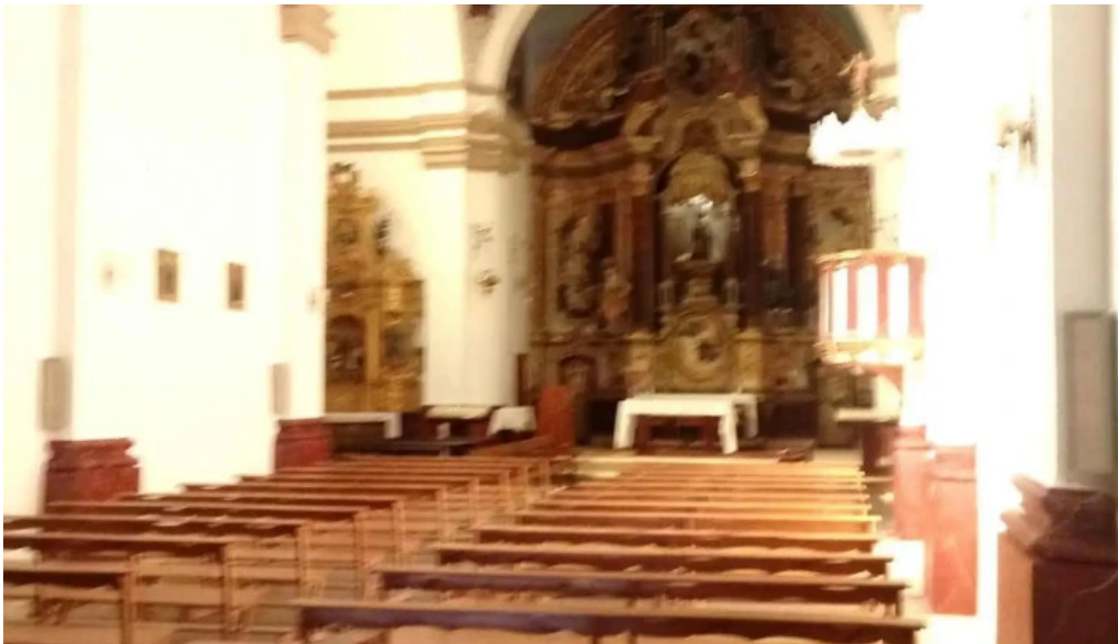
Ermita de la virgen de la llana iglesia