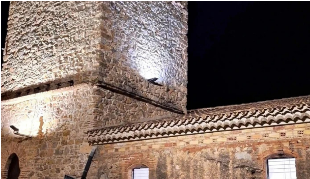
Iglesia de san agustin puntaje