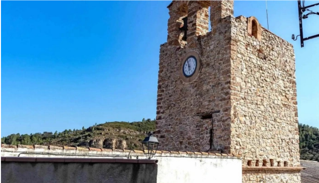
Iglesia de san agustin direccion