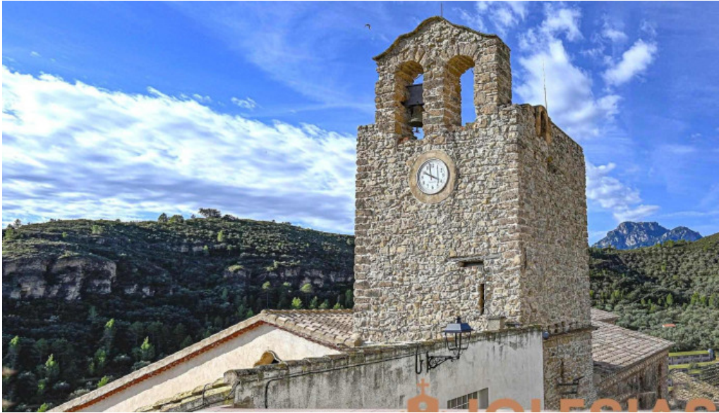
Iglesia de san agustin iglesia catolica