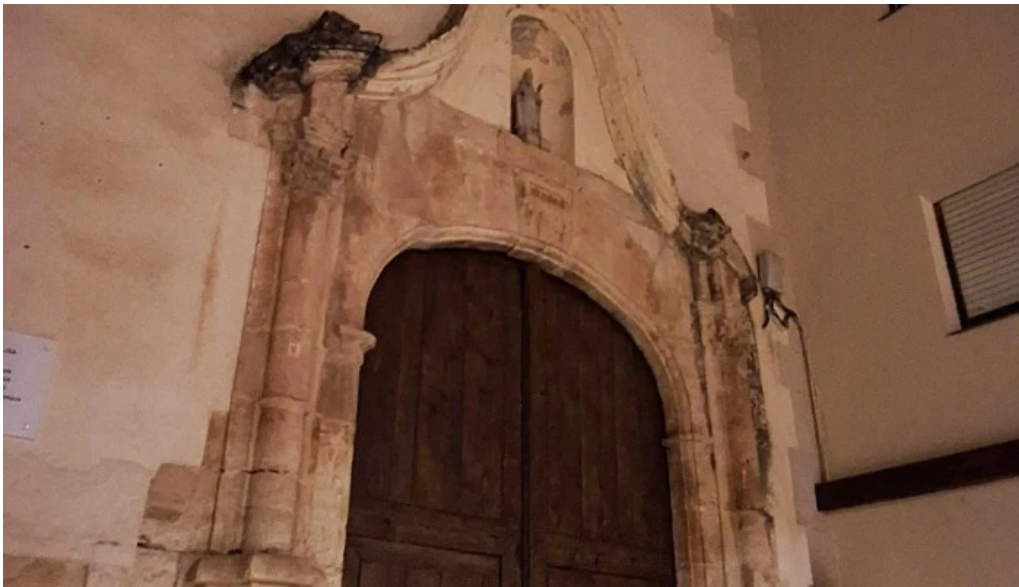
Iglesia de san agustin alfara de carles