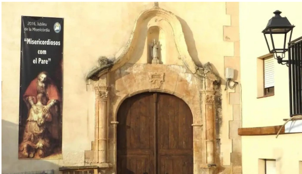
Iglesia de san agustin iglesia