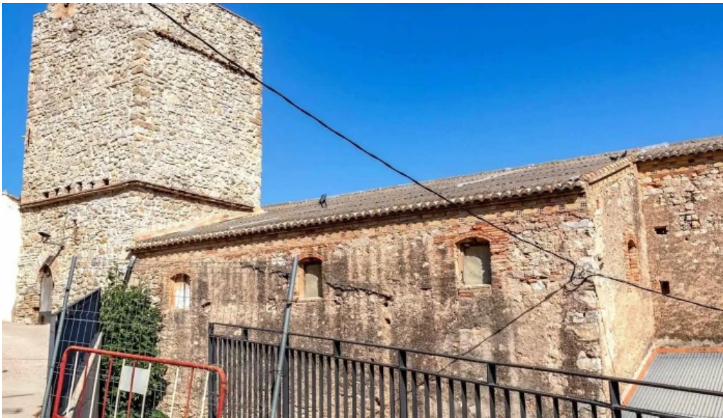
Iglesia de san agustin donde