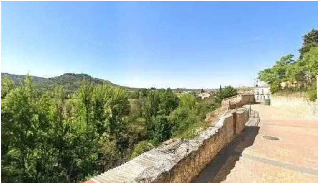
Iglesia de nuestra señora de la asuncion sitio web