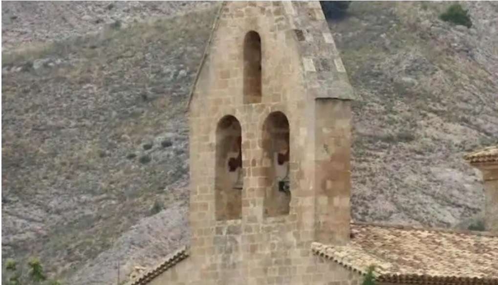
Iglesia de nuestra senora de la asuncion albalate de las nogueras