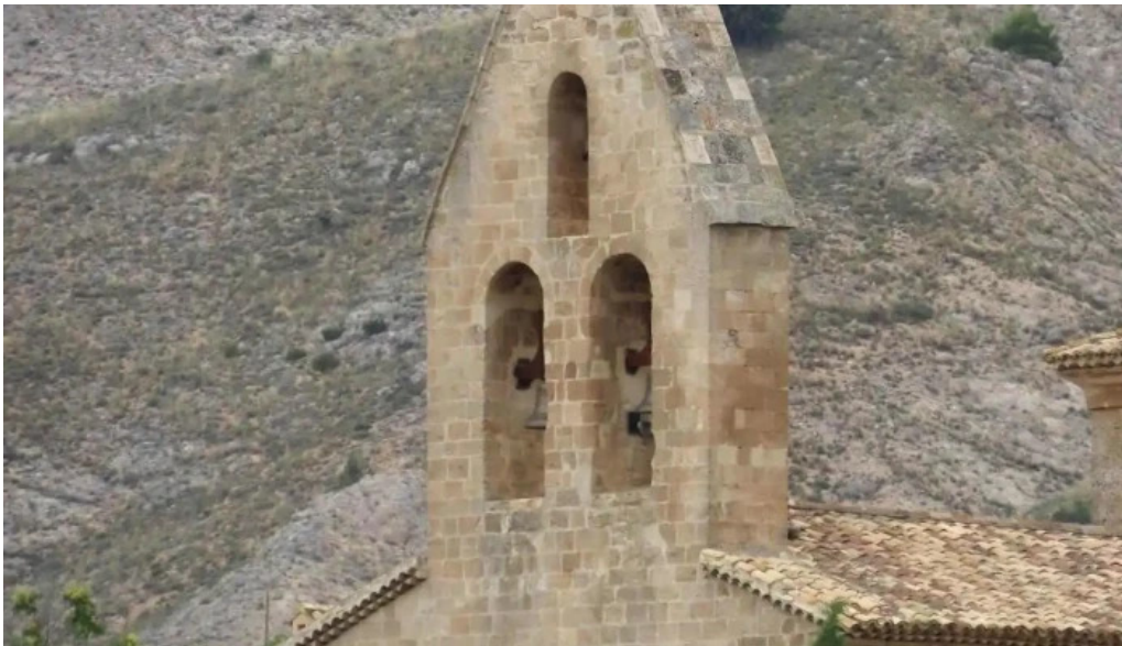
Iglesia de nuestra senora de la asuncion iglesia catolica