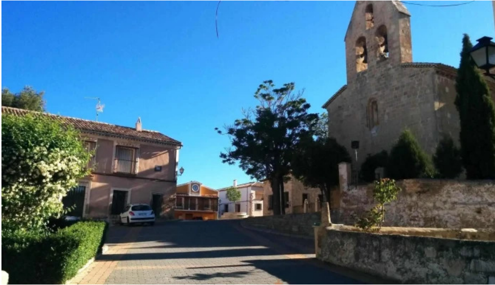
Iglesia de nuestra senora de la asuncion iglesia