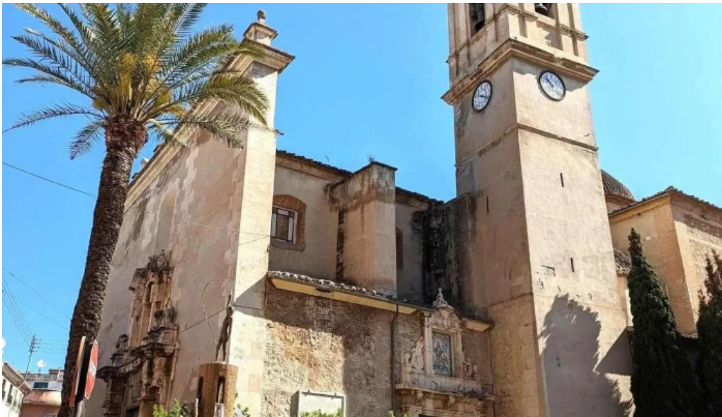
Parroquia de san pedro apostol iglesia