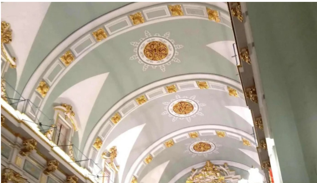
Parroquia de san pedro apostol albalat de la ribera