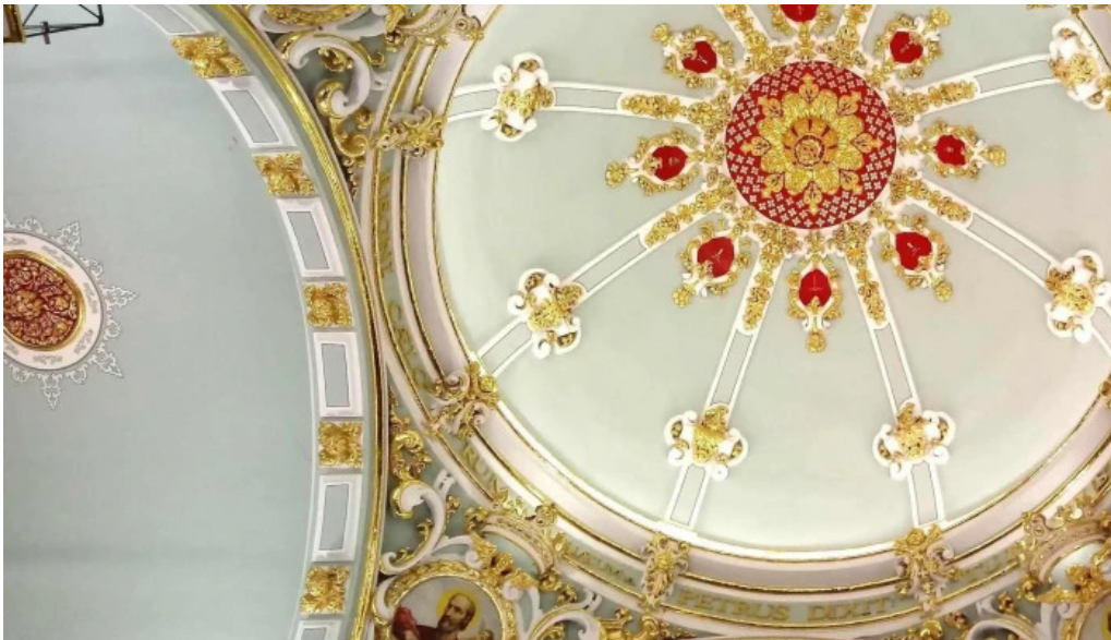
Parroquia de san pedro apostol comentarios