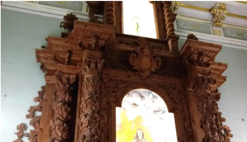
Parroquia de san pedro apostol fotos