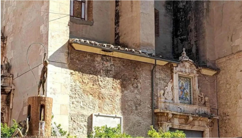
Parroquia de san pedro apostol iglesia catolica