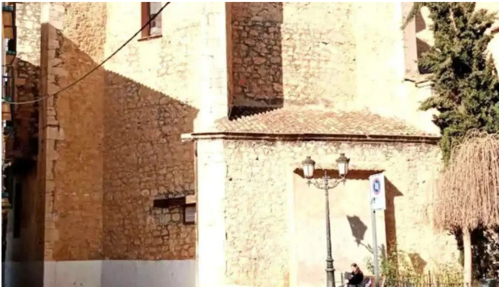
Parroquia de san pedro apostol videos