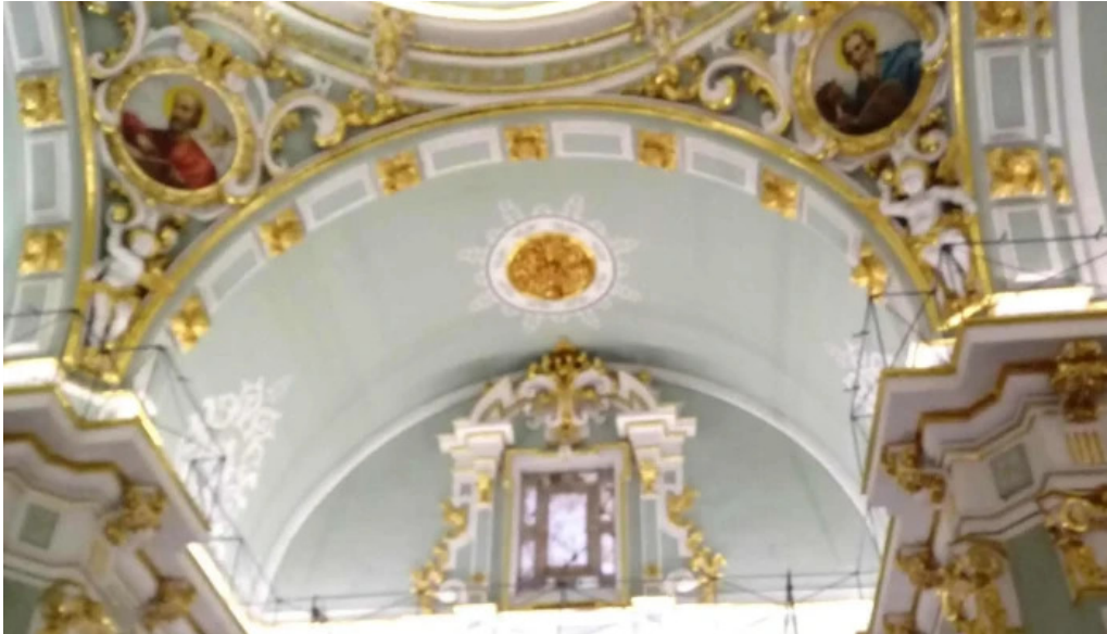
Parroquia de san pedro apostol abierto ahora