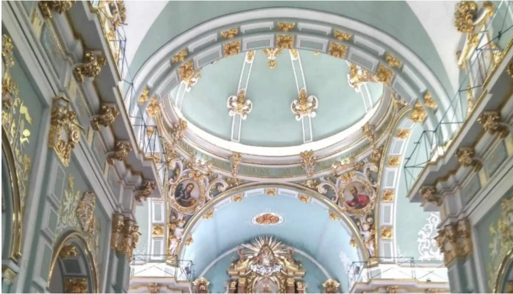
Parroquia de san pedro apostol zona