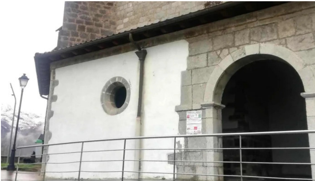
Done joan bataiatzailearen elizaiglesia de san juan bautista comentarios