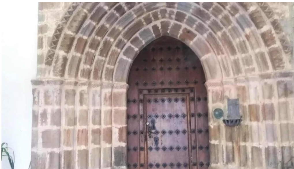
Done joan bataiatzailearen elizaiglesia de san juan bautista abaltzisketa