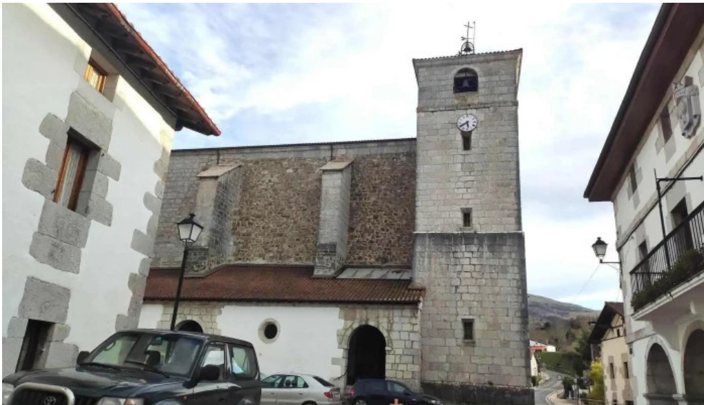
Done joan bataiatzailearen elizaiglesia de san juan bautista iglesia