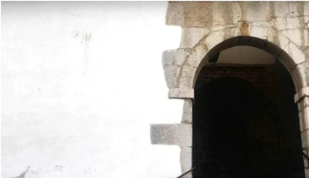
Done joan bataiatzailearen elizaiglesia de san juan bautista numero