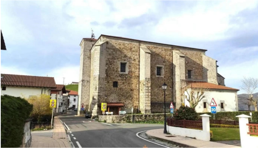
Done joan bataiatzailearen elizaiglesia de san juan bautista iglesia catolica