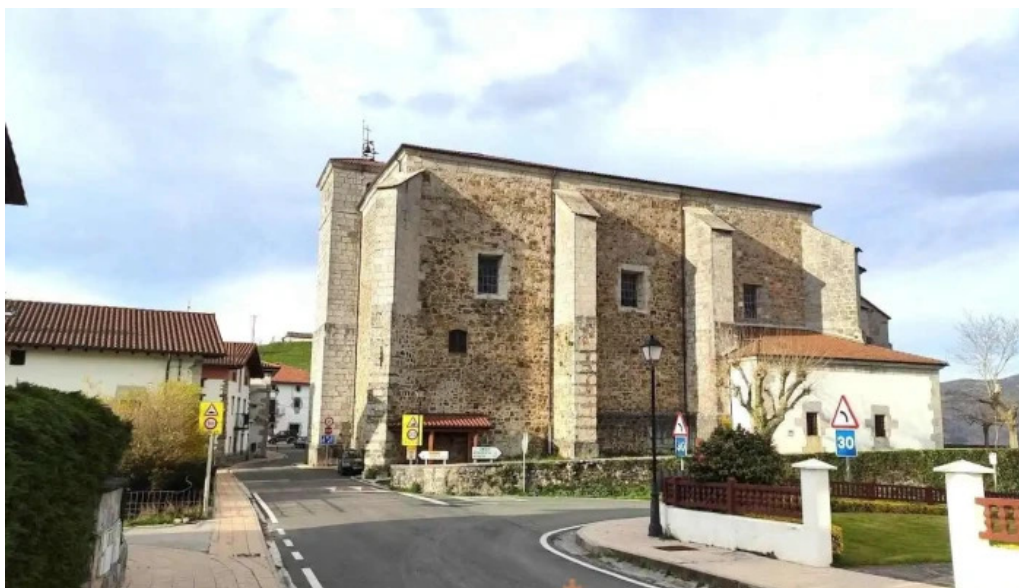
Done joan bataiatzailearen eliza iglesia de san juan bautista abaltzisketa