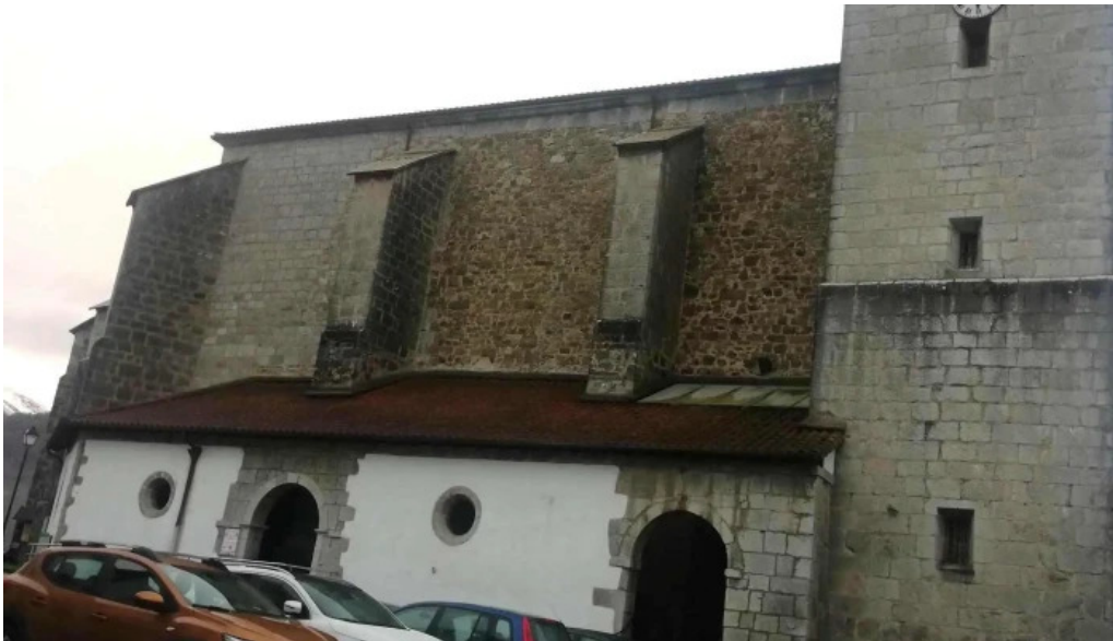
Done joan bataiatzailearen elizaiglesia de san juan bautista instagram