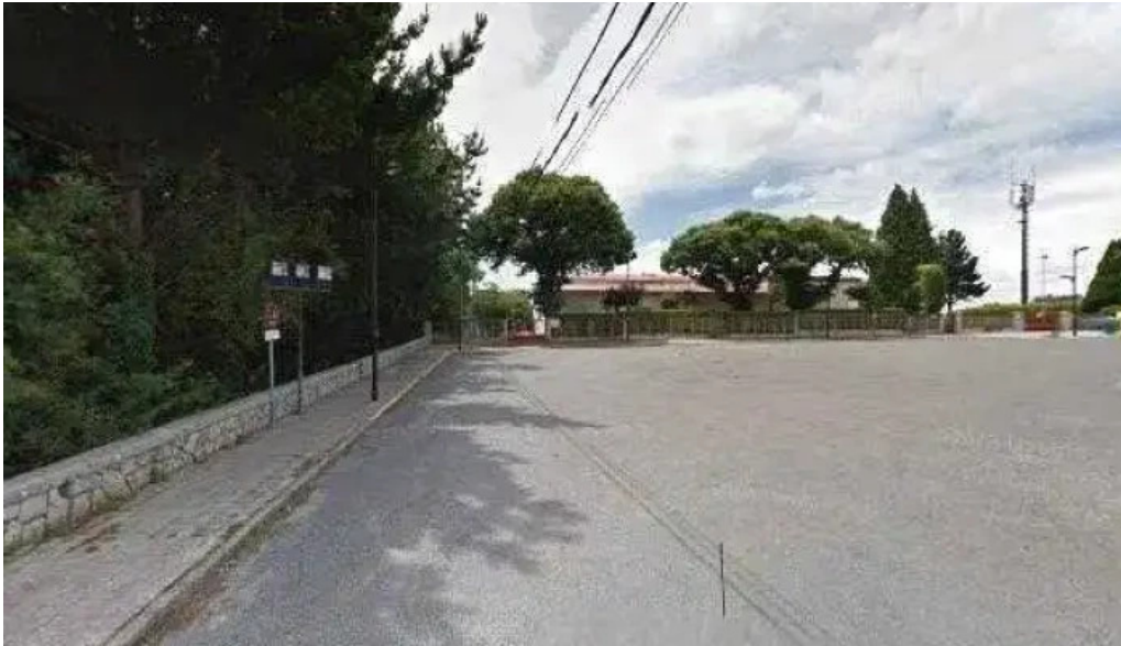
Iglesia de la virgen del monte de cospeito donde