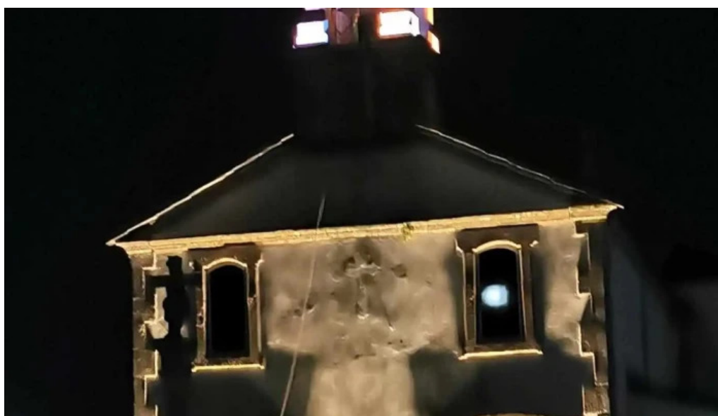
Iglesia de la virgen del monte de cospeito iglesia