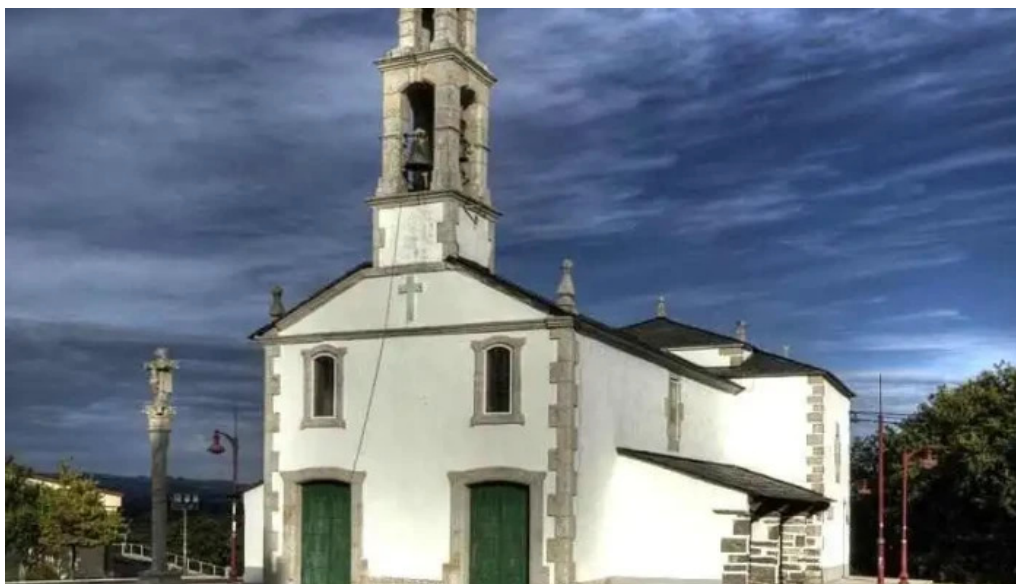
Iglesia de la virgen del monte de cospeito a feira do monte