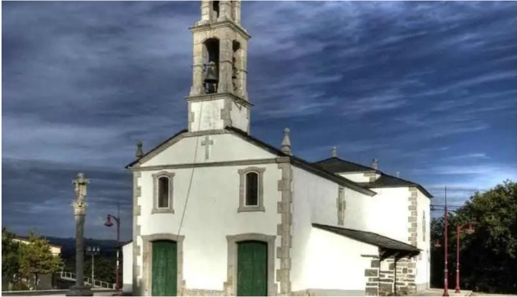
Iglesia de la virgen del monte de cospeito iglesia catolica