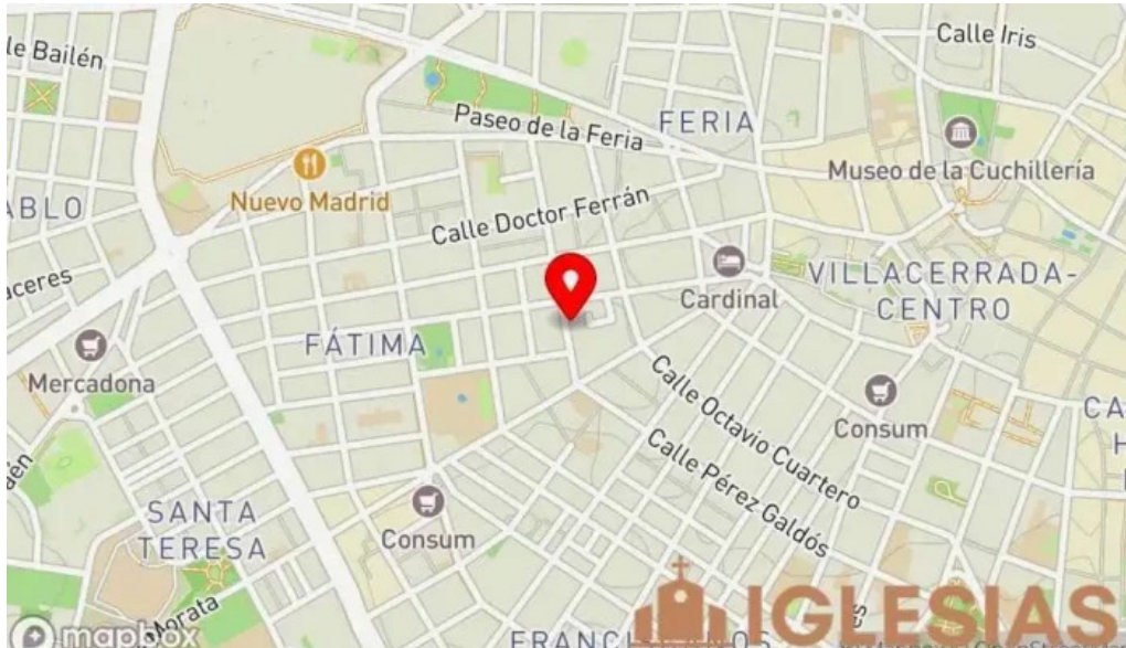
Iglesia evangelica bautista de albacete mapa