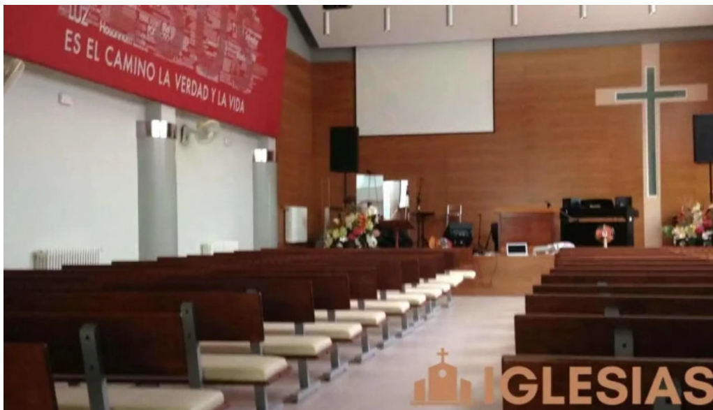
Iglesia evangelica bautista de albacete iglesia