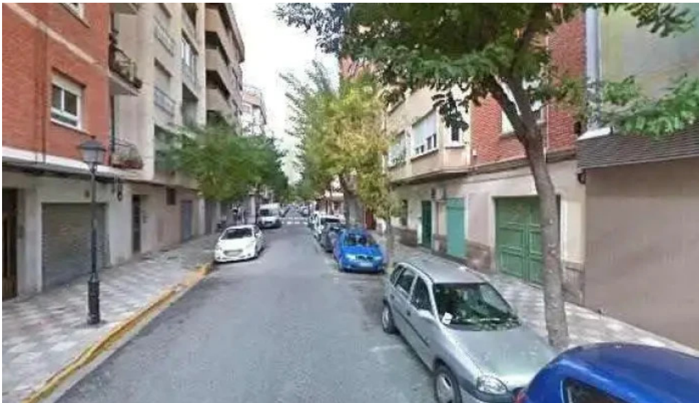
Iglesia evangelica bautista de albacete albacete