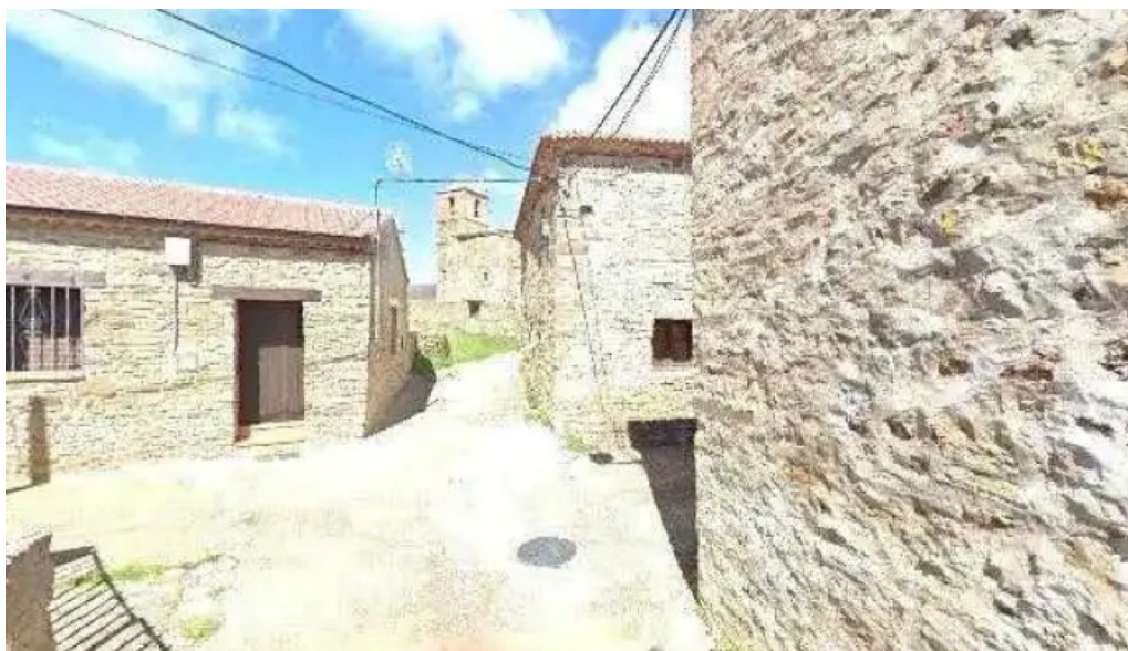
Iglesia de san martin donde