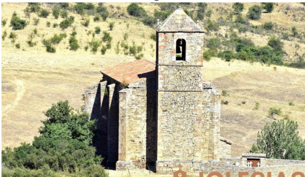
Iglesia de san martin vizmanos