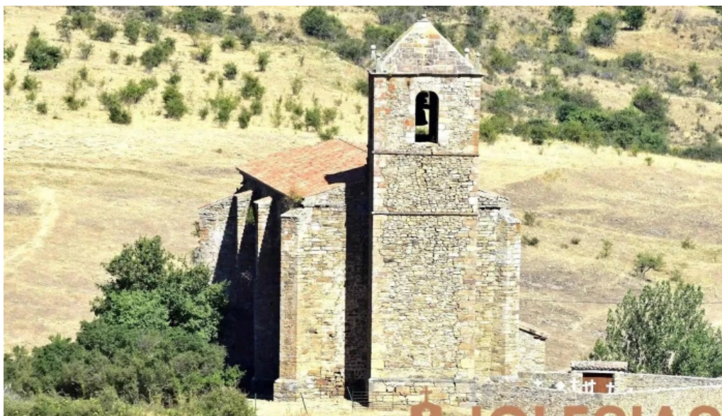
Iglesia de san martin iglesia apostolica