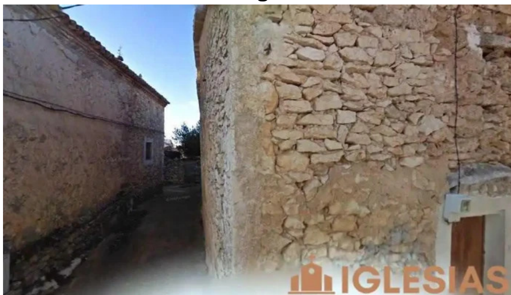
Iglesia de nuestra senora de los remedios peralveche