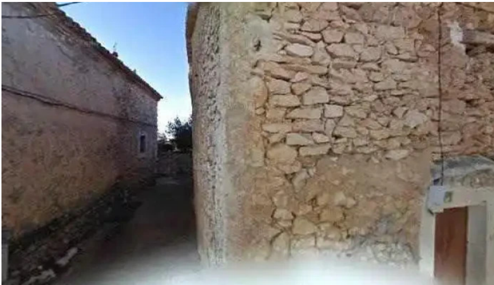
Iglesia de nuestra senora de los remedios iglesia apostolica