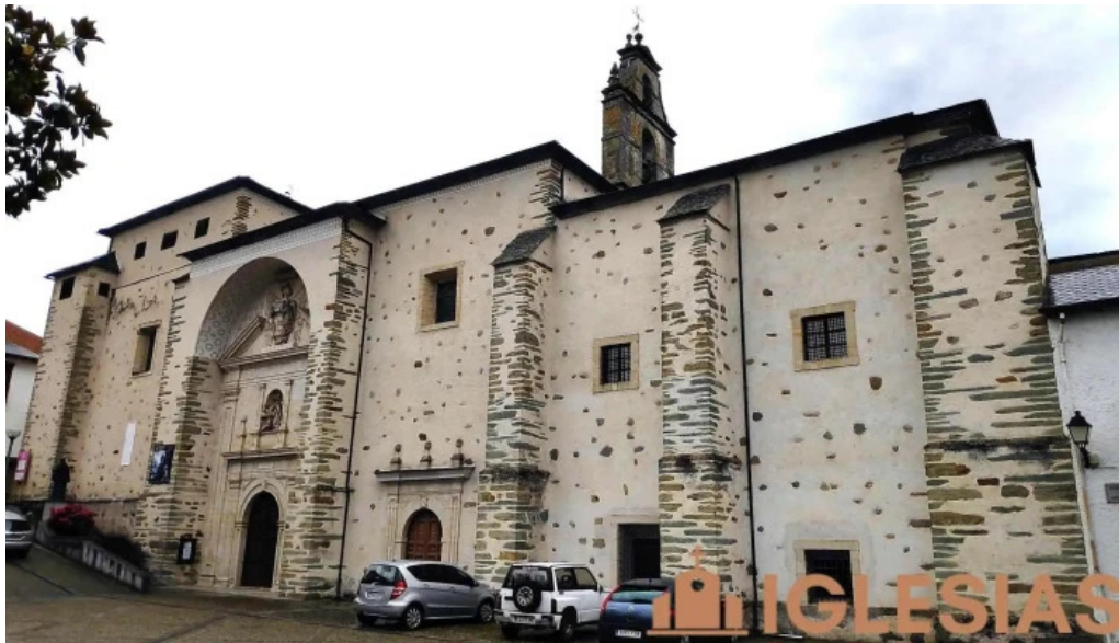
Convento de la anunciada convento