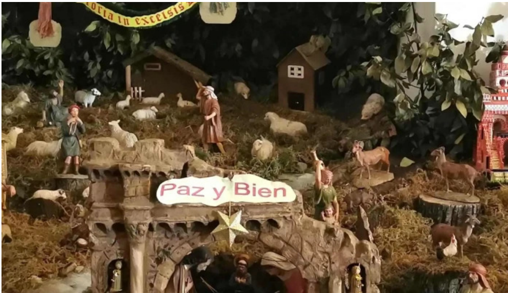
Convento de la anunciada fotos