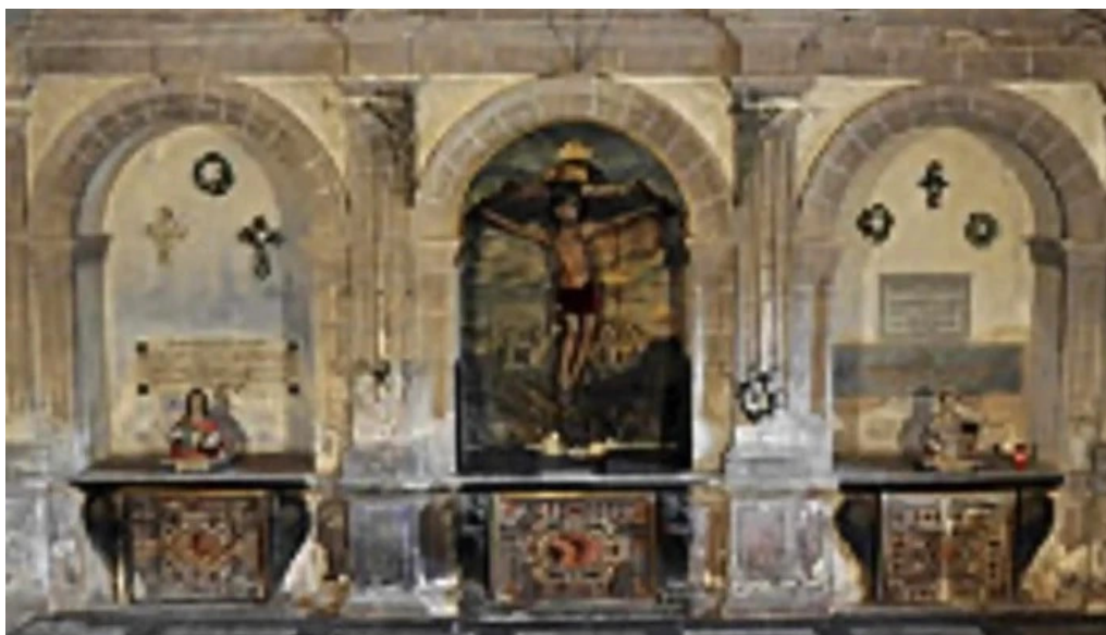
Convento de la anunciada abierto ahora