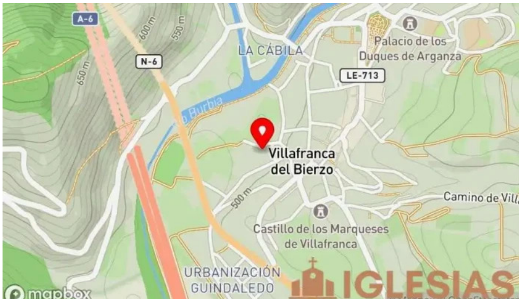
Convento de la anunciada mapa