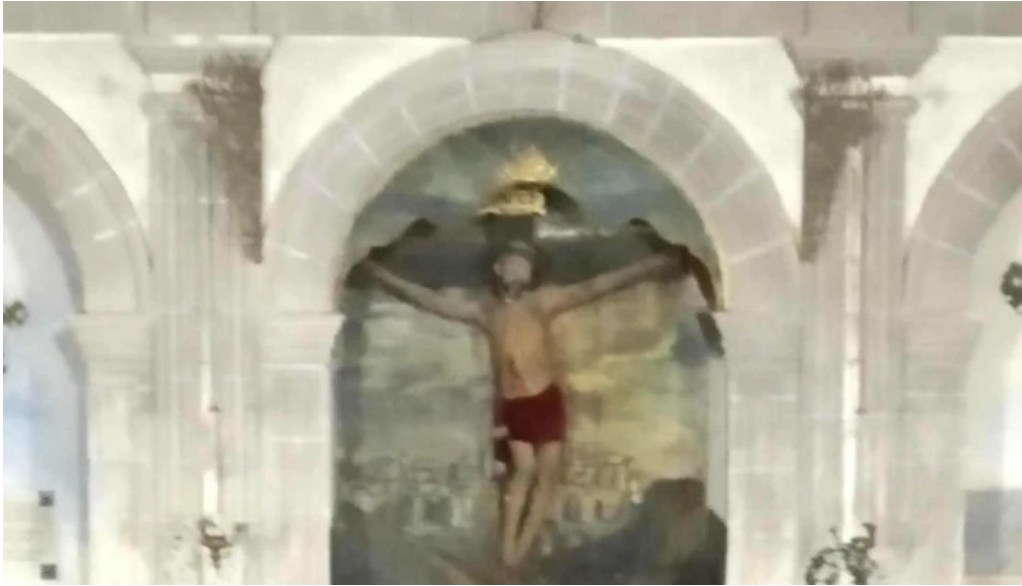
Convento de la anunciada direccion