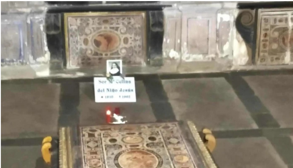
Convento de la anunciada cerca de mi