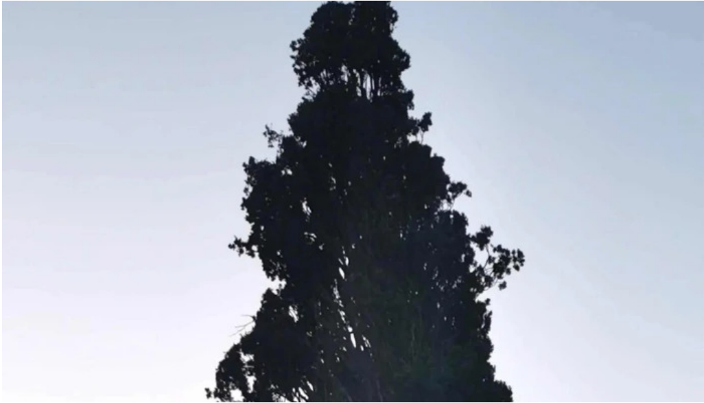
Convento de la anunciada horario