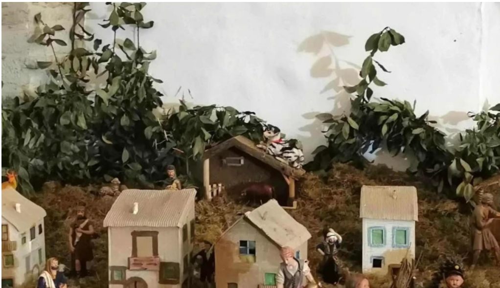
Convento de la anunciada descuentos