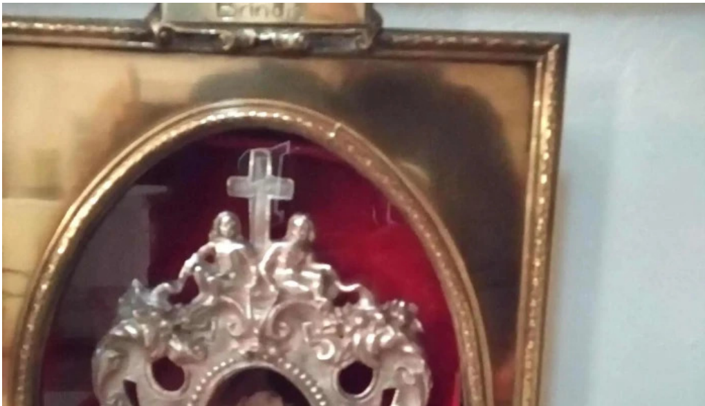
Convento de la anunciada ubicacion