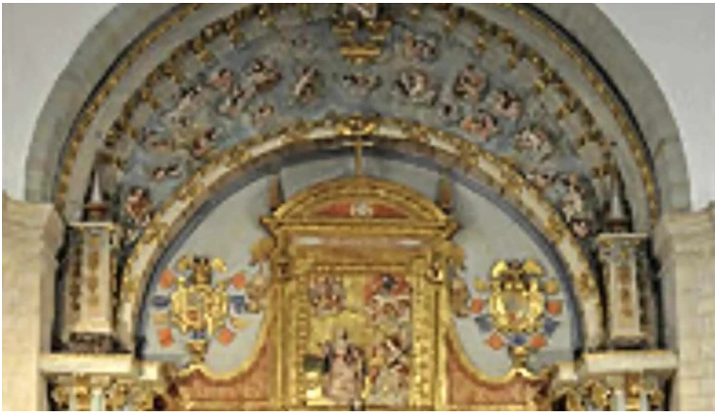
Convento de la anunciada comentarios