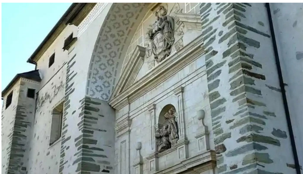
Convento de la anunciada videos