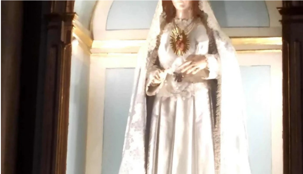
Convento de la anunciada numero