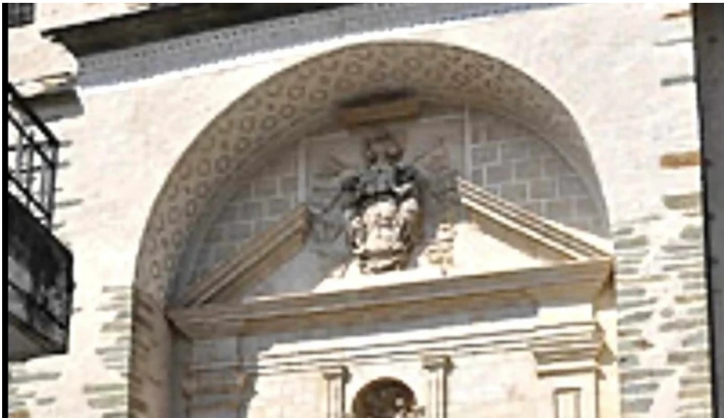
Convento de la anunciada como llegar