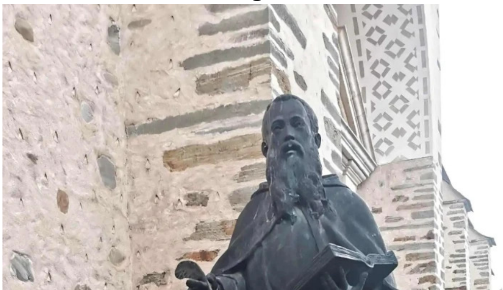
Convento de la anunciada villafranca del bierzo