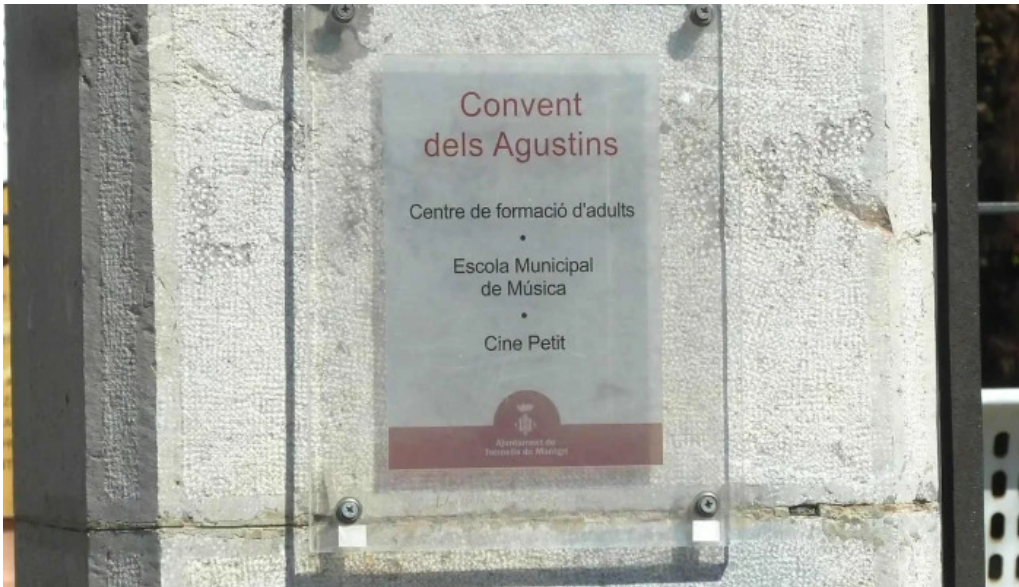
Convento de los agustinos comentario 3