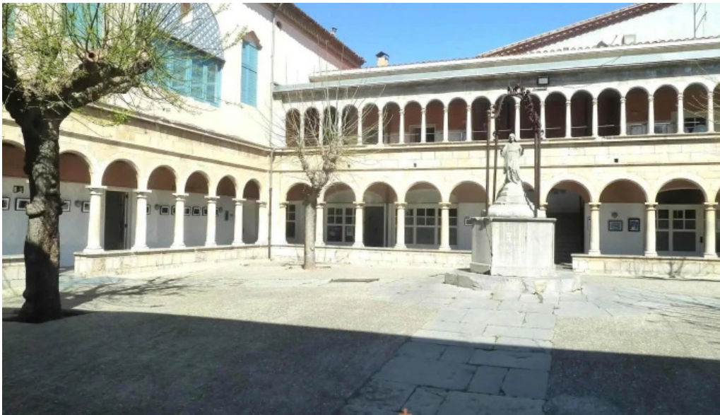
Convento de los agustinos convento