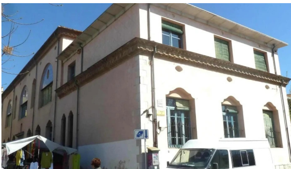
Convento de los agustinos comentario 1