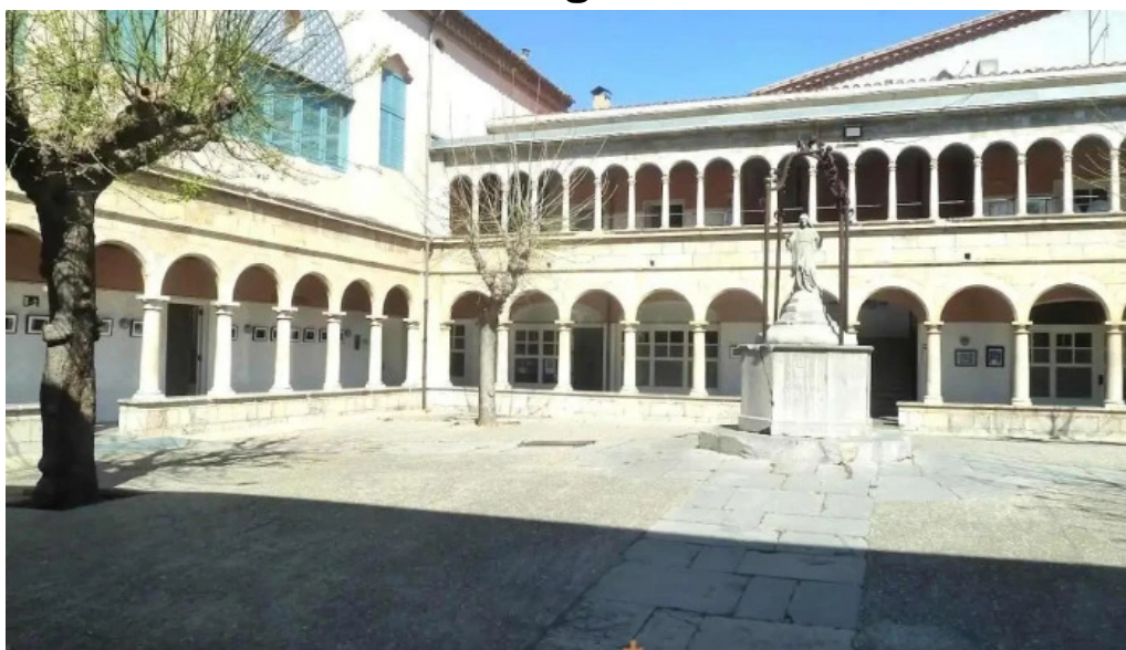
Convento de los agustinos torroella de montgri