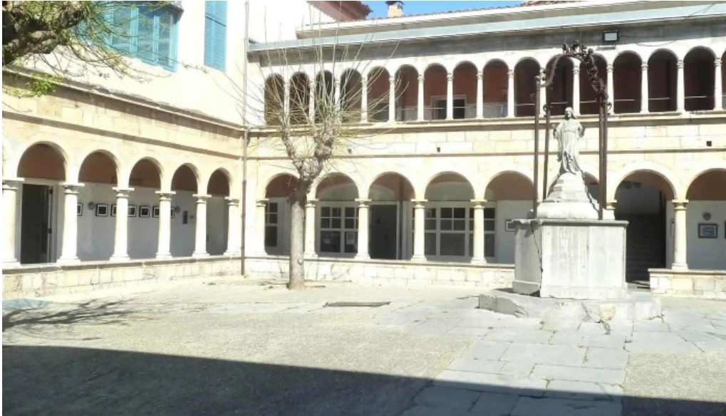
Convento de los agustinos comentario 4