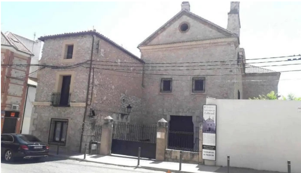
Convento de los padres franciscanos tarancon