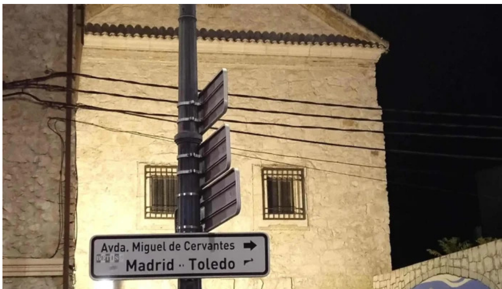
Convento de los padres franciscanos comentario 1