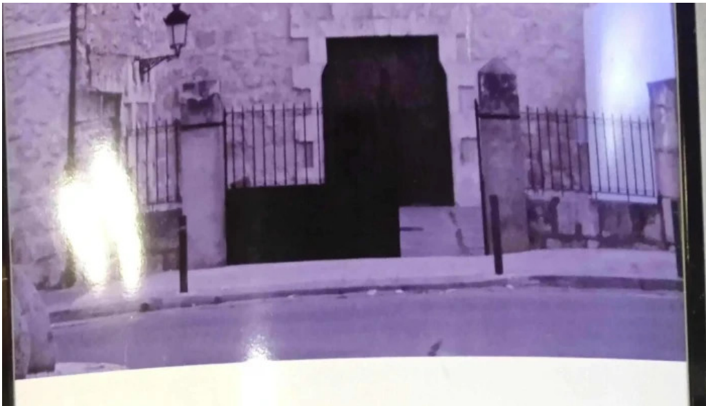
Convento de los padres franciscanos comentario 3