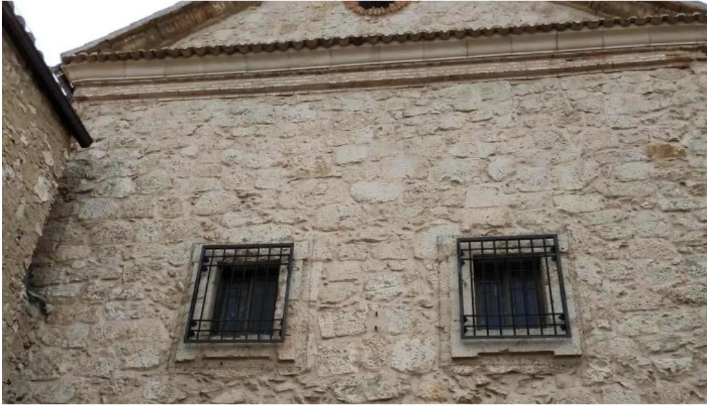
Convento de los padres franciscanos comentario 4