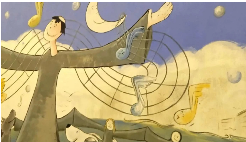
Convento de los padres franciscanos comentario 2