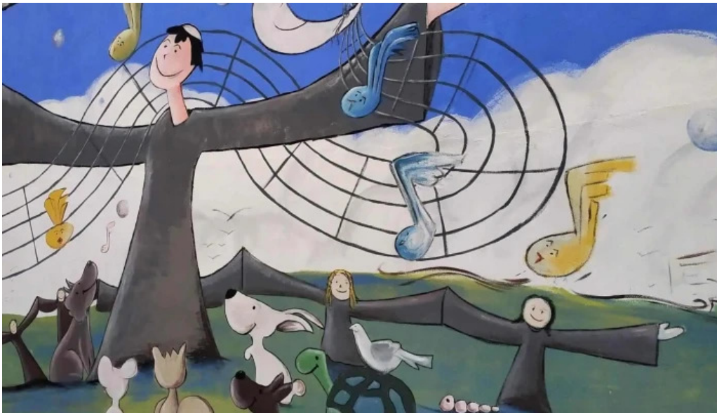
Convento de los padres franciscanos comentario 5