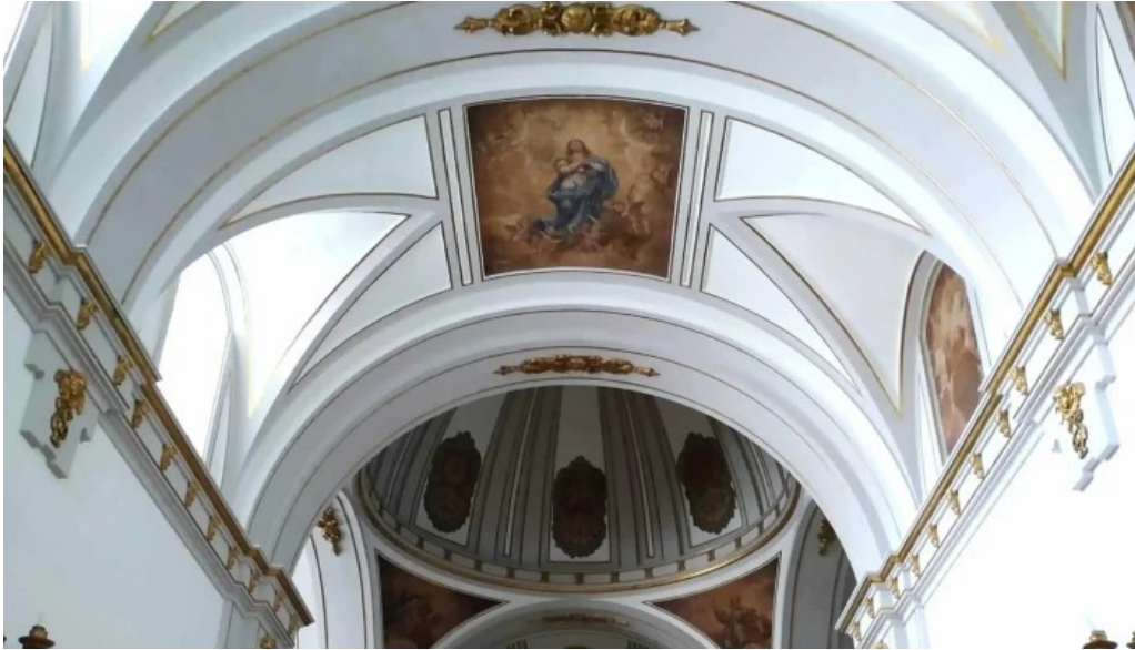
Convento de los padres franciscanos comentario 6