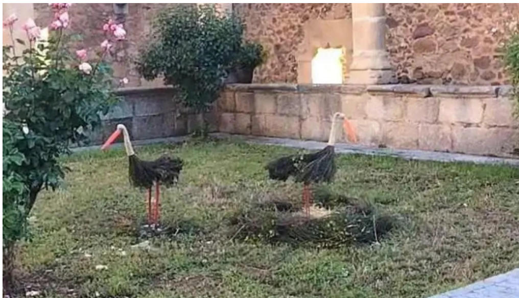
Convento de las dominicas videos