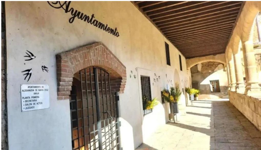
Convento de las dominicas aldeanueva de santa cruz