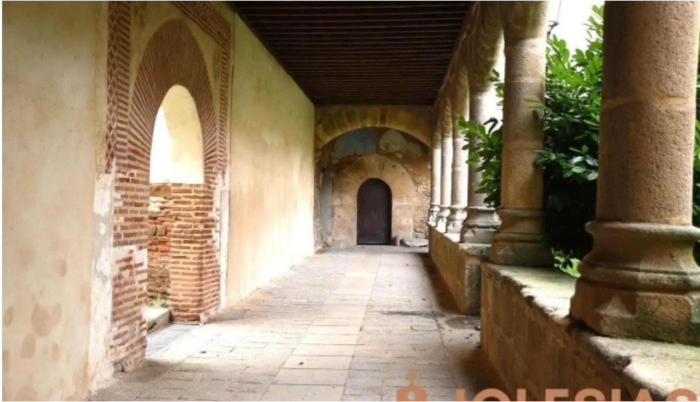
Convento de las dominicas muro de piedra