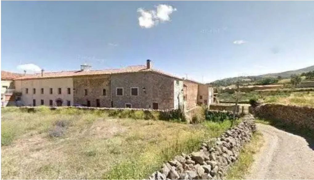
Convento de las dominicas dominicas