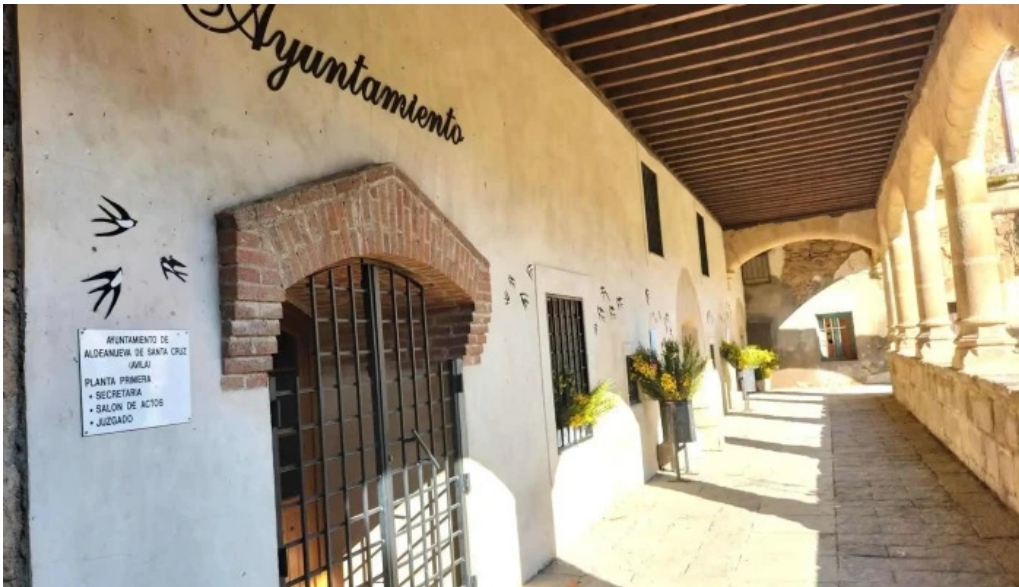
Convento de las dominicas convento