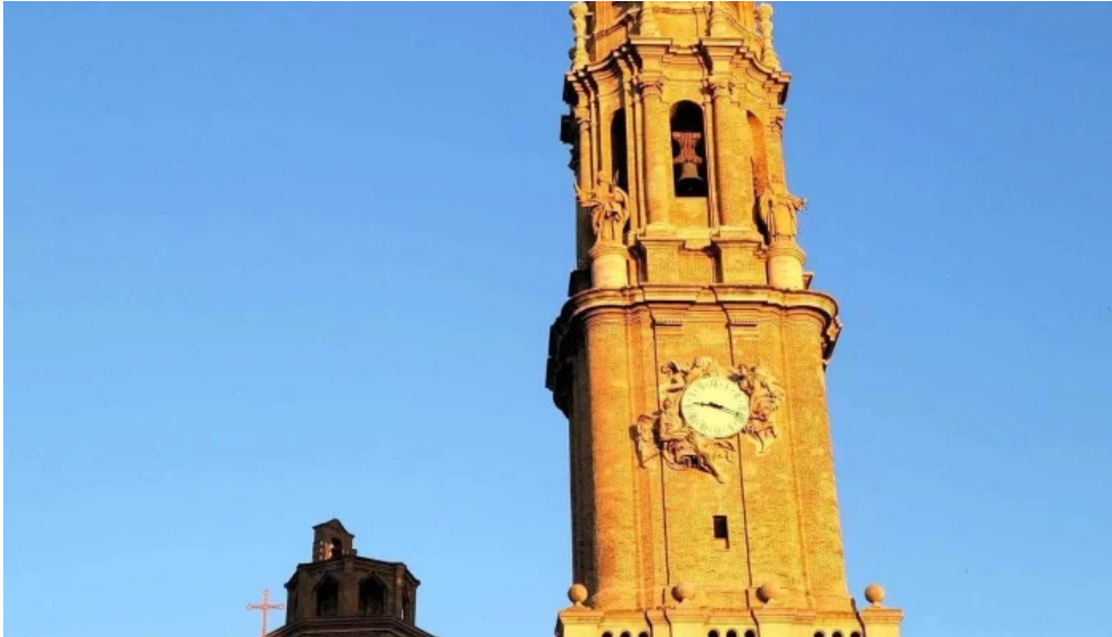
Catedral del salvador la seo catedral