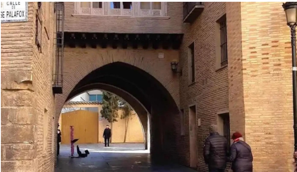
Catedral del salvador la seo arco del dean