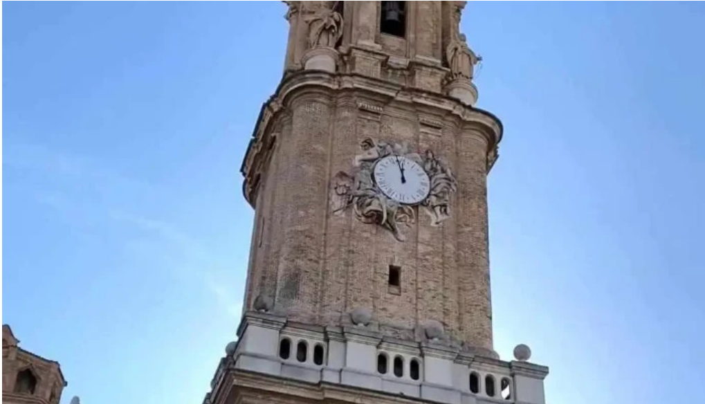
Catedral del salvador la seo museo de tapices