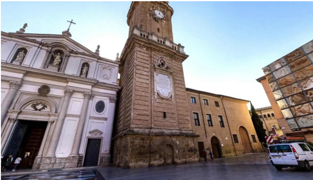
Catedral del salvador la seo numero