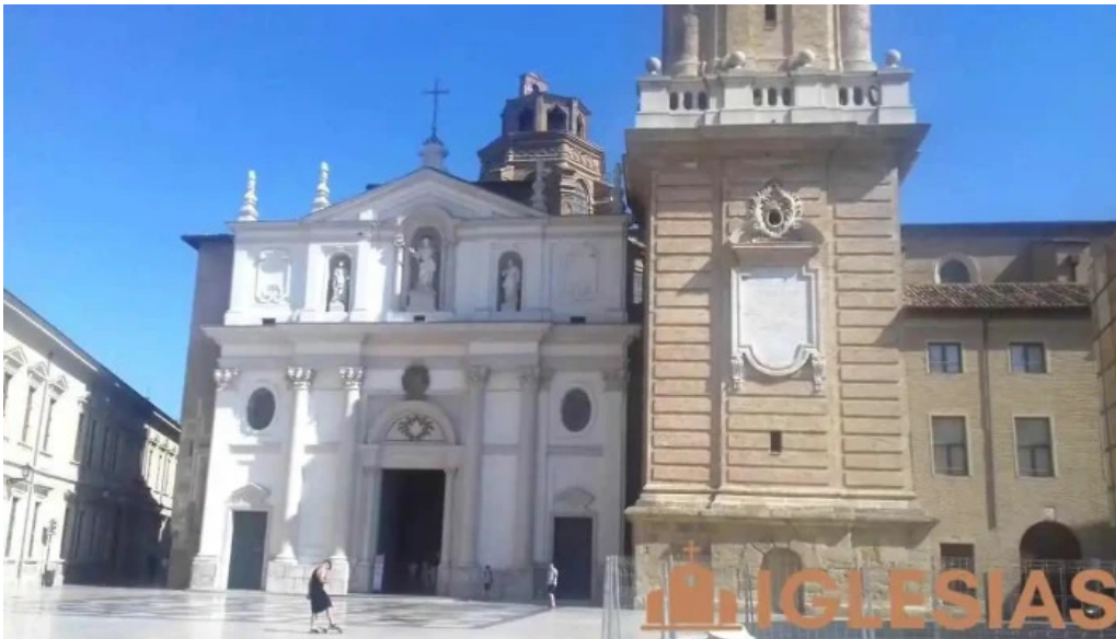
Catedral del salvador la seo videos