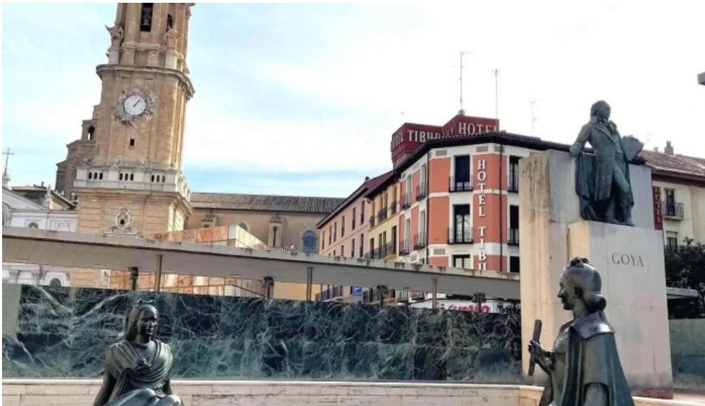
Catedral del salvador la seo recientes