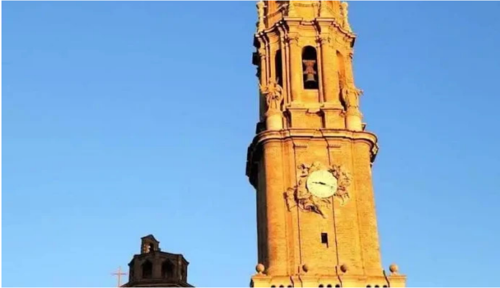
Catedral del salvador la seo zaragoza