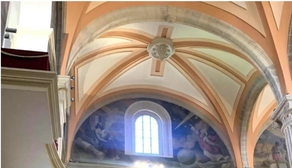
Catedral de san juan bautista de albacete comentario 8