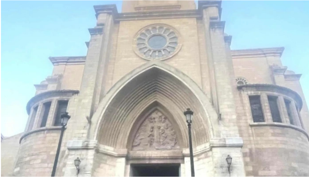
Catedral de san juan bautista de albacete comentario 1