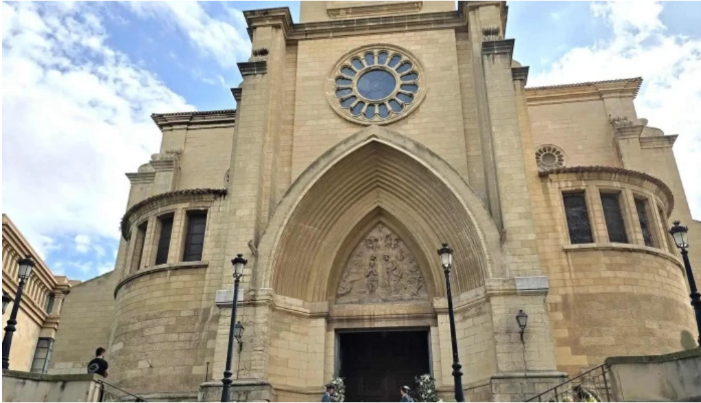
Catedral de san juan bautista de albacete comentario 9