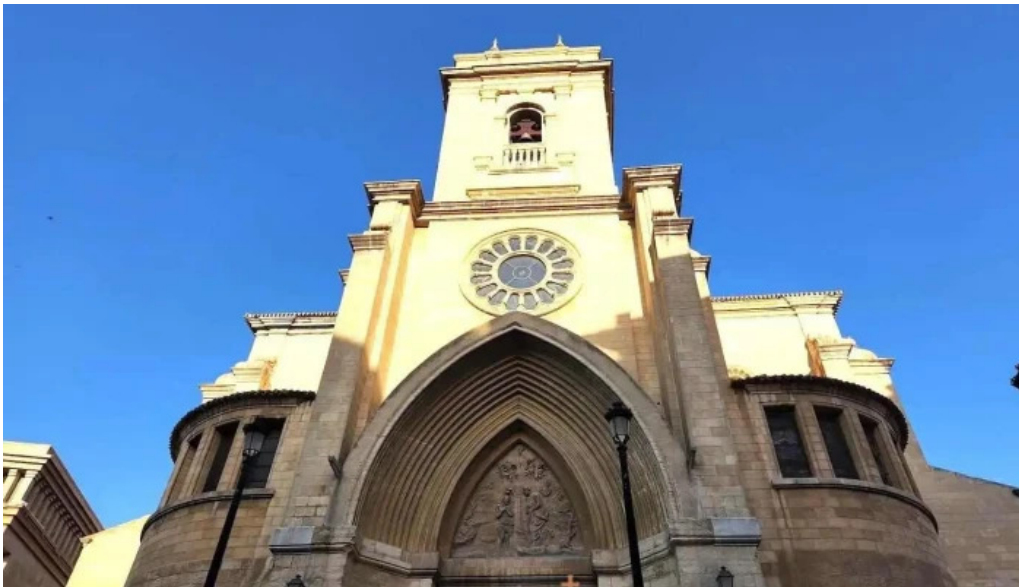
Catedral de san juan bautista de albacete albacete