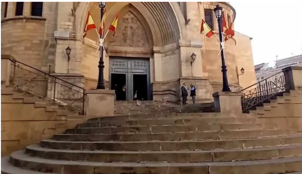
Catedral de san juan bautista de albacete videos