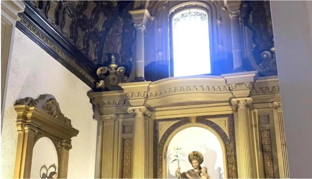
Catedral de san juan bautista de albacete comentario 7