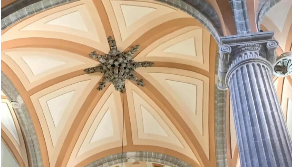
Catedral de san juan bautista de albacete comentario 5