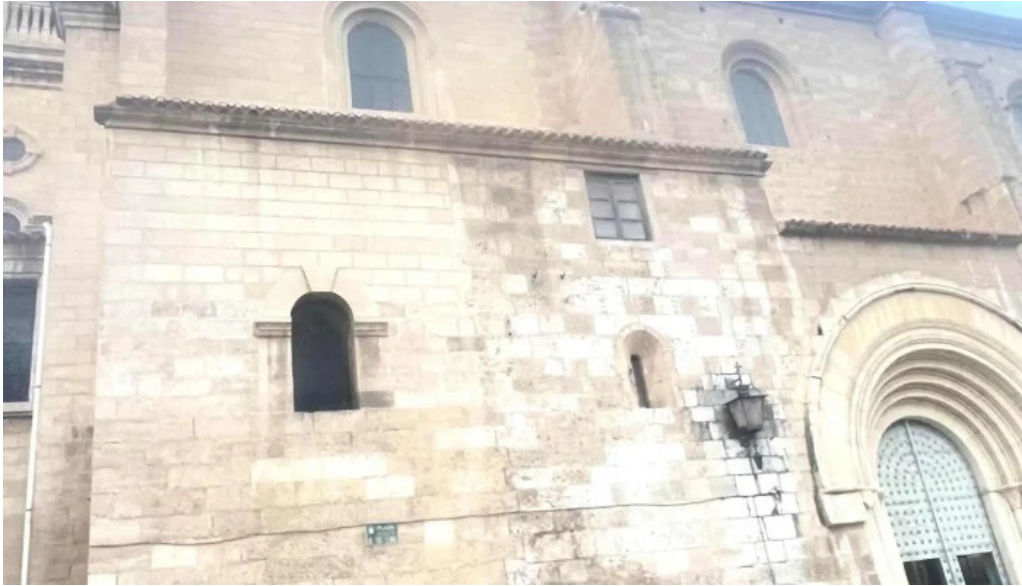
Catedral de san juan bautista de albacete comentario 3