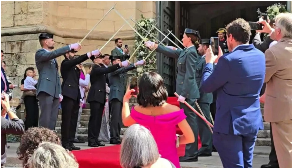
Catedral de san juan bautista de albacete comentario 10