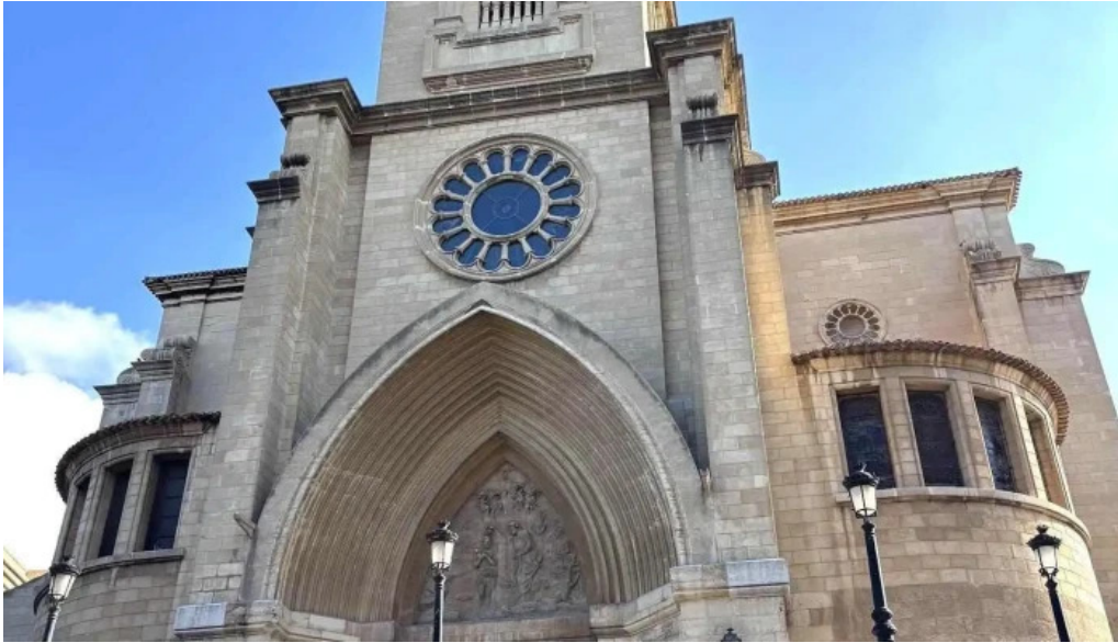
Catedral de san juan bautista de albacete recientes