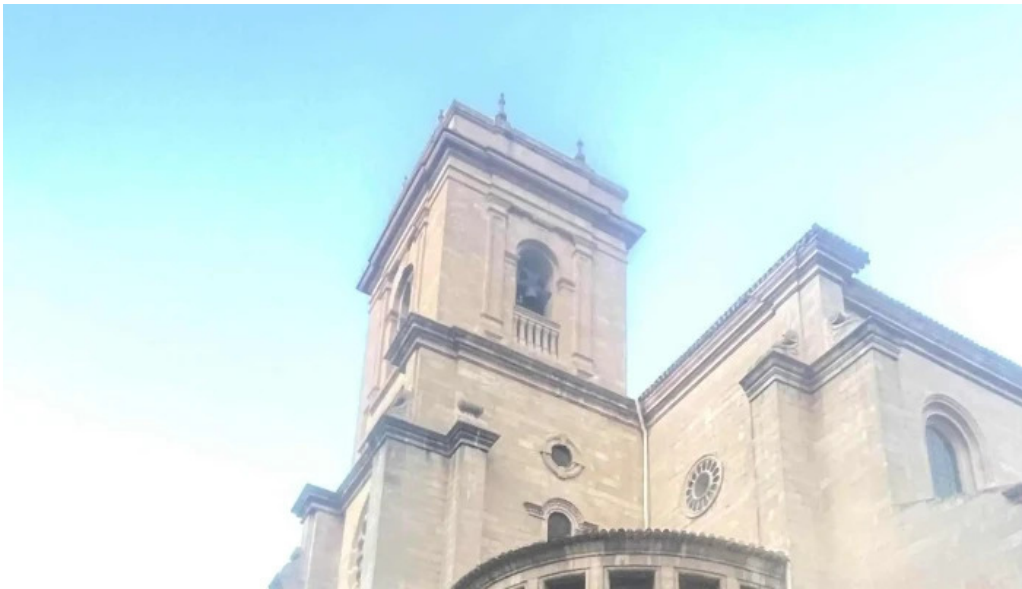
Catedral de san juan bautista de albacete comentario 2