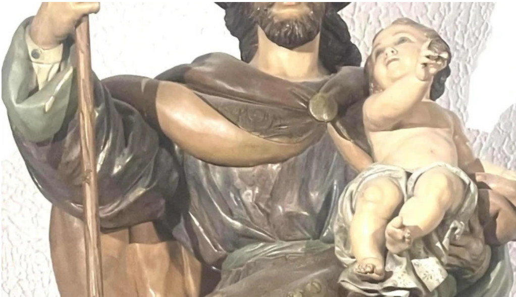
Catedral de san juan bautista de albacete comentario 4