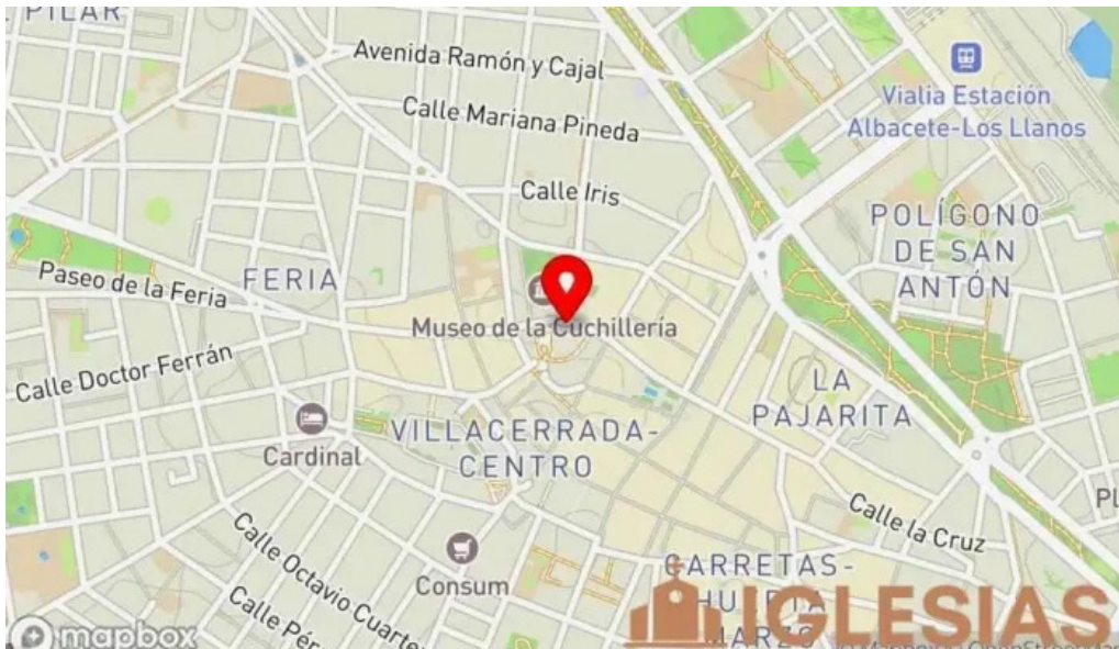
Catedral de san juan bautista de albacete mapa