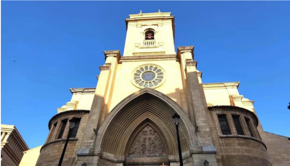
Catedral de san juan bautista de albacete catedral