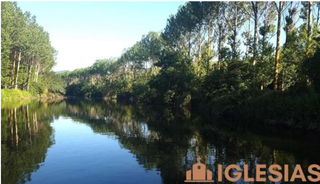
Ermita de san pelayo videos