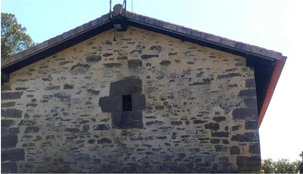
Ermita de san pelayo opiniones