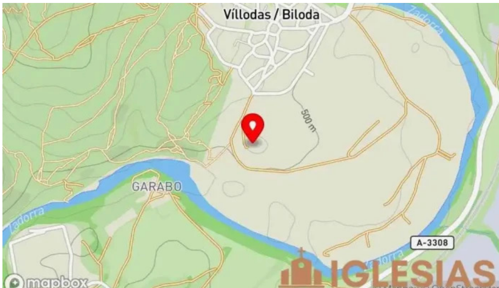
Ermita de san pelayo mapa