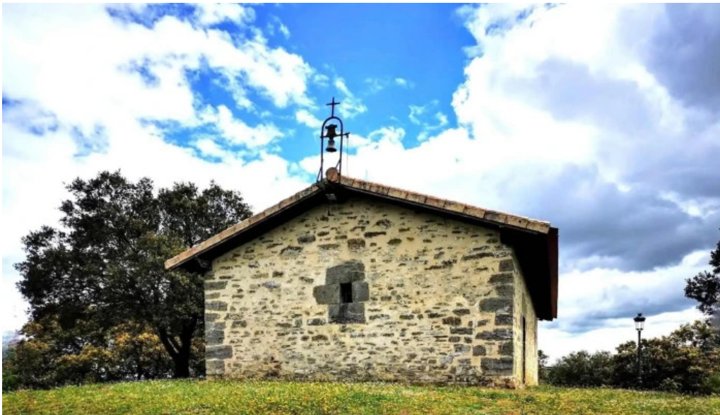
Ermita de san pelayo capilla