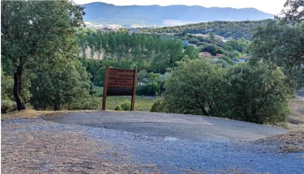
Ermita de san pelayo villodas