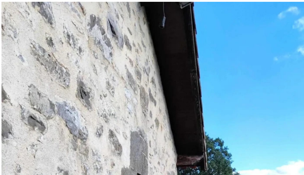
Ermita de san pelayo precios