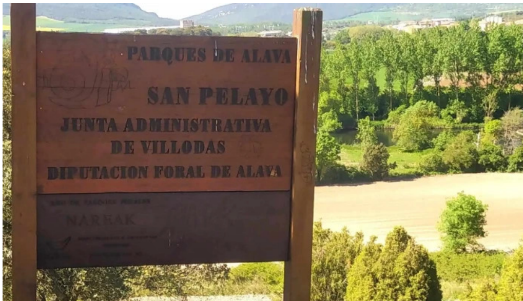
Ermita de san pelayo sitio web