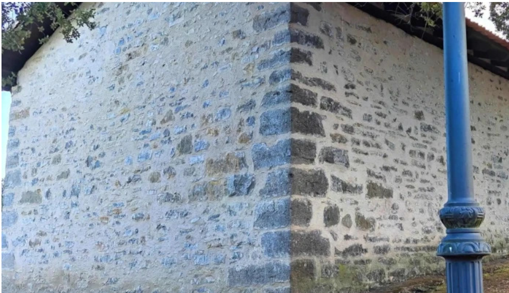
Ermita de san pelayo numero