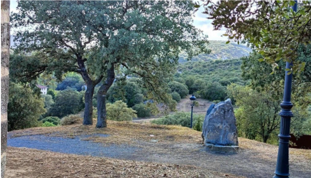
Ermita de san pelayo como llegar