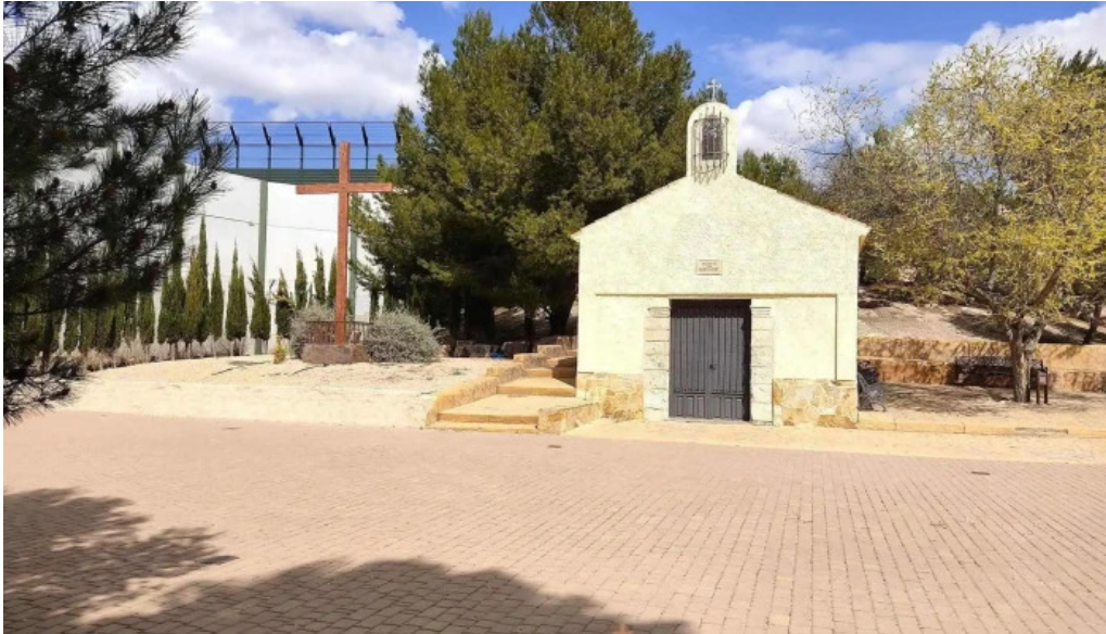
Ermita de san bartolome villena capilla