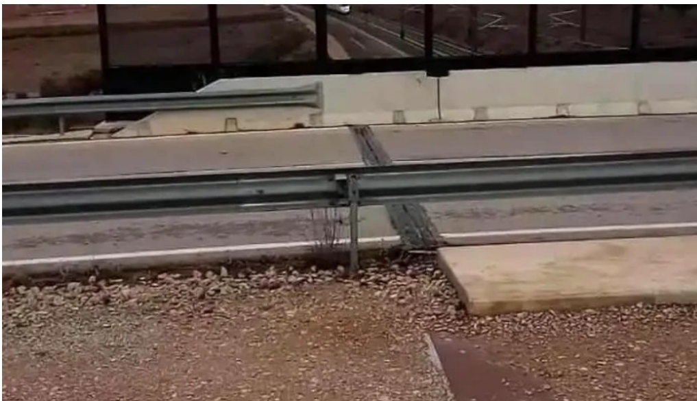
Ermita de san bartolome villena videos