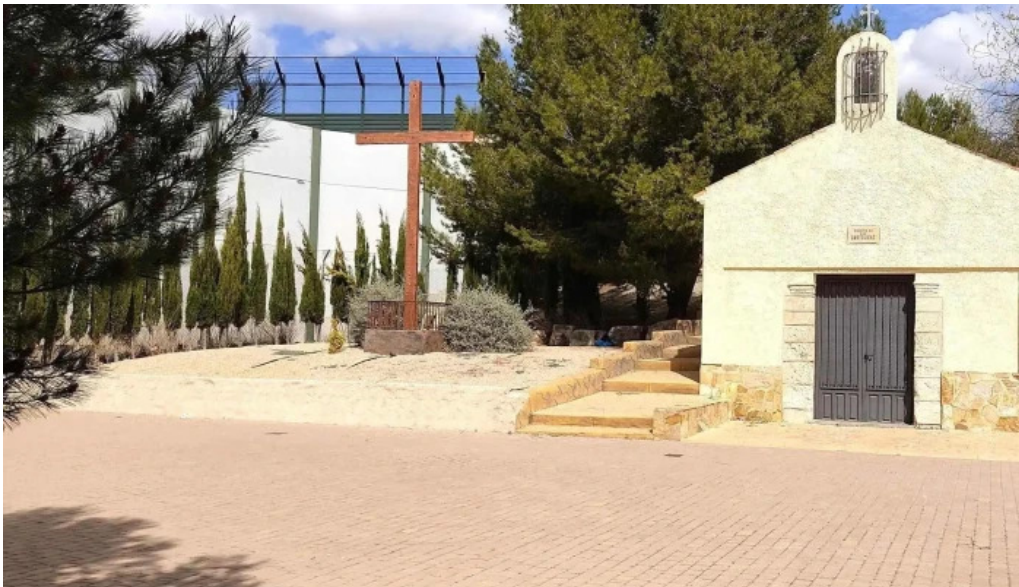
Ermita de san bartolome villena comentario 1