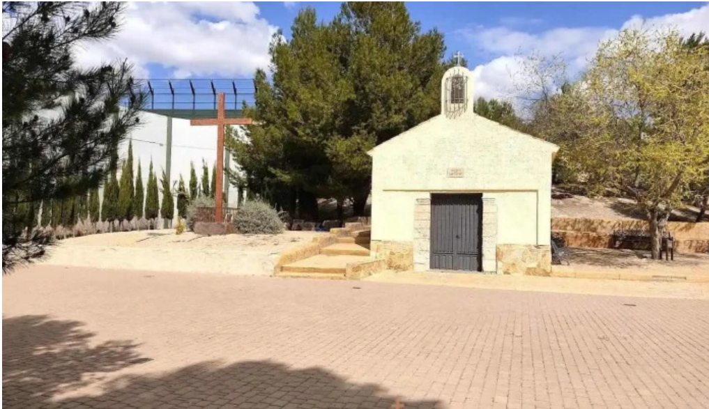
Ermita de san bartolome villena villena