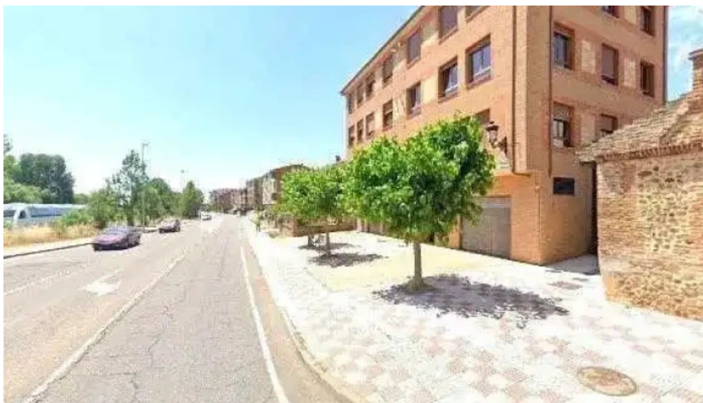
Ermita de santa maria magdalena capilla