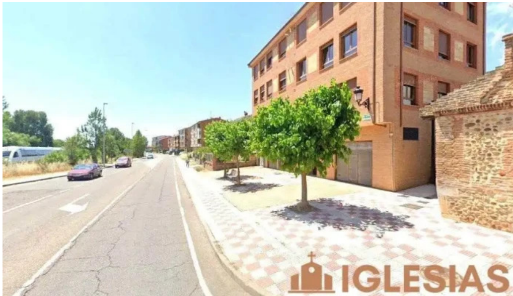
Ermite de santa maria magdalena villaquilambre