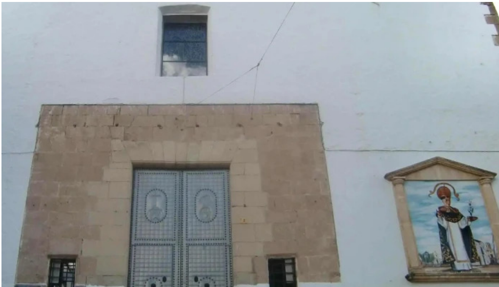
Ermita de sant vicent ferrer zona