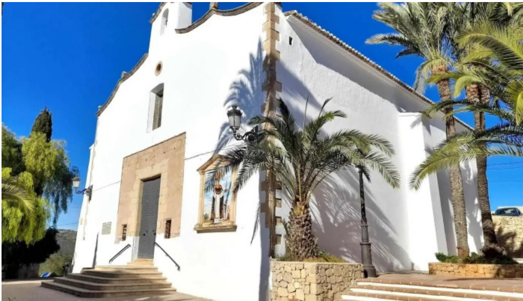
Ermita de sant vicent ferrer capilla