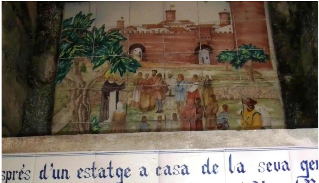
Ermita de sant vicent ferrer catalogo