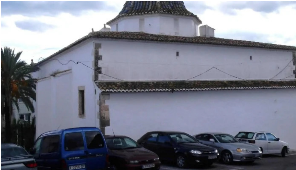
Ermita de sant vicent ferrer teulada