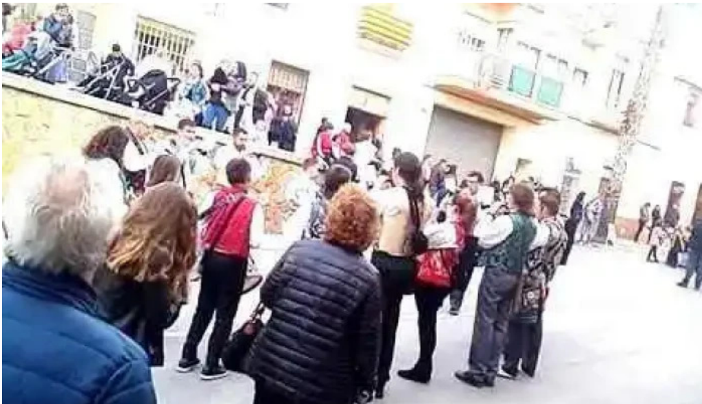
Ermita de sant vicent ferrer videos