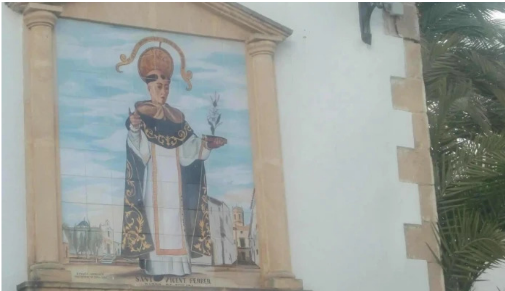
Ermita de sant vicent ferrer comentarios