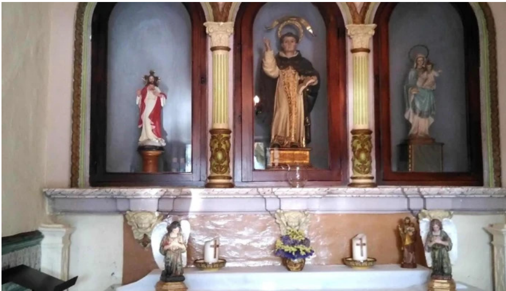
Ermita de sant vicent ferrer sitio web