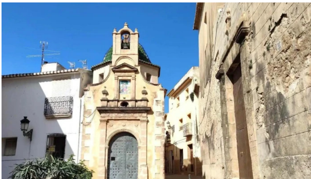
Ermita de la divina pastora capilla