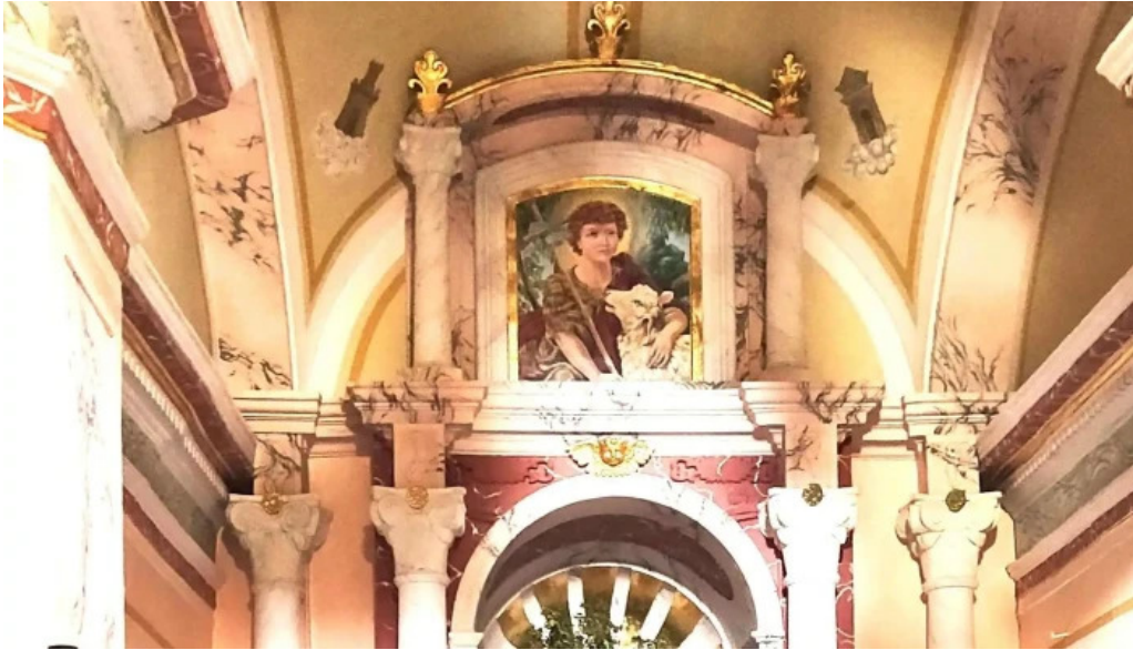
Ermita de la divina pastora sitio web