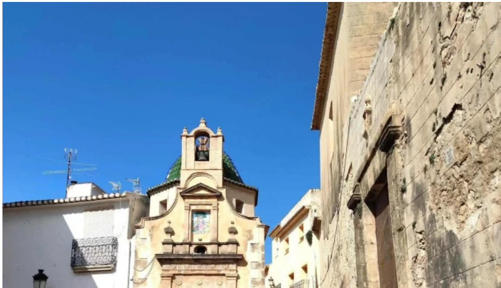
Ermita de la divina pastora instagram