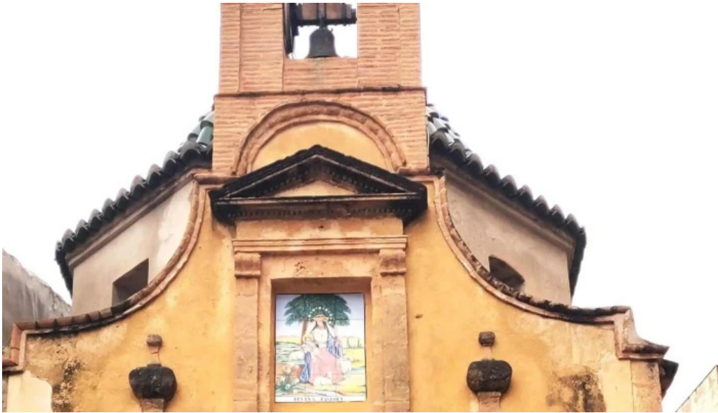
Ermita de la divina pastora ubicacion