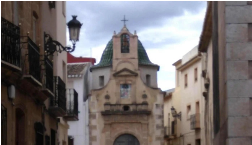
Ermita de la divina pastora teulada