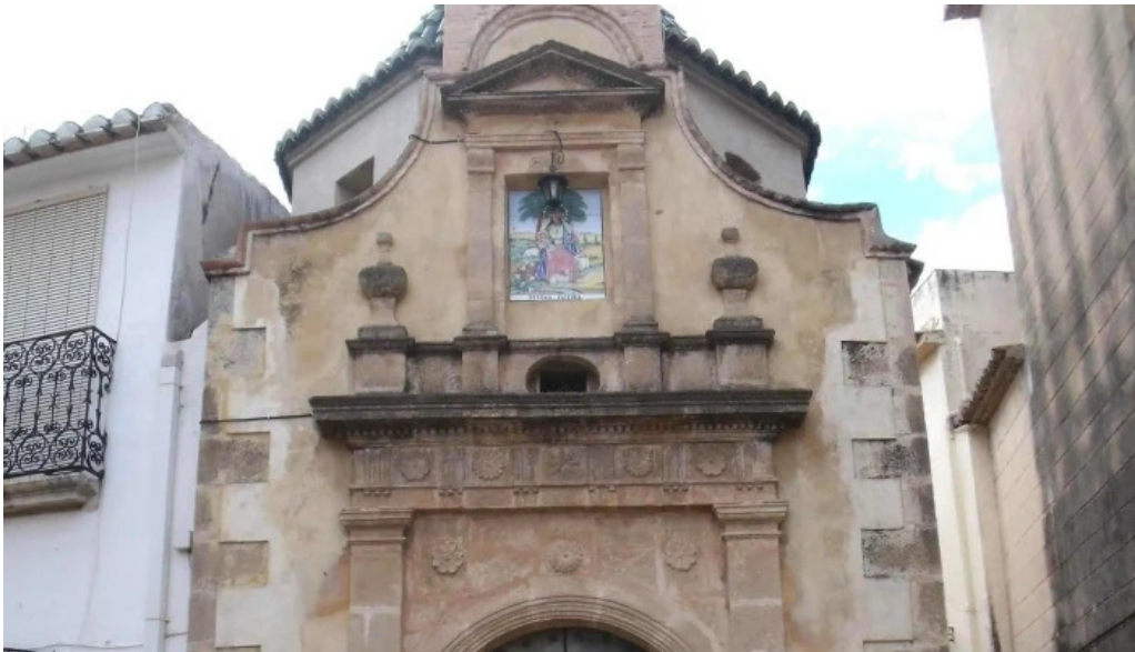
Ermita de la divina pastora numero