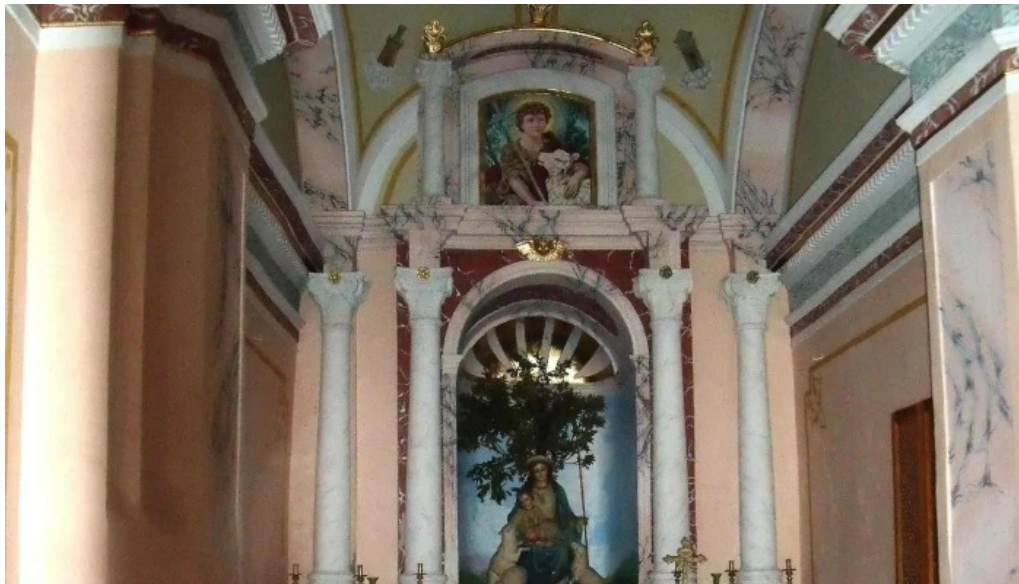
Ermita de la divina pastora videos