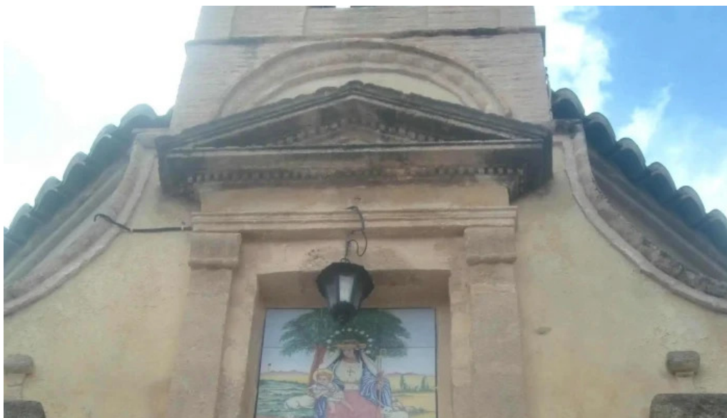
Ermita de la divina pastora fotos