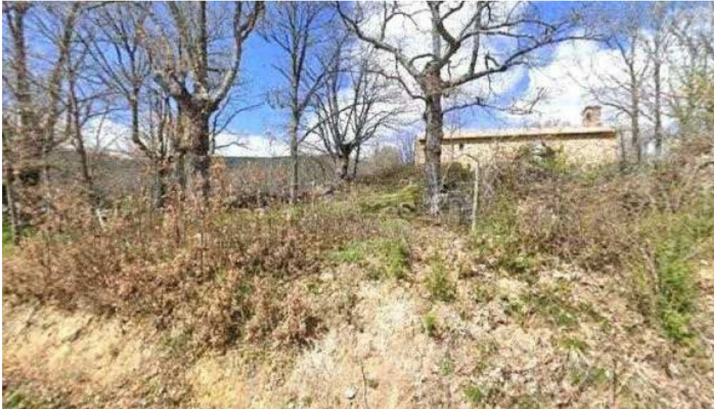
Ermita abierto ahora