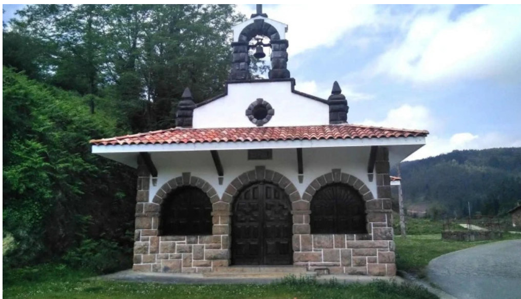
Ermita de san antonio y santa ana capilla