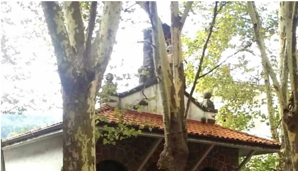
Ermita de san antonio y santa ana sopuerta