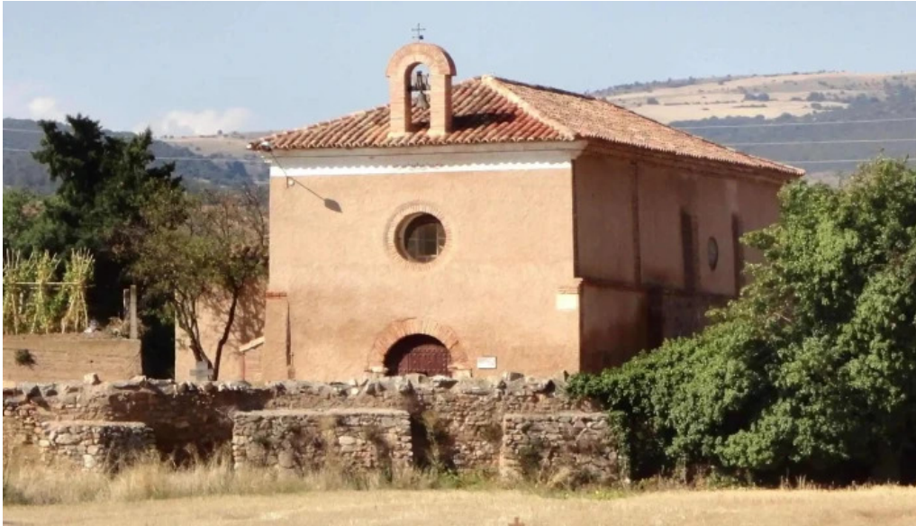
Ermita de la virgen del buen reposo capilla