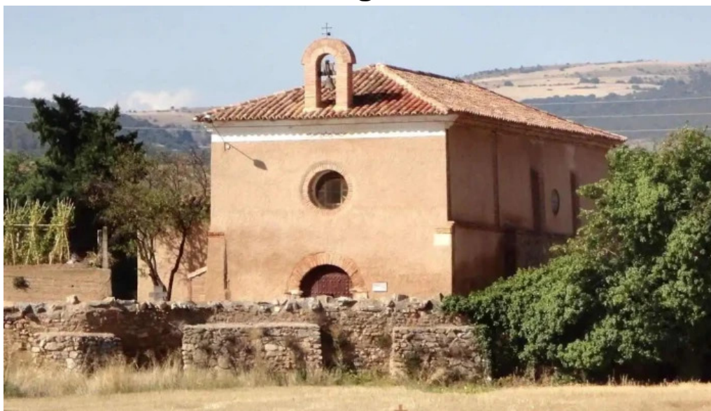
Ermita de la virgen del buen reposo san martin del rio