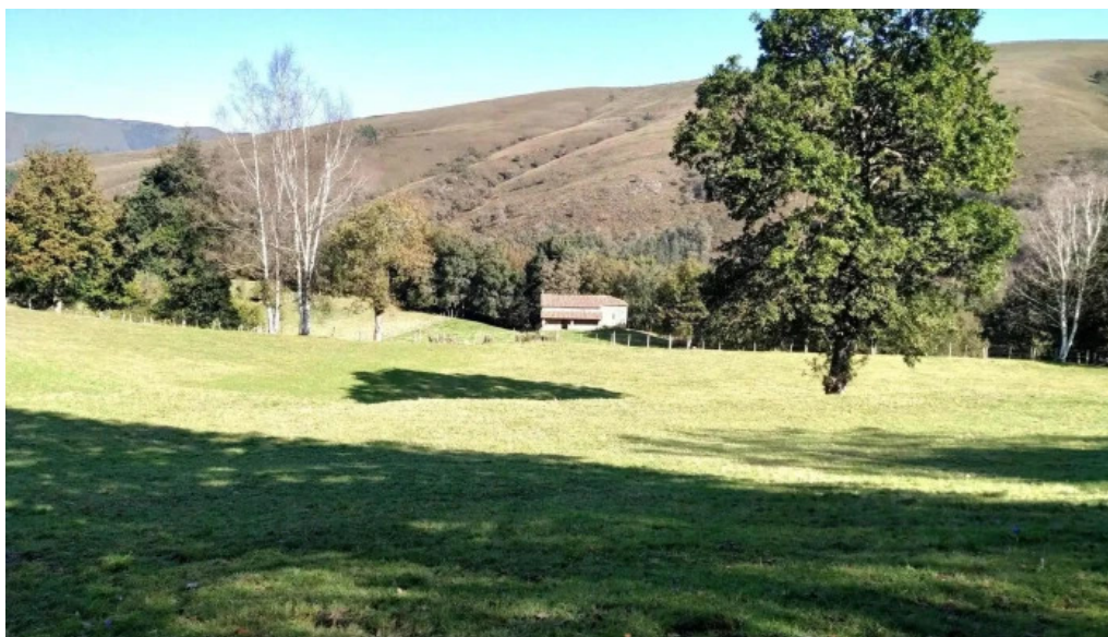
Ermita de san fructuoso capilla