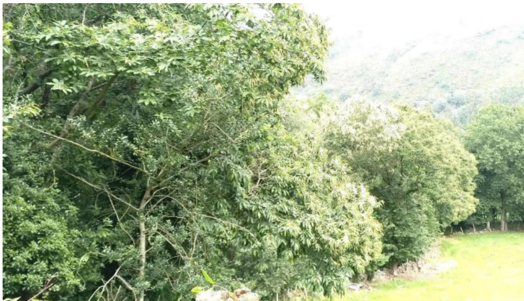
Ermita de san fructuoso ruente