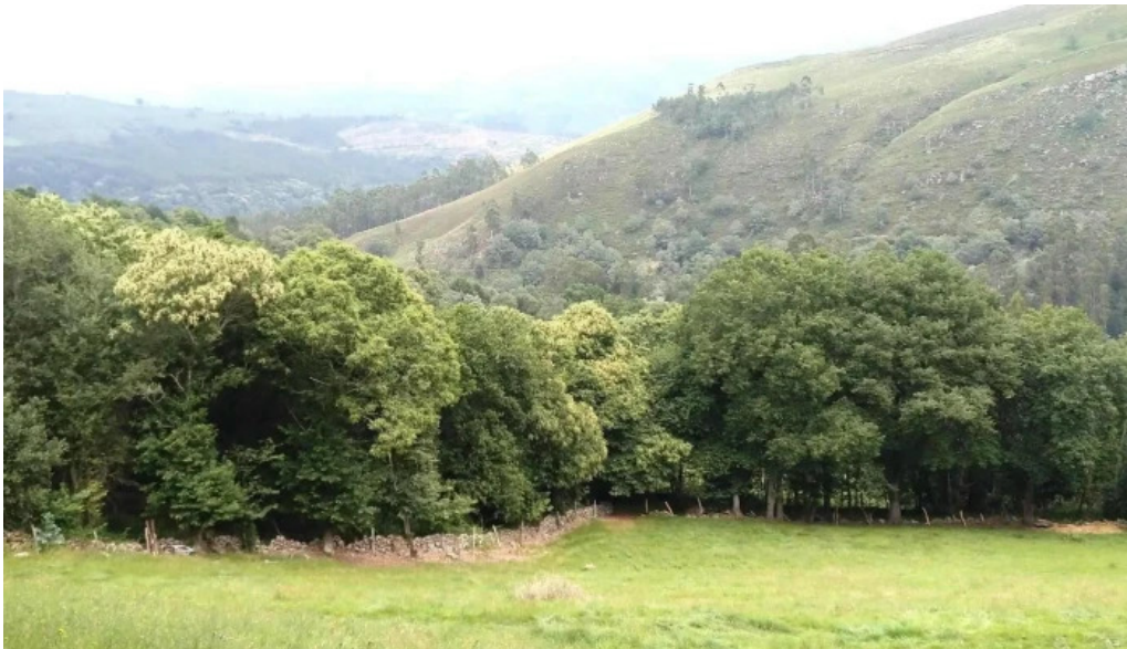
Ermita de san fructuoso promocion