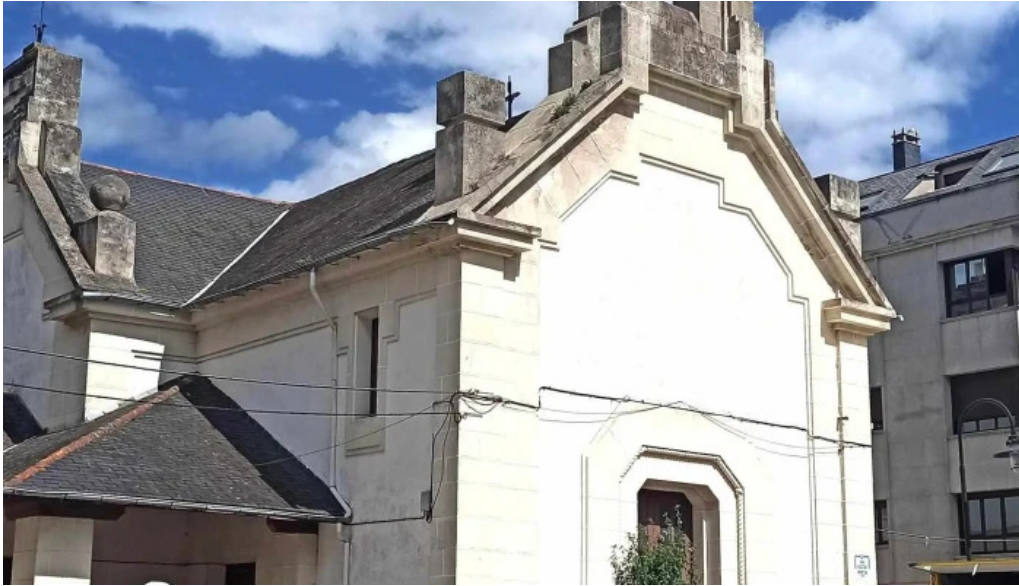
Iglesia de la orden tercera ribadeo