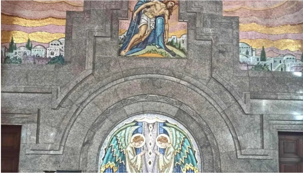
Iglesia de la orden tercera horario