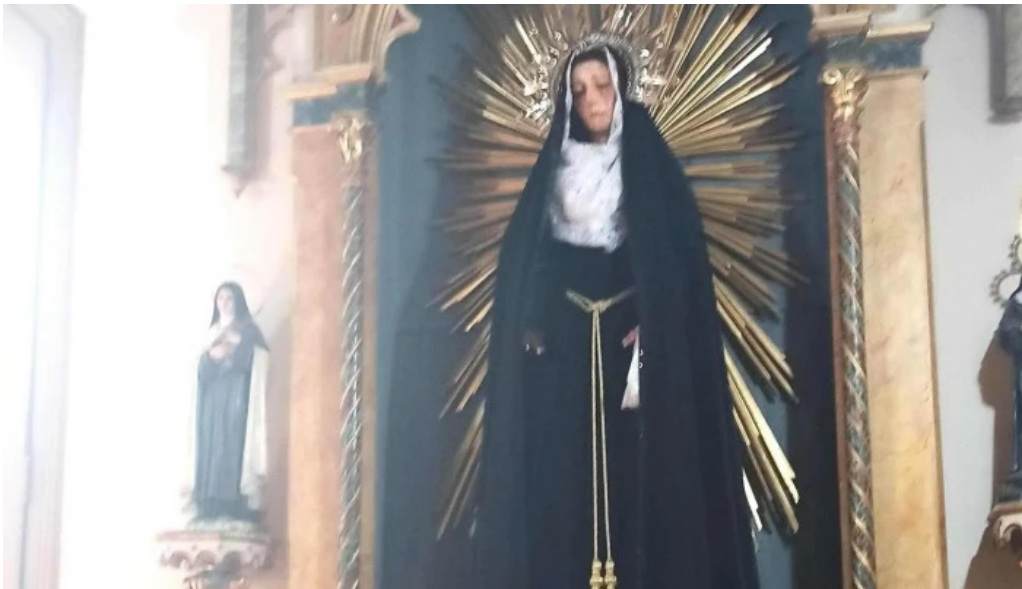
Iglesia de la orden tercera donde