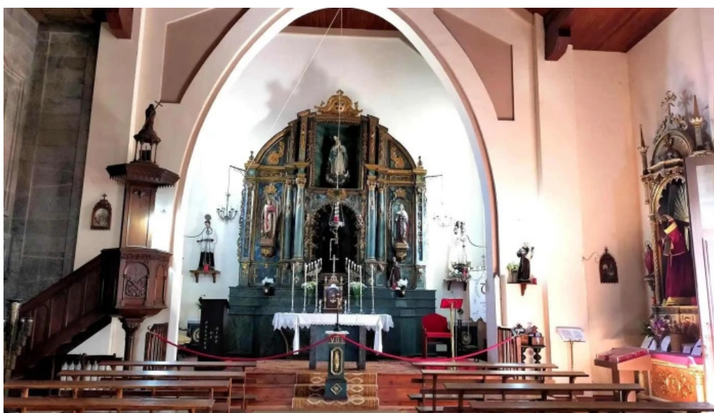
Iglesia de la orden tercera capilla