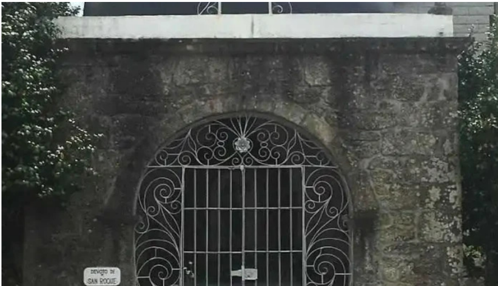
Capilla de san roque pontevedra