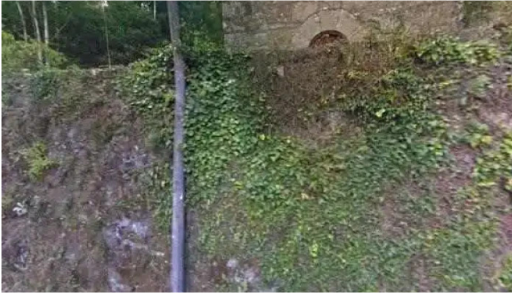
Capilla de san roque puntaje