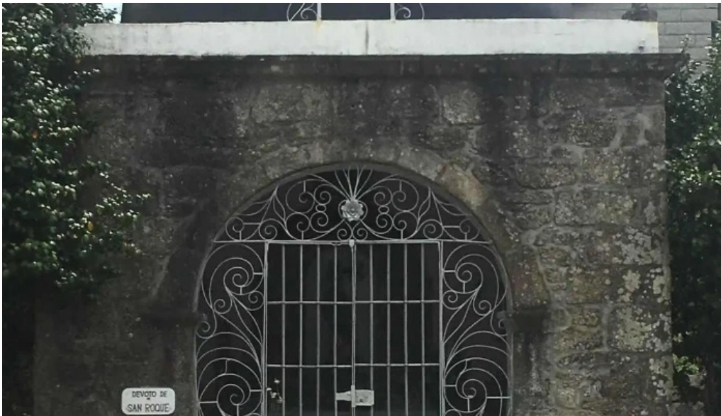
Capilla de san roque capilla