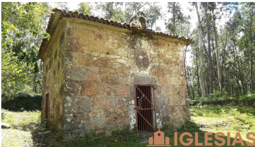
Capilla de nuestra senora de la concepcion pontevedra