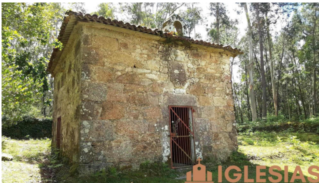
Capilla de nuestra senora de la concepcion capilla