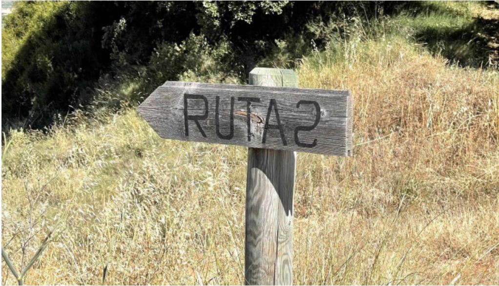
Torresena chapel penaguila