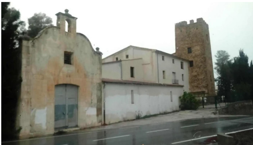
Torresena chapel capilla