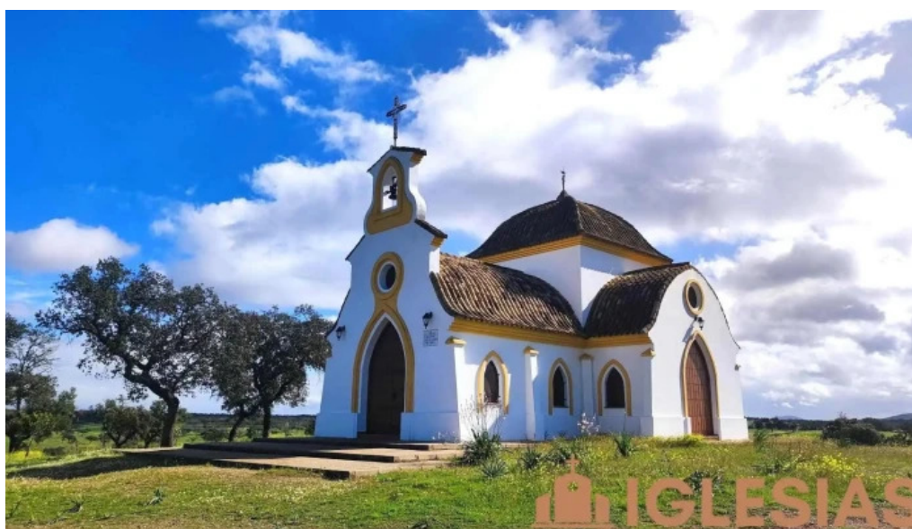
Ermita de la santa cruz capilla