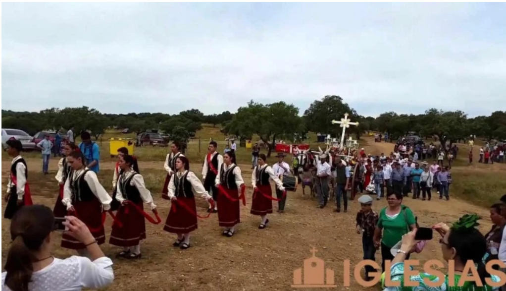
Ermita de la santa cruz videos