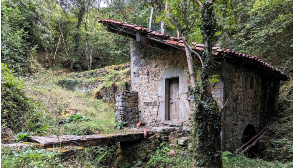
Ermita de san roque videos