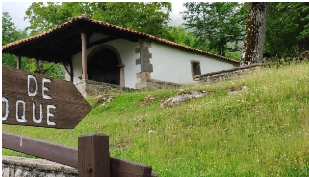
Ermita de san roque instagram