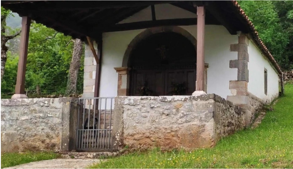
Ermita de san roque precios