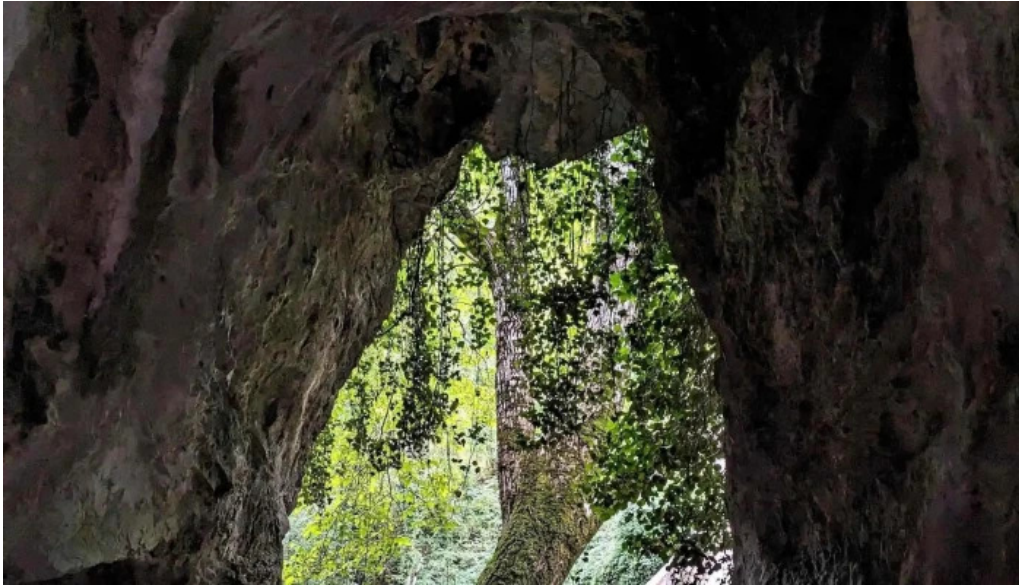
Ermita de san roque numero