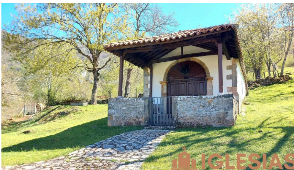
Ermita de san roque capilla