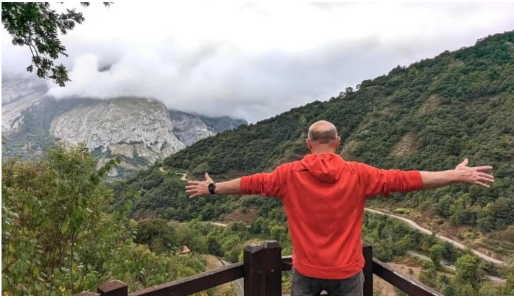
Ermita de san roque oseja de sajambre