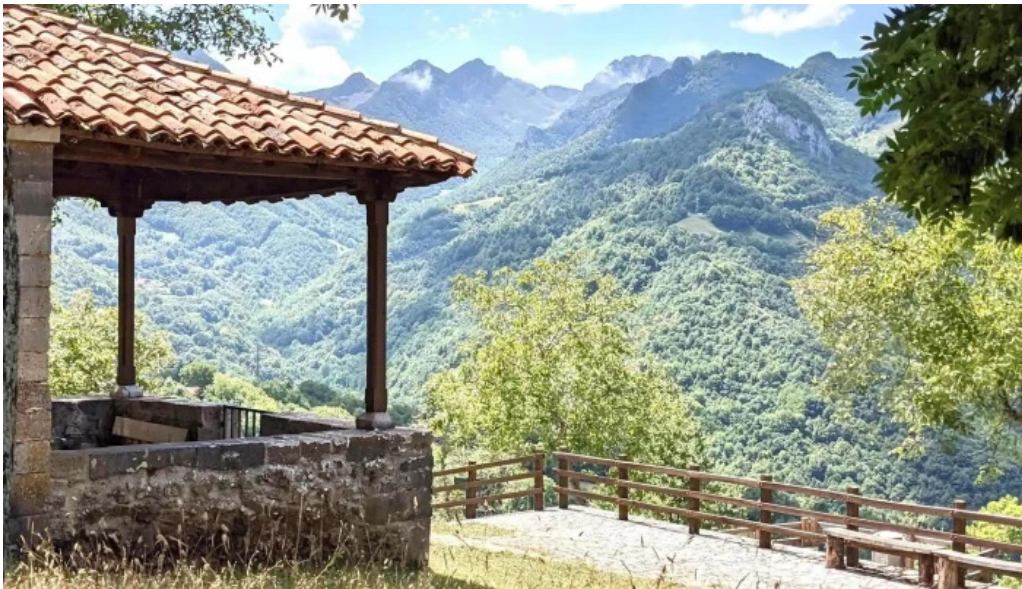
Ermita de san roque promocion