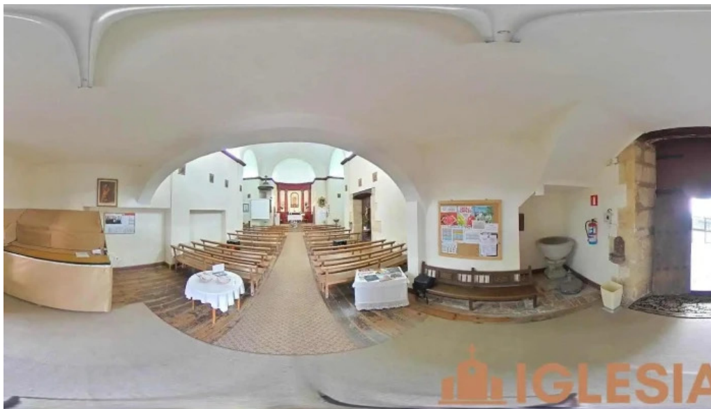
Ermita de santa maria magdalena nocedal