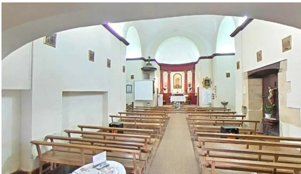
Ermita de santa maria magdalena capilla