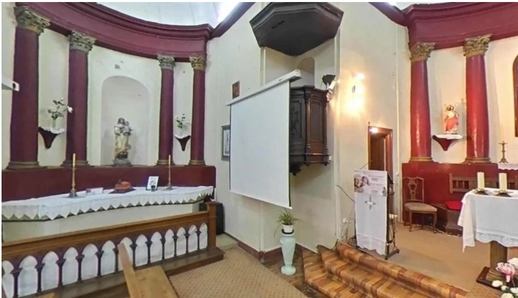
Ermita de santa maria magdalena fotos