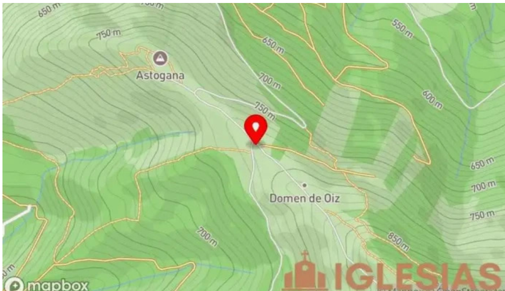
Ermita san kristobal mapa