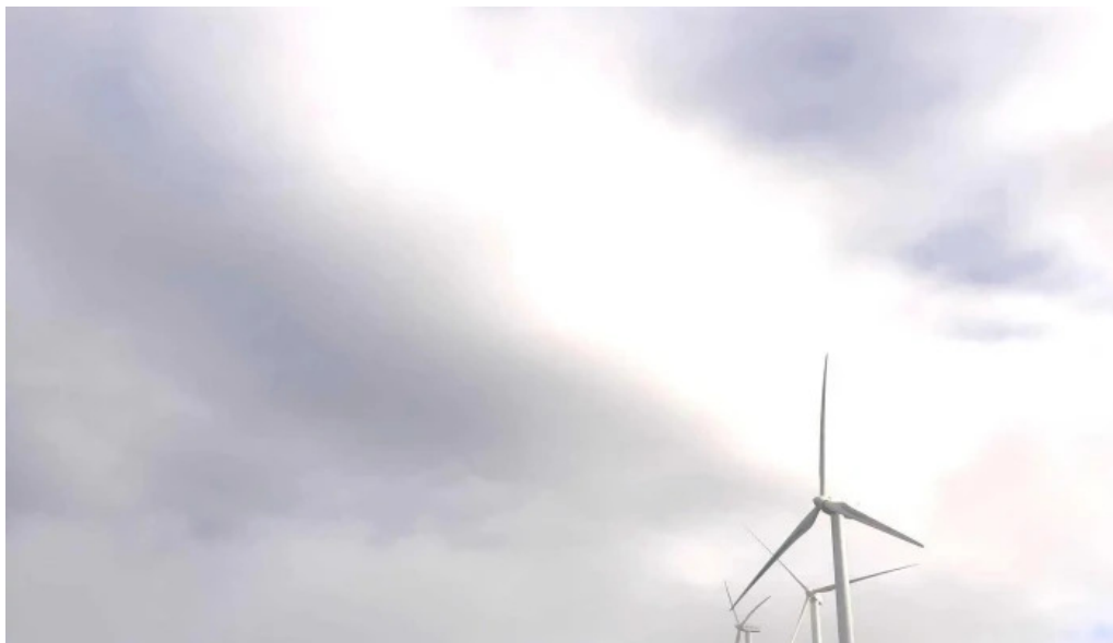
Ermita san kristobal instagram