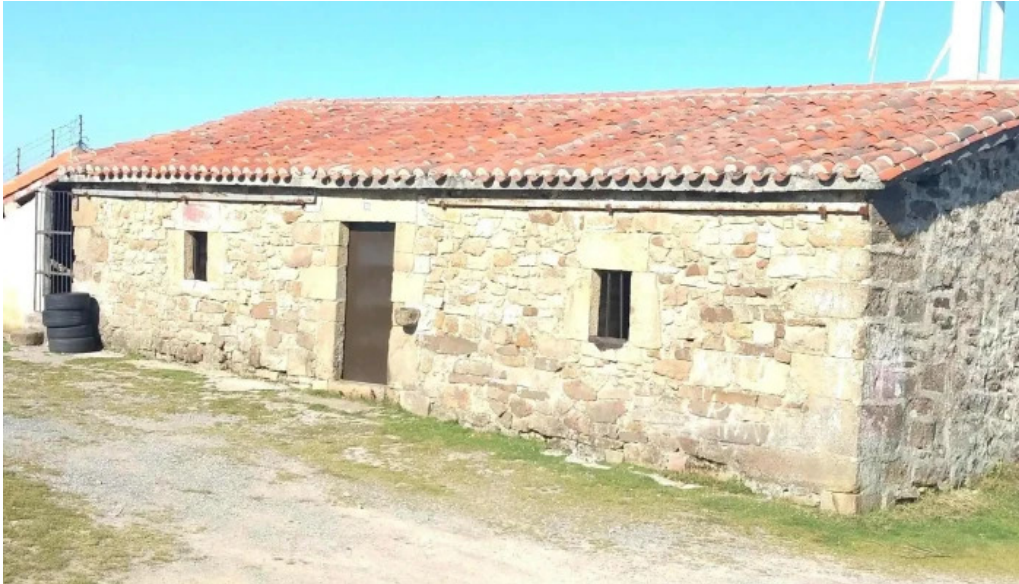
Ermita san kristobal cerca de mi