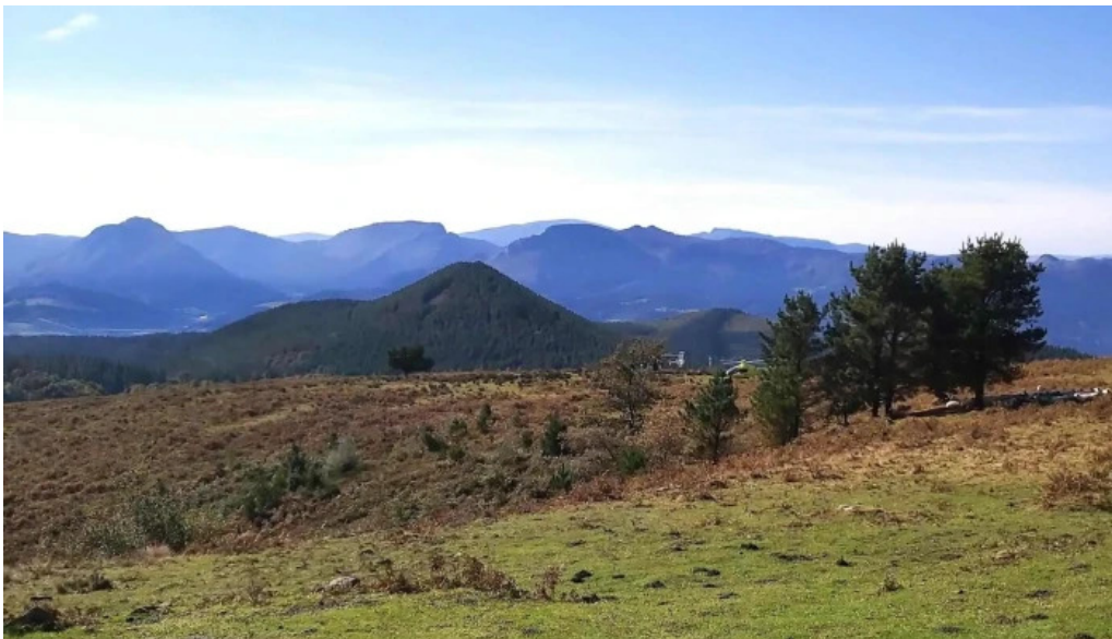
Ermita san kristobal ubicacion