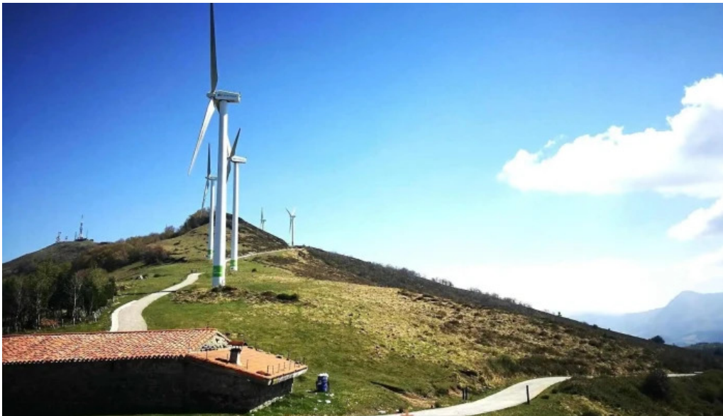
Ermita san kristobal capilla