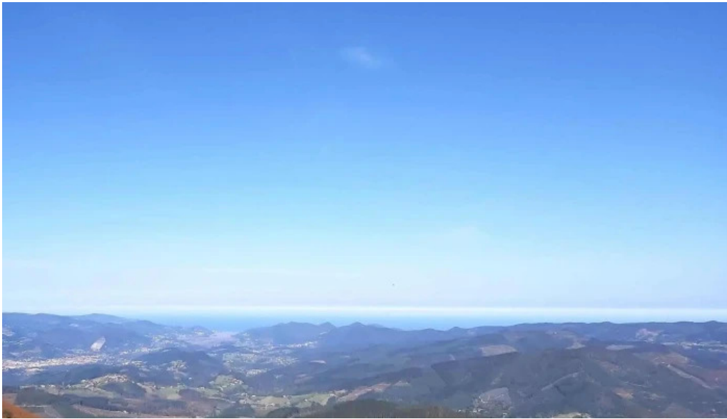
Ermita san kristobal videos