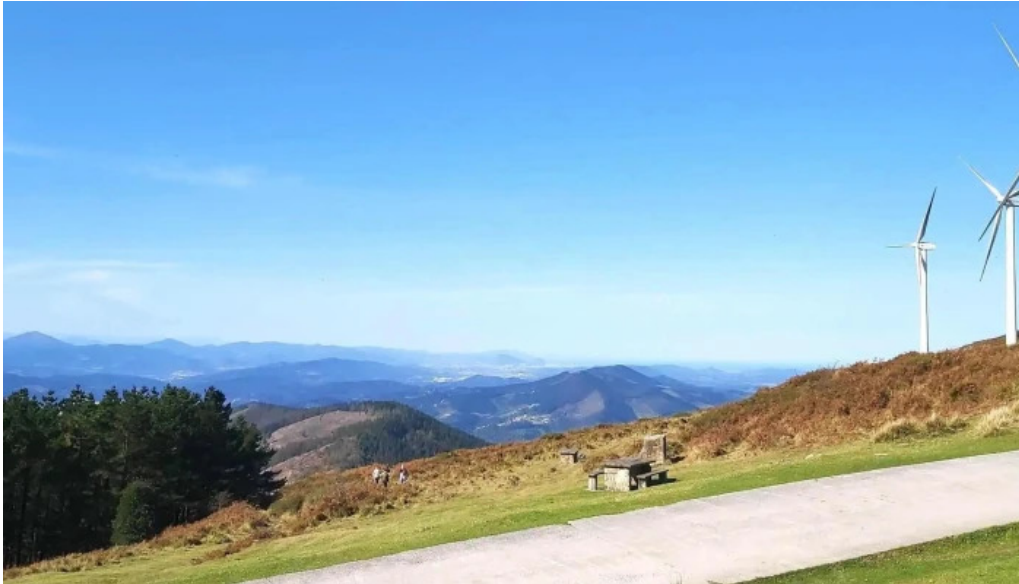
Ermita san kristobal horario