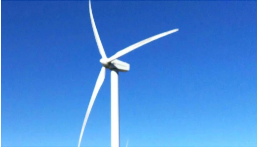
Ermita san kristobal numero