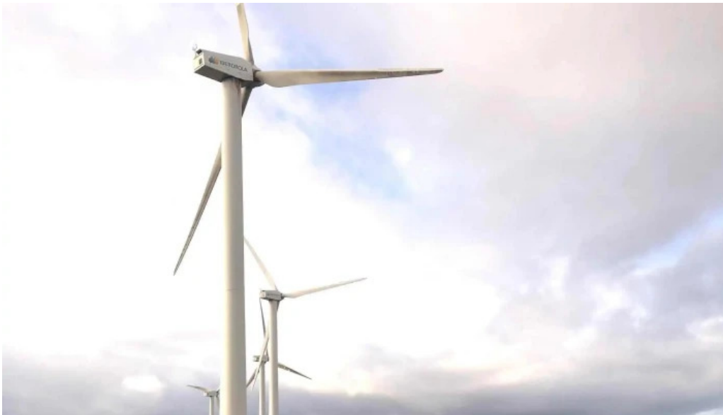
Ermita san kristobal munitibar arbatzegi gerrikaitz