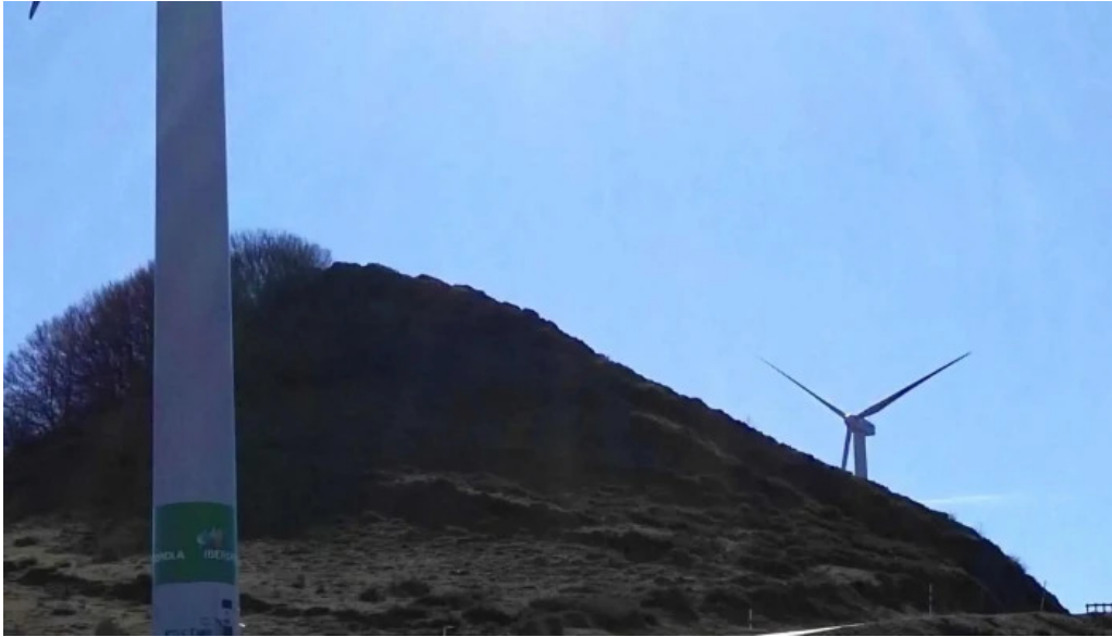
Ermita san kristobal telefono