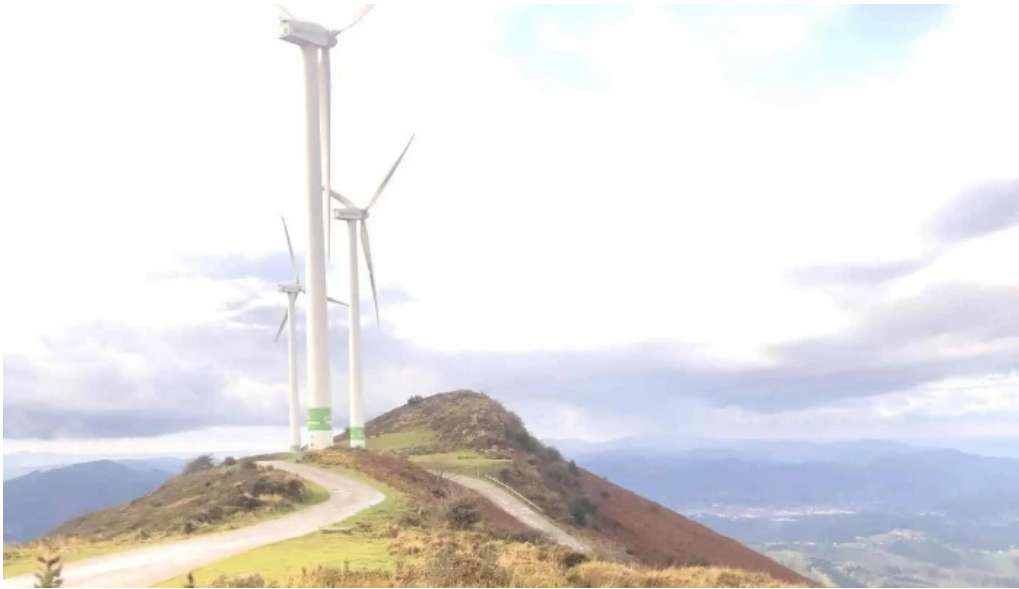
Ermita san kristobal direccion