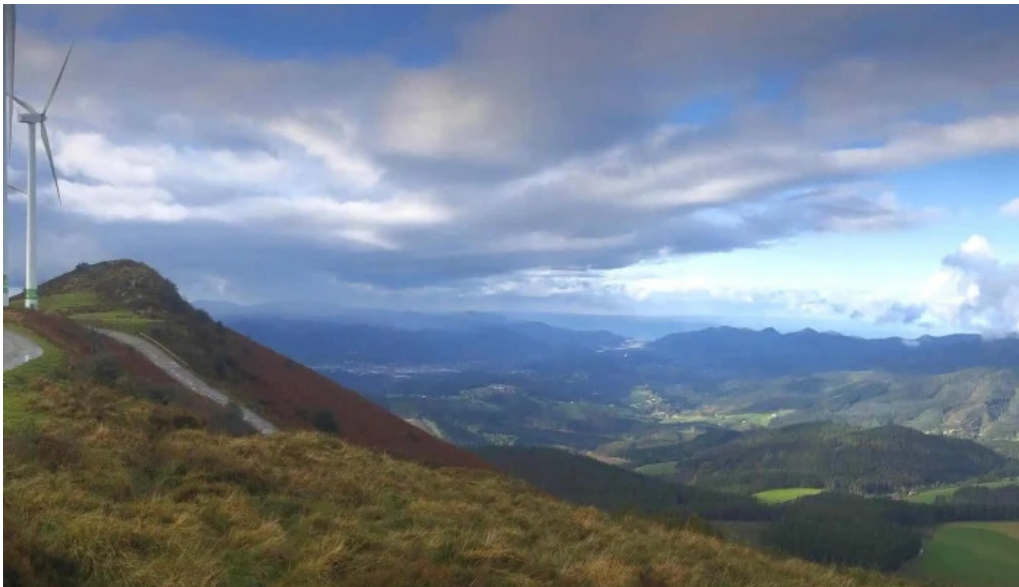
Ermita san kristobal comentarios