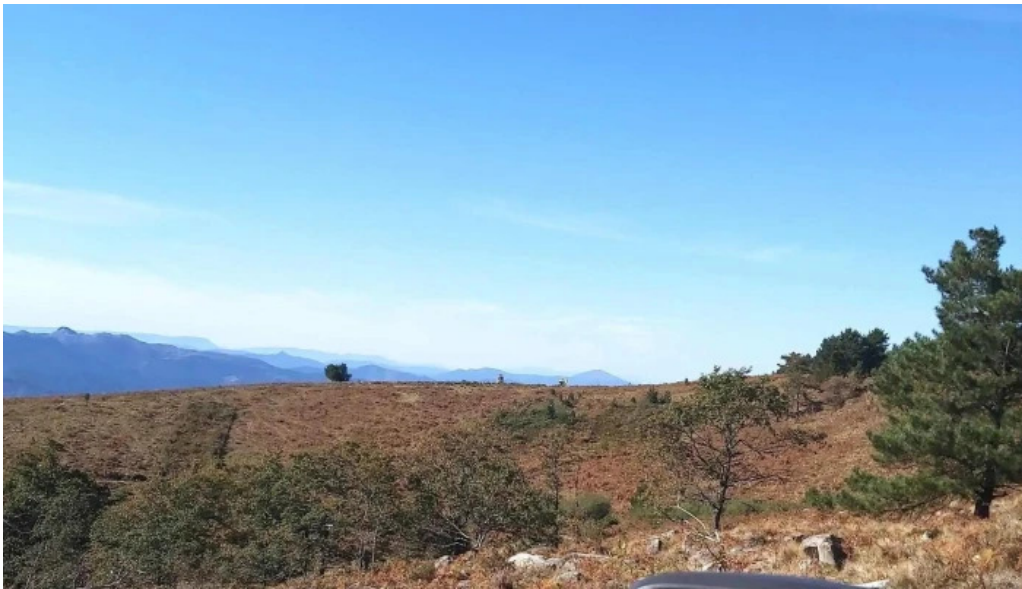
Ermita san kristobal precios