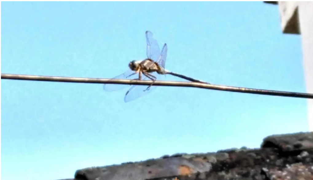
Ermita de san roque capilla