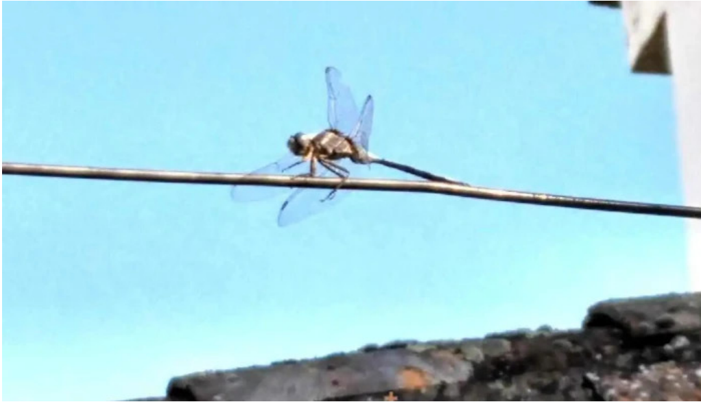
Ermita de san roque mirandilla