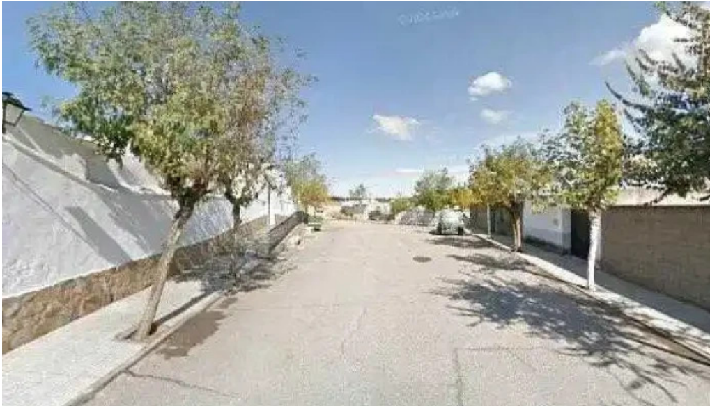
Ermita de san roque cerca de mi