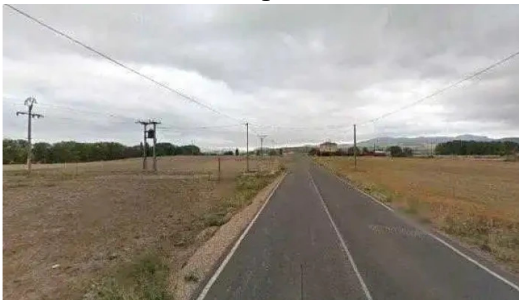
Ermita de san anton antigua iglesia de san cipriano de la nave videos