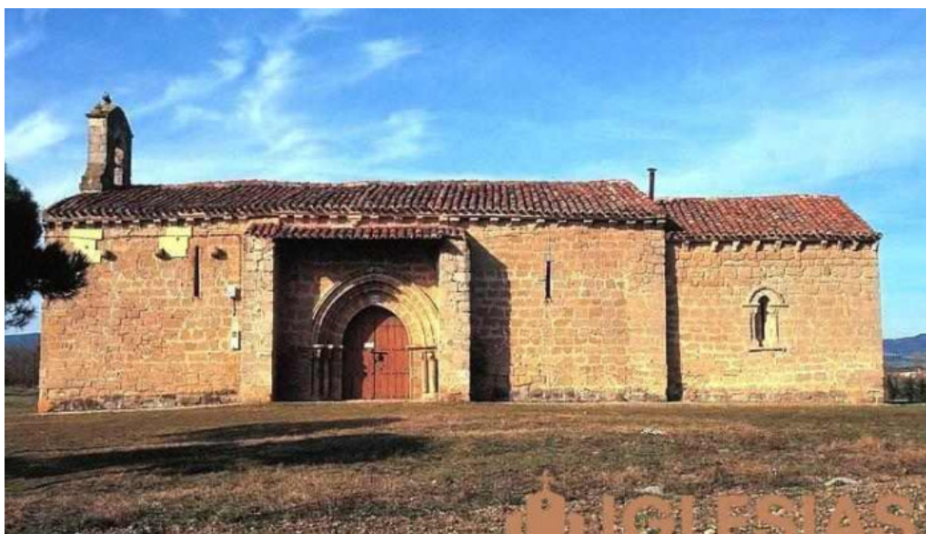
Ermita de san anton antigua iglesia de san cipriano de la nave miranda de ebro