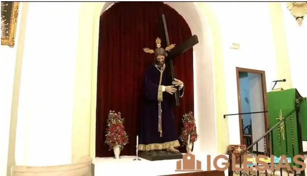
Capilla del nino jesus del propietario