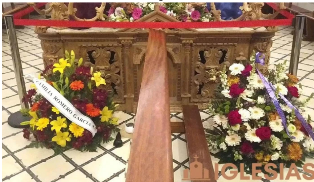
Capilla del niño jesus videos