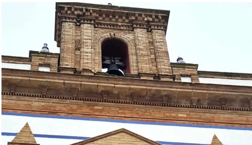
Capilla del niño jesus puntaje