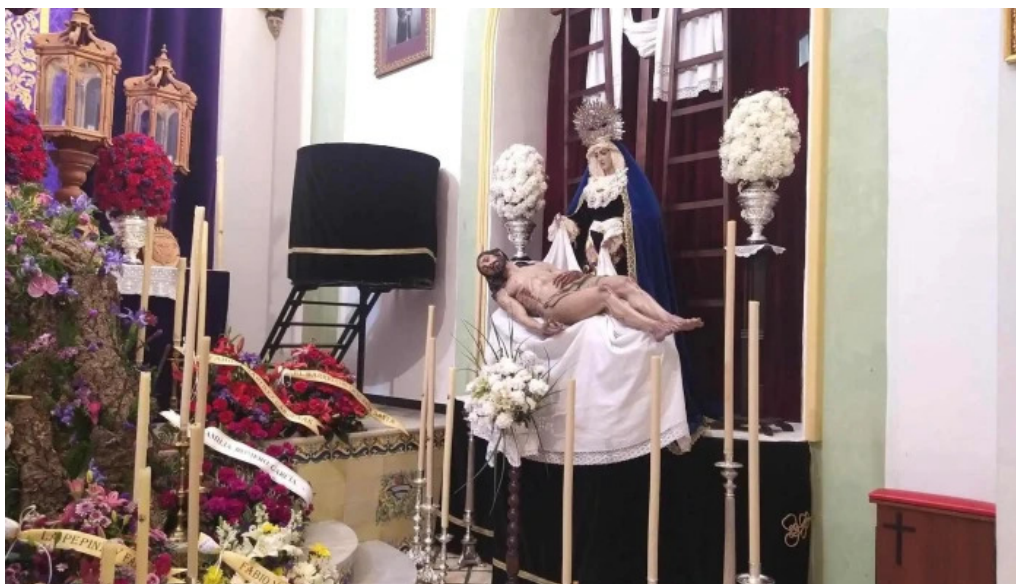
Capilla del niño jesus capilla