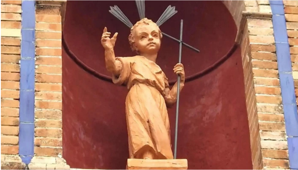
Capilla del nino jesus manzanilla