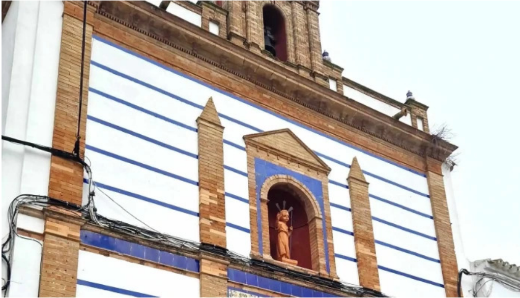
Capilla del niño jesus numero