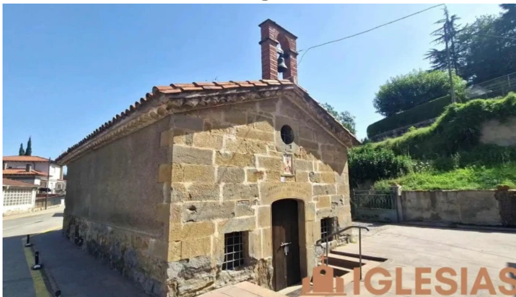
Capella sant sebastia videos