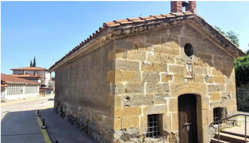
Capella sant sebastia les preses