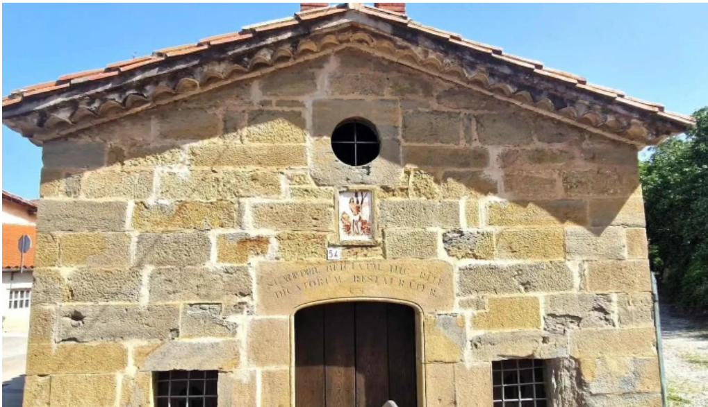
Capella sant sebastia fotos