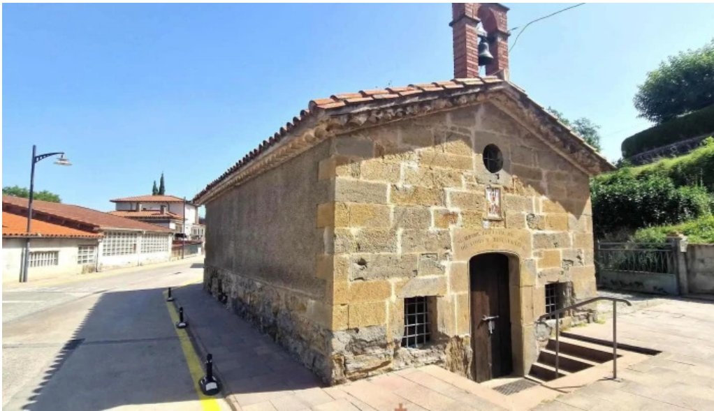
Capella sant sebastia capilla