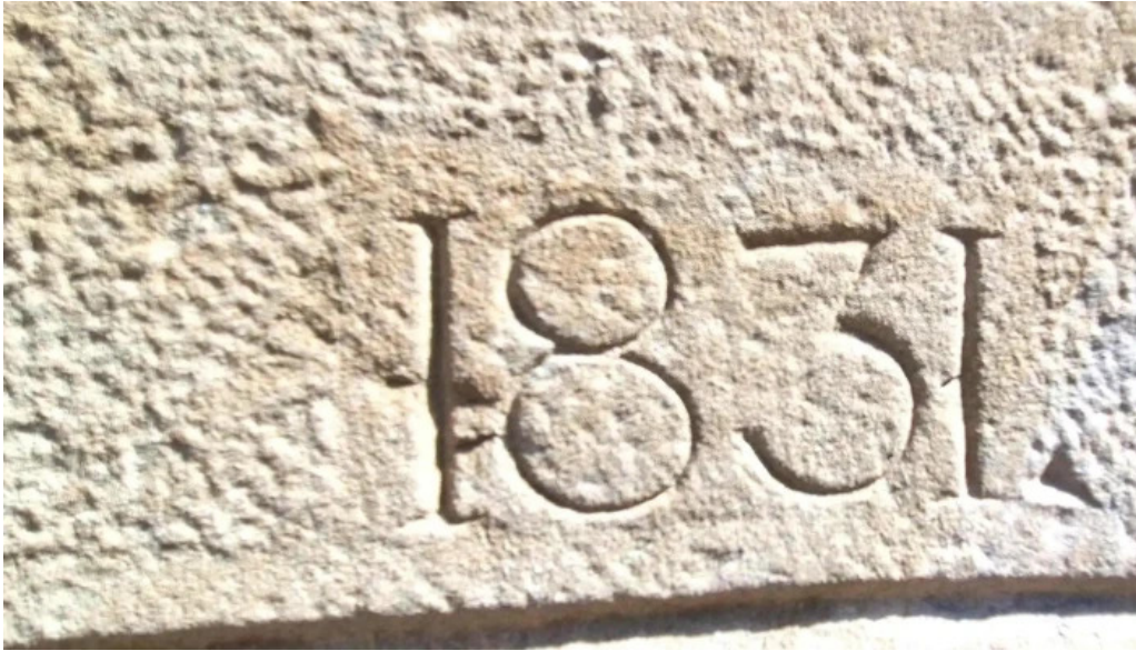
Capella sant sebastia direccion