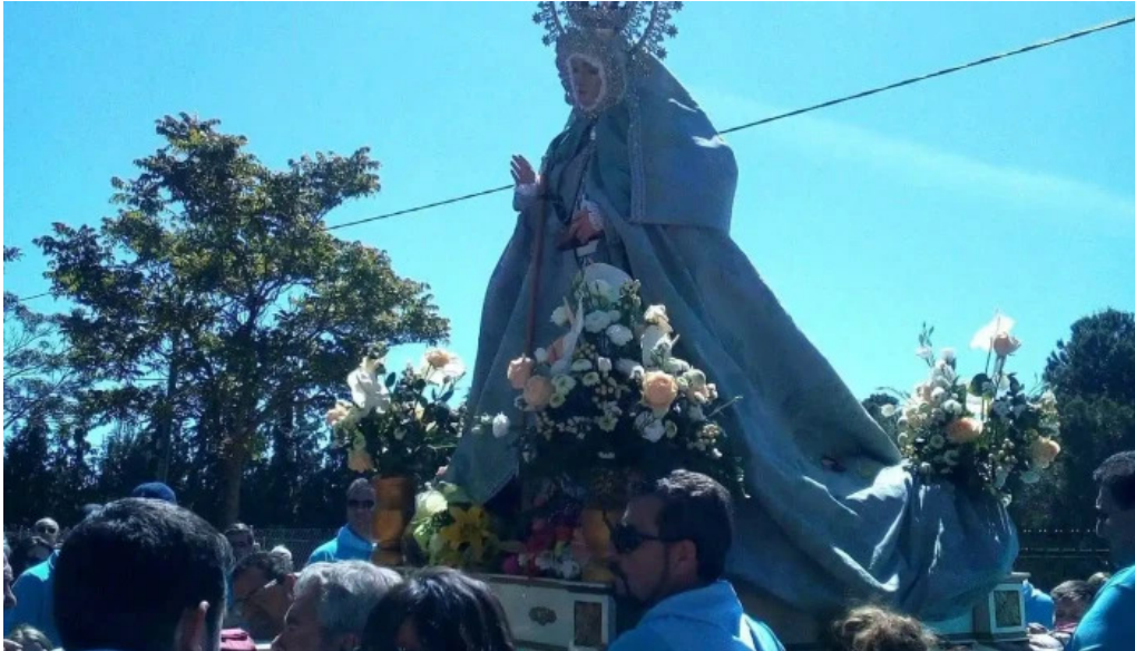
Ermita de san isidro capilla