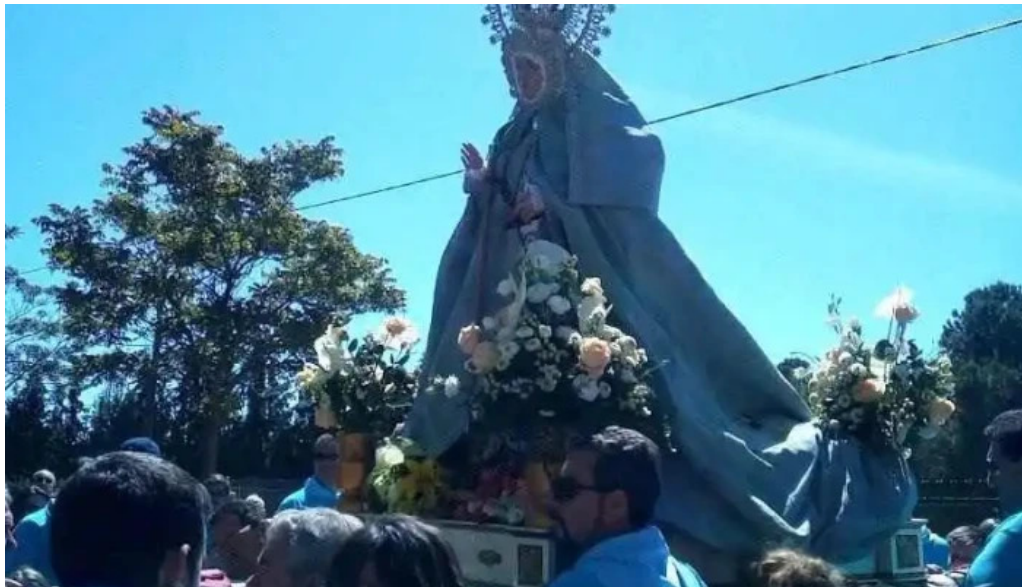
Ermita de san isidro la roda