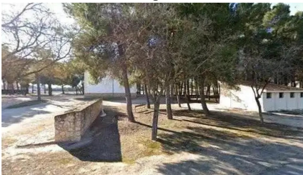
Ermita de san isidro videos