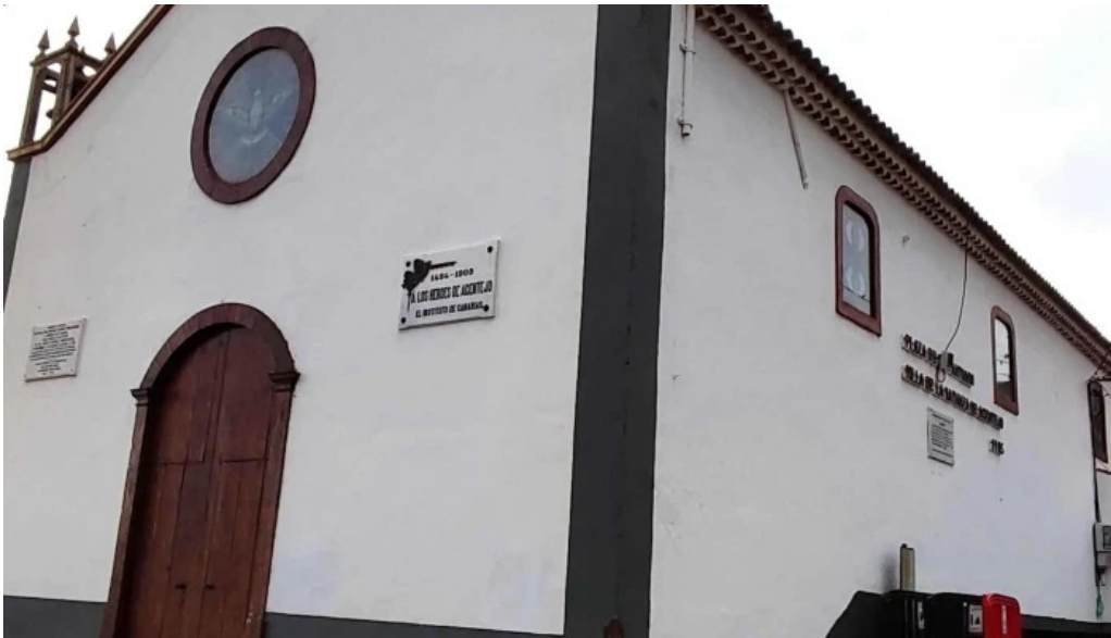
Ermita de san antonio abad comentario 2