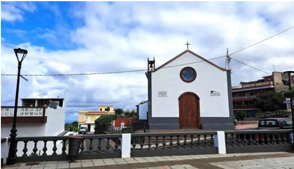
Ermita de san antonio abad la matanza de acentejo