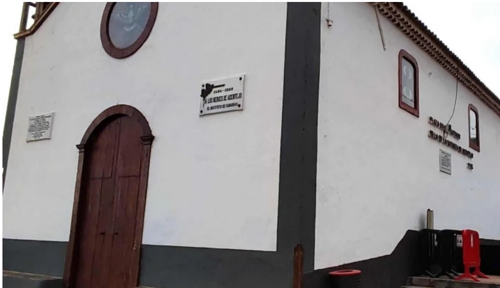
Ermita de san antonio abad comentario 1