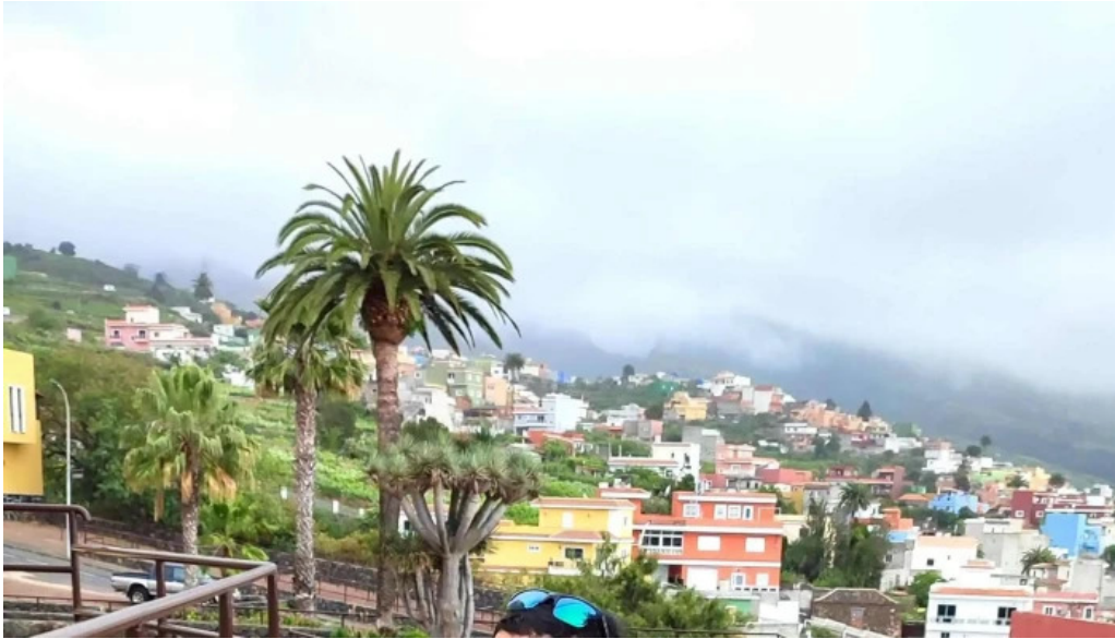
Ermita de san antonio abad comentario 3