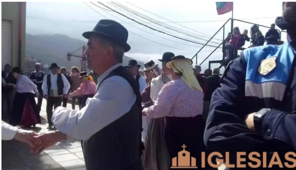
Ermita de san antonio abad videos