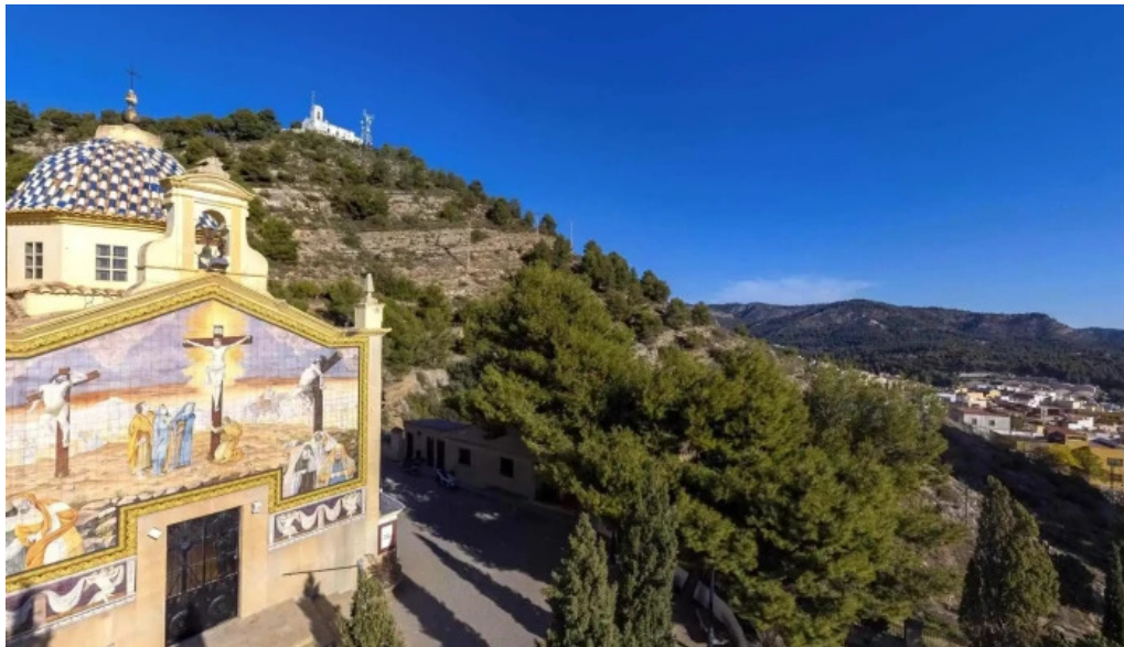
Ermita del calvario telefono