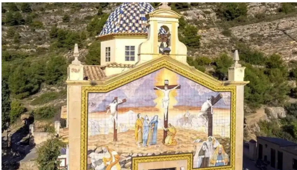
Ermita del calvario capilla