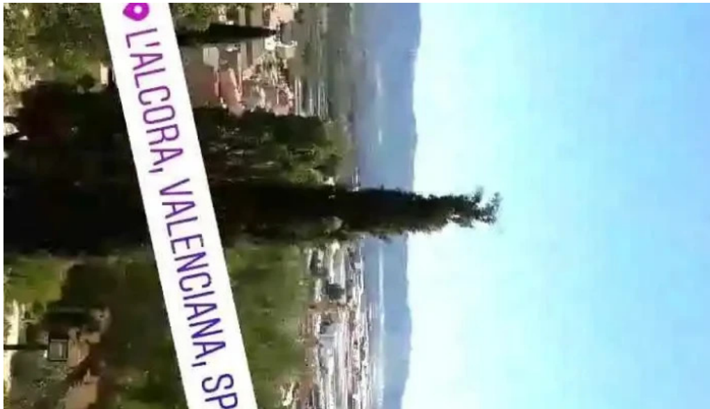
Ermita del calvario videos