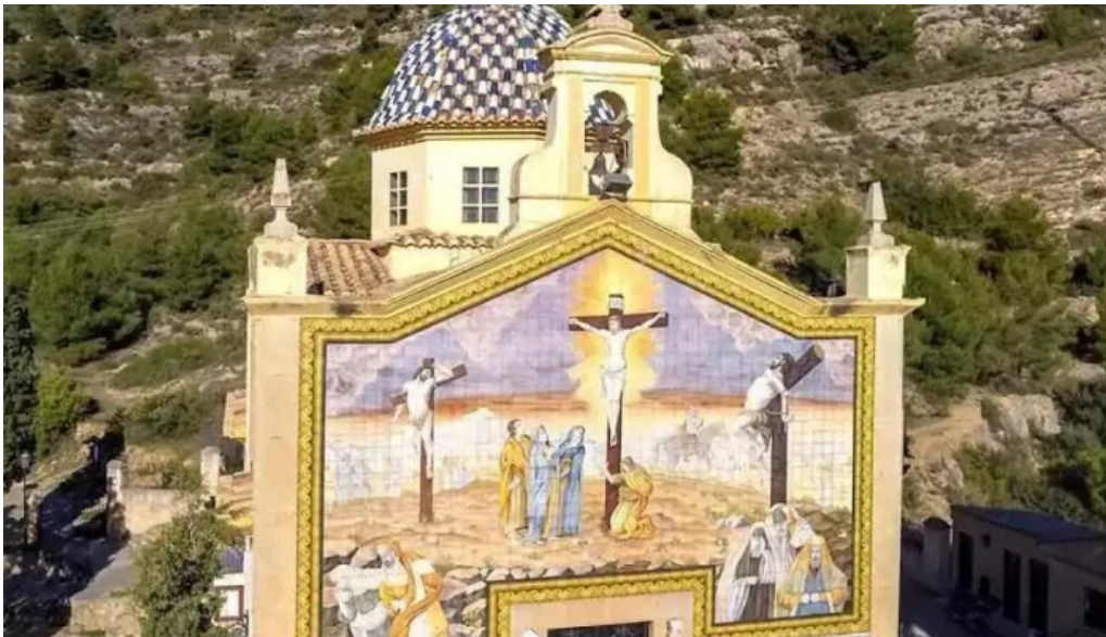
Ermita del calvario I alcora