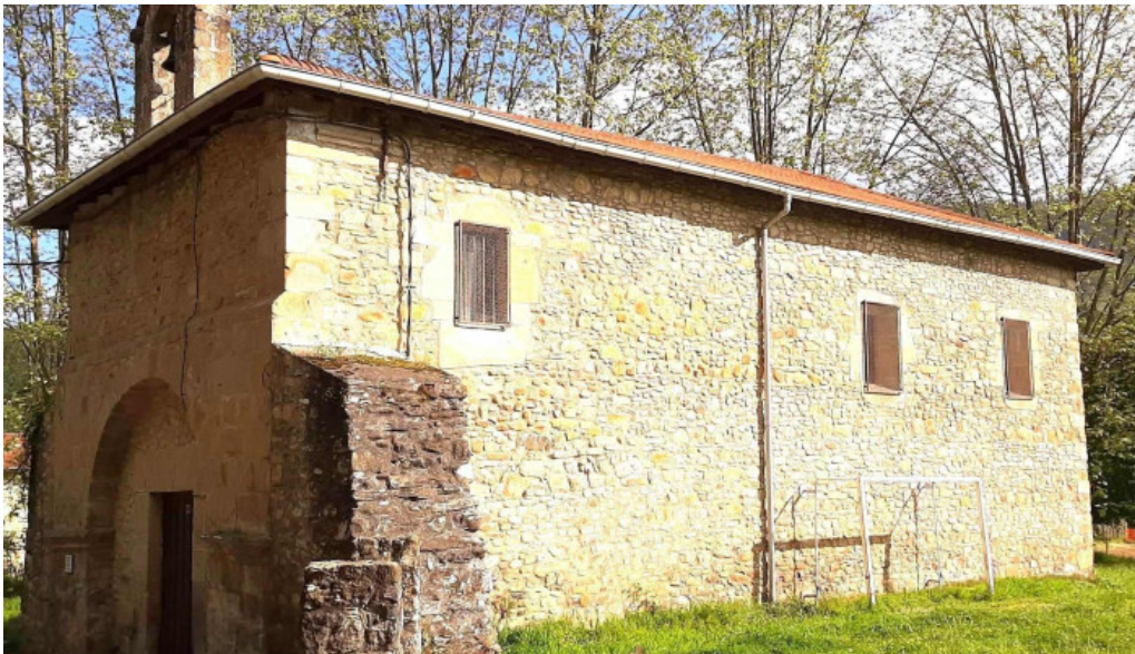
Ermita de san martin de iturriaga capilla