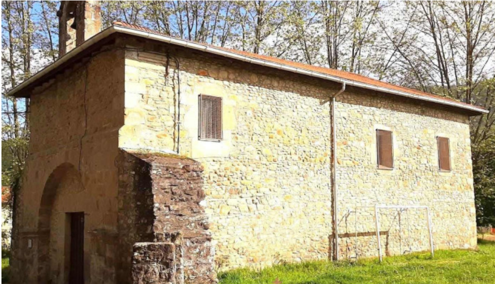
Ermita de san martin de iturriaga guenes