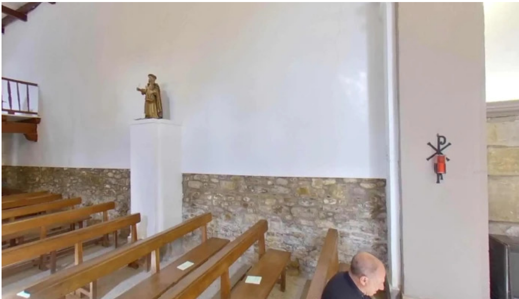
Ermita de san martin de iturriaga videos